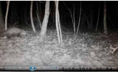
Steenmarter gefilmd door cameraval in Cleydaelhof

Steenmarters jagen in de dekking van houtkanten, heggen, bosjes, muren en struikgewas. Ze eten zowel dierlijk als plant-