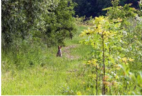
Vos in de Reukens - Luk Smets

Een steenmarter lust net als de vos wel een kippetje, dus ook voor hem zijn de voorgestelde oplossingen tegen ongewenst bezoek van de vos zinvol. Steenmarters kunnen echter bovendien een zolder uitkiezen om hun kroost groot te brengen. Hun uitwerpselen en prooiresten kunnen geurhinder geven.