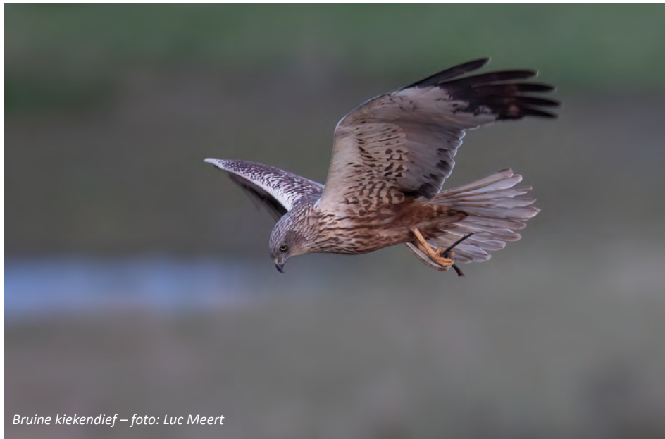
Bruine kiekendief – foto: Luc Meert

Op 2 januari 1976 woedde een zware storm over Noordwest-Europa. In België zorgde stormtij voor enorme problemen in het stroomgebied van de Schelde. In Ruisbroek, dat het epicentrum van de ramp was, ontstond een bres in de dijk waardoor de Vliet uit haar oevers trad. De dorpskern en de omliggende polders werden in een mum van tijd door de rivier overspoeld. Op die manier was pijnlijk duidelijk geworden dat men de afgelopen jaren en zelfs eeuwen de rivier te strak had ingesnoerd. Uit de ramp werd een jaar later het Sigmapijn geboren. Dit had tot doel om de Schelde en haar zijrivieren voortaan meer ruimte te geven. Plaatselijk ging men de dijken versterken en verhogen. Elders werden zones ingericht die overtollig water tijdelijk konden herbergen. Aan het begin van de 21ste eeuw bleek het initiële Sigmapijn niet meer toereikend en in 2005 werd een actualisering op tafel gelegd: er zou nog meer ruimte naar de rivier gaan.