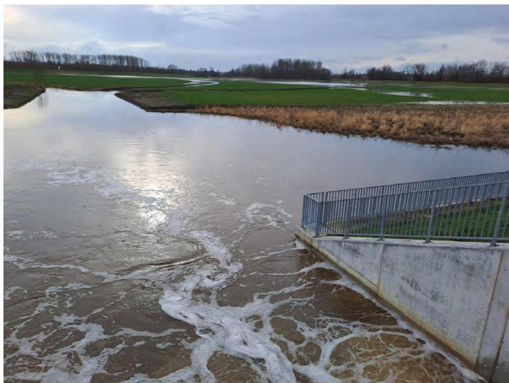
In- en uitwateringsluik GGG Bovenzanden