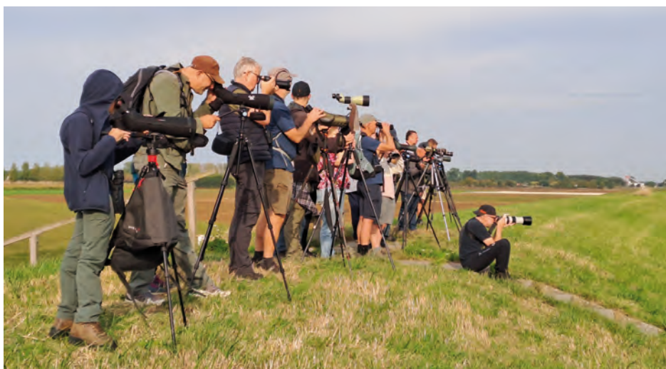
Dagexcursie Westerschelde – Hedwige/Prosper – Doelpolder Noord 20/9/2025 – vogels kijken aan de Westerschelde