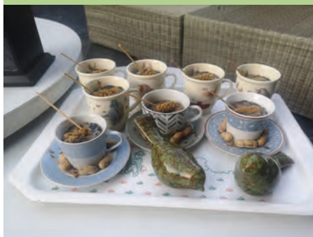
Koken voor de vogels

Deze workshop is een samenwerking tussen Natuurpunt Aartselaar, Huis van het Kind en Gezinsbond Aartselaar