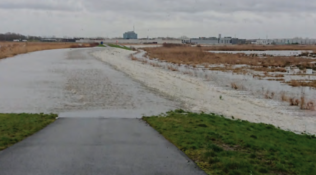
Het Zennegat met stormtij - het water van de Dijle stroomt over de overlooptdijk – foto: Bert Mestdagh

het Zennegat, Battenbroek/Grote Vijver en Bovenzanden. Dit betekent concreet dat bij hoogtij de gebieden via een inwaterings-sluis volstromen. Als het water op de rivier opnieuw zakt lopen de gebieden geleidelijk opnieuw leeg. Nu is het interessante dat binnen deze GGG's de natuur vrij spel krijgt.