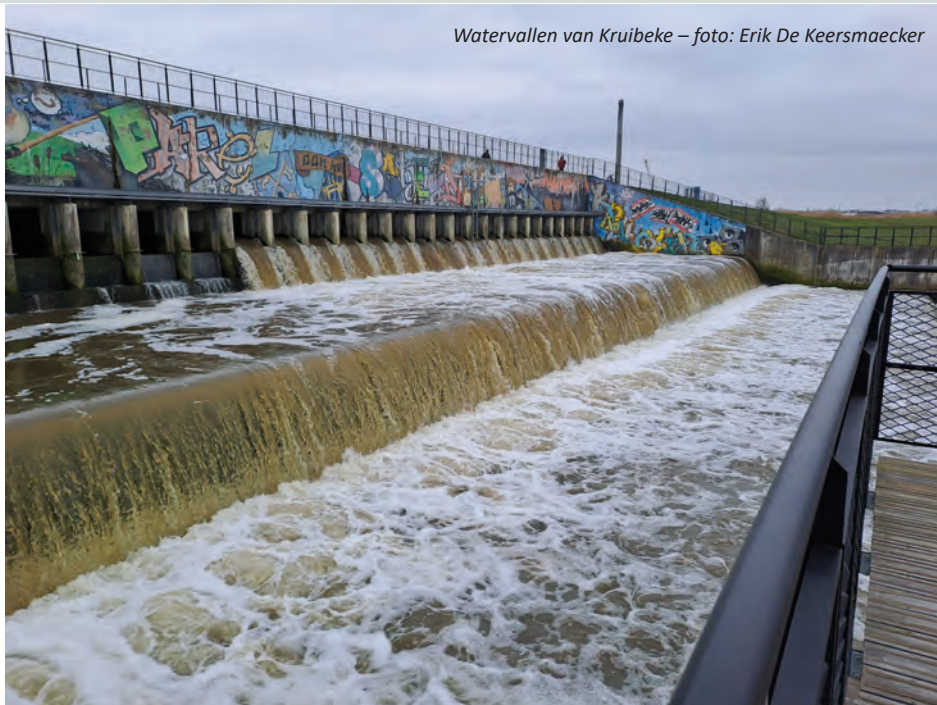
Watervallen van Kruibeke

3. Vanaf dit kijkpunt heb je een prachtig zicht op de brede monding van de Barbierbeek, met in de verte het vlonderpad dat uitnodigt om er over te wandelen. Aan de oevers van de Schelde liggen met laagtij brede slikplaten met diepe greppels bloot, daar zitten dan doorgaans grote groepen meeuwen. Kokmeeuwen, kleine mantelmeeuwen, zilvermeeuwen, soms ook stormmeeuwen, zodra de voorjaarsstrek op gang komt, zoeken oeverlopers er naar voedsel in de greppels. Aan de overkant van de Schelde priemt de schouw van Umicore hoog in de lucht, op het op één na hoogste platform staat een nestkast voor slechtvalk. Misschien kan je