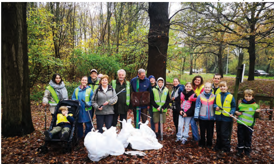
Zwerfvuil ruimen in en nabij het Cleydaelbos