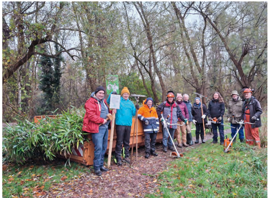
Vrijwilligers Bos N werkmoment Bye bye bamboe 23/11/2025 - foto: Debbie Nys

Tekst en foto: Bart Peleman, vrijwilliger Bos N