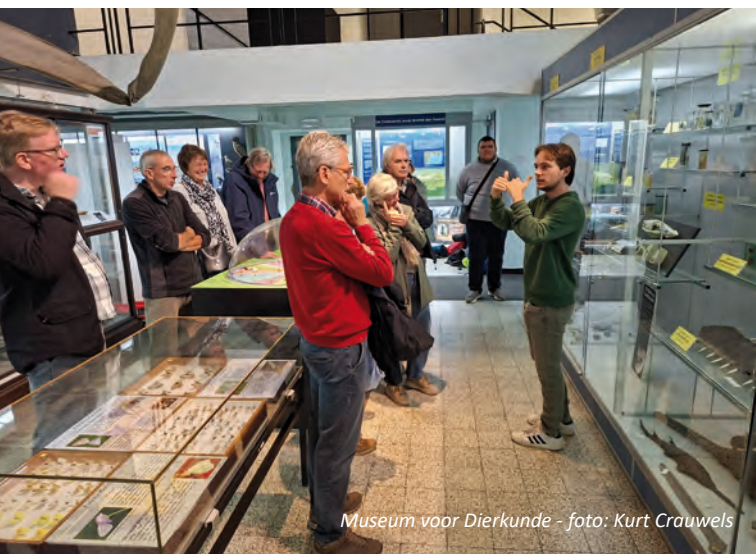
Museum voor Dierkunde