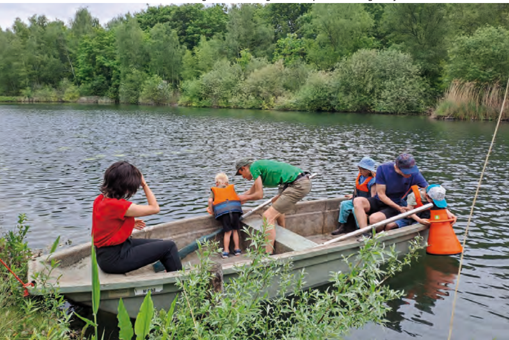
Wilde Snuitdag in het natuurgebied Kleiputten Terhagen

Kamsalamanders staan eveneens hoog in onze jaarlijkse zoekparade. Uitgerust met