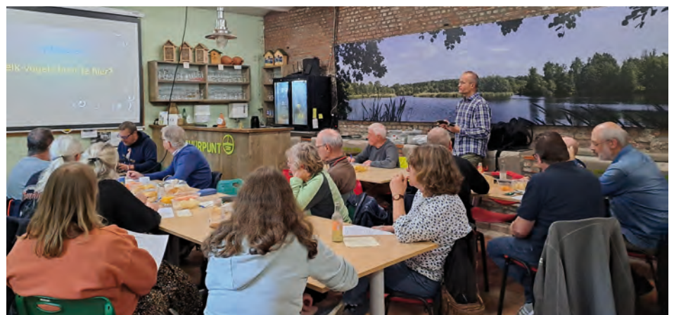
Slotmoment op 11/10/2025 in Natuur.huis de Paardenstal