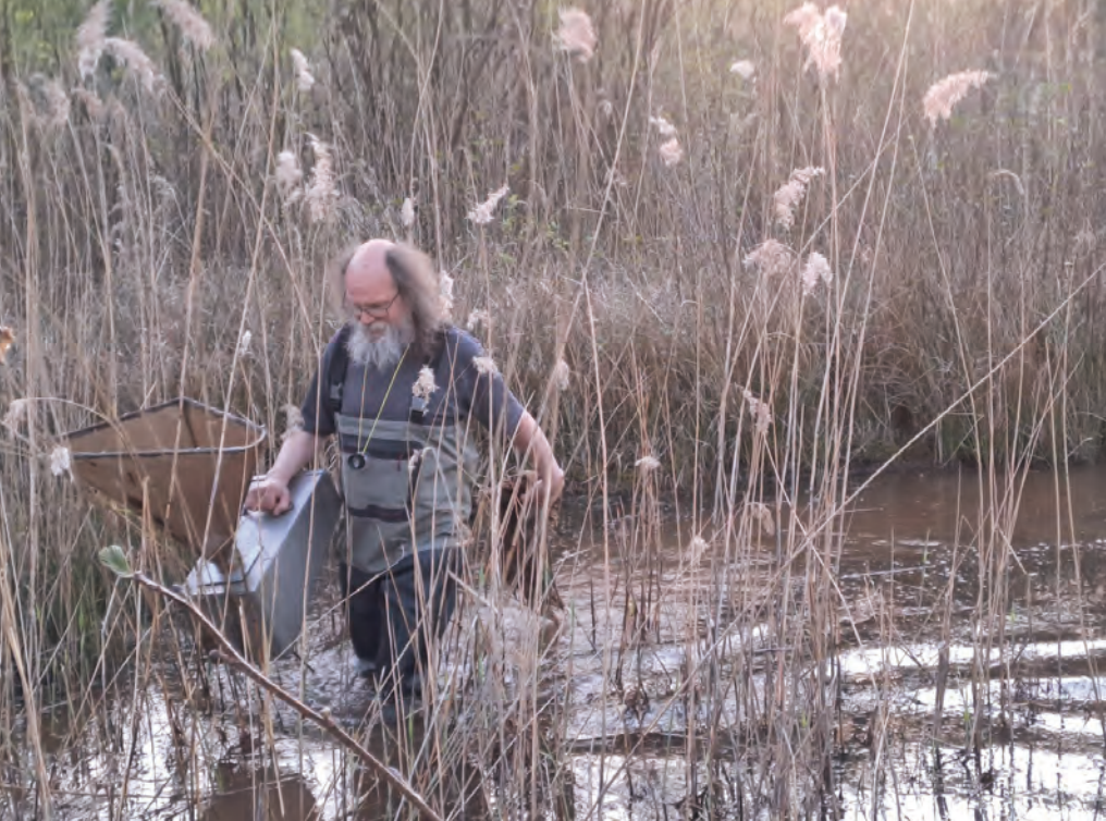
Bemonsteren trechterfuiken in het natuurgebied Kleiputten Terhagen

een waadpak en 5 trechterfuiken waren we tussen 31 maart en 9 april aan de slag in het natuurgebied Kleiputten Terhagen. Met succes, want in een ondergelopen moerasbos en in een gracht die tijdens de nazomer van 2022 werd verbreed zaten er opnieuw kamsalamanders in de fuiken. In totaal werden 10 diertjes gevangen, gefotografeerd en meteen weer vrijgelaten.