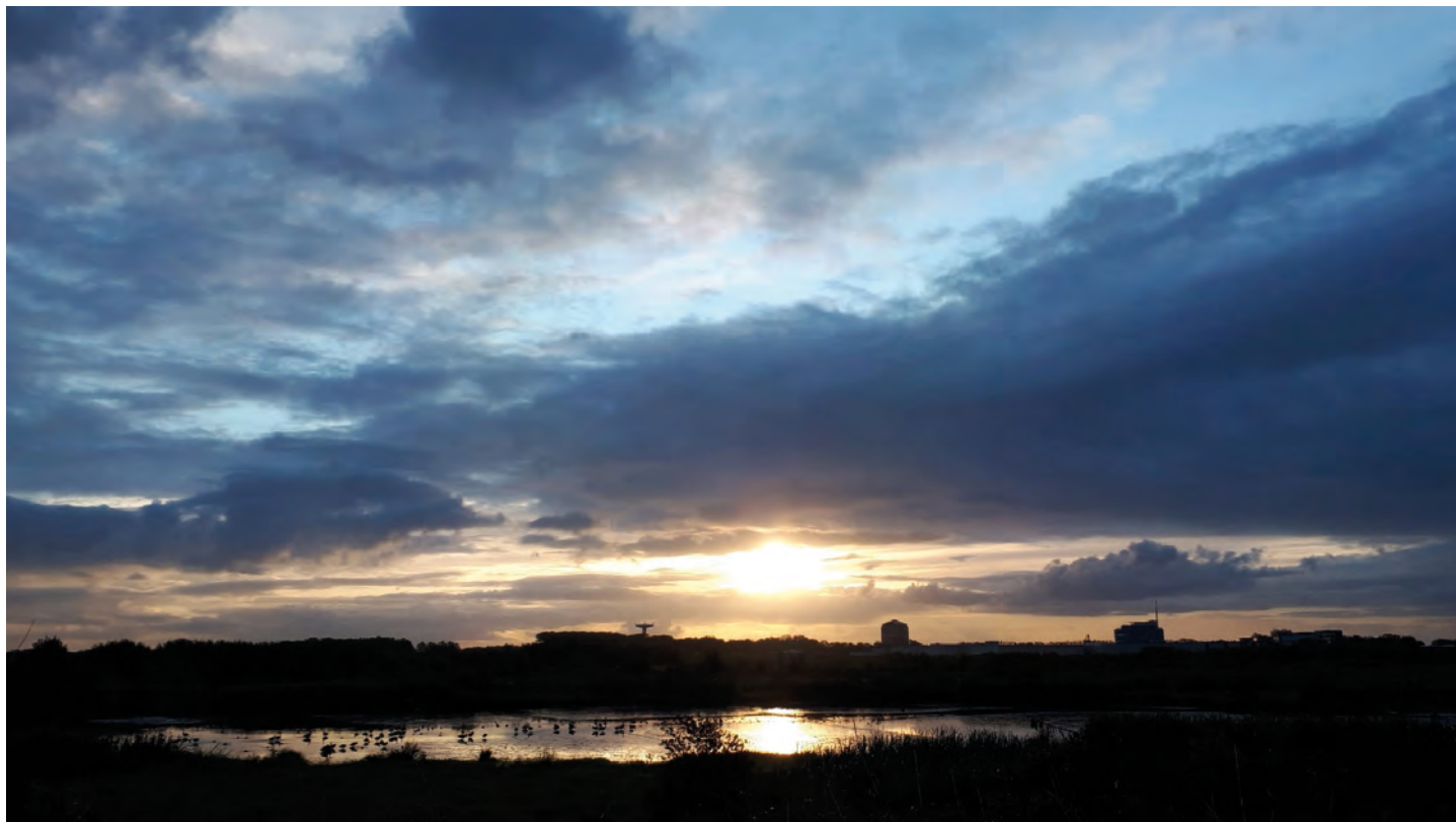
GGG Zennegat bij valavond

In 1977 en 2005 ging men gebieden aanduiden waarin de rivier indien nodig haar armen kon gaan uitstrekken. De beslissingen die in 2005 zijn genomen, zien we nu volop in uitvoering en ontwikkeling komen in de Sigmacluster 'Dijlemonding'. Dit is de omgeving van de Blauwe Bruggen. Ter hoogte van de Heindonk polder in het gebied: Tien Vierendelen is men nog volop bezig met het aanleggen van een lang dijkstelsel. Drie andere gebieden zijn intussen in werking, het zijn de gecontroleerde overstromingsgebieden met gereduceerd getij (GGG) van