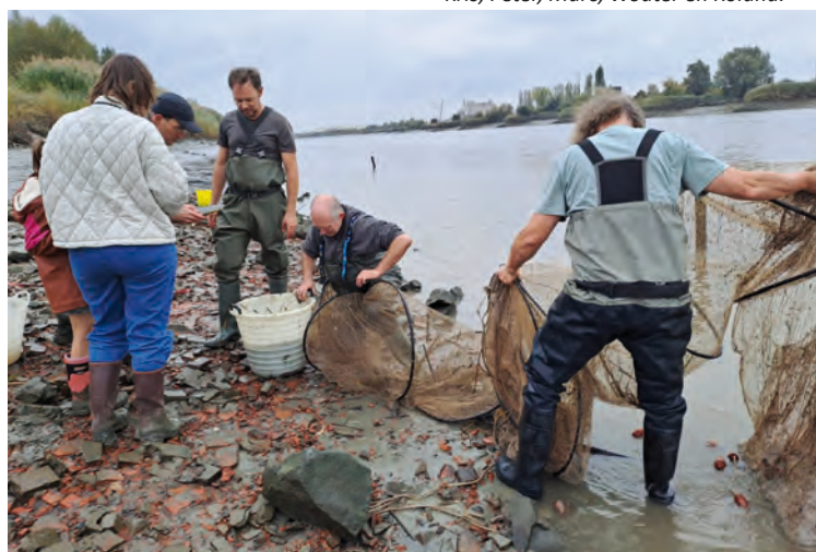
Wouter met schieraal

Tekst en foto's: Erik De Keersmaecker – coördinator vrijwilligers INBO-monitoring visbestanden in de Schelde, Rupel en Nete