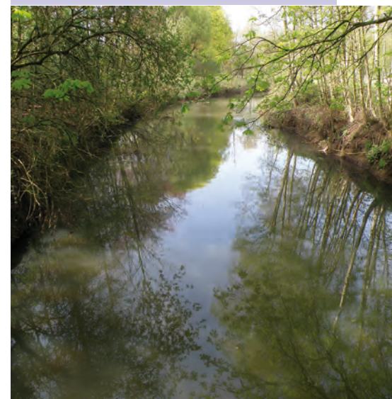
Groot Schijn in Deurne

Je leert hoe water onze landschappen in het verleden vormde én ook vandaag