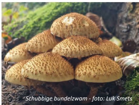
Schubbige bundelzwam