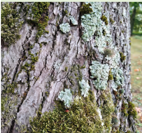
Korstmossen in De Reukens

Meebrengen: stevige waterdichte schoenen of laarzen, loepje of vergrootglas (indien in bezit).