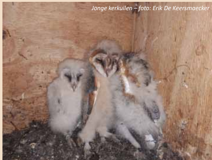
Jonge kerkuilen

Vermoedelijke broedgevallen waren er ook in Oppuurs en in Rumst. Met een gemiddelde van 2,6 jongen per nest ligt het aantal jongen aan de lage kant. Opmerkelijk was dat meerdere nestkasten, waar we de voorbije jaren een succesrijk broedgeval mochten optekenen, dit jaar leeg bleven. Meerdere van die nestkasten werden gekraakt door kauwen.