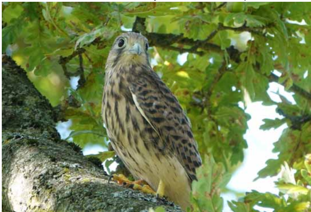
Jonge torenvalk Lazarusstraat Rumst

Een extra toer eind juni, waarbij we met een verrekijker, soms met een telescoop naar die nestkasten keken leverde geen resultaat op. Maar schijn kan soms bedriegen, want dankzij de opmerkzaamheid van Marleen Ceulemans kunnen we toch een 13de geslaagd broedgeval, met 3