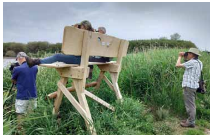
Memorabel vogelkijkmoment in de Groene Jonker