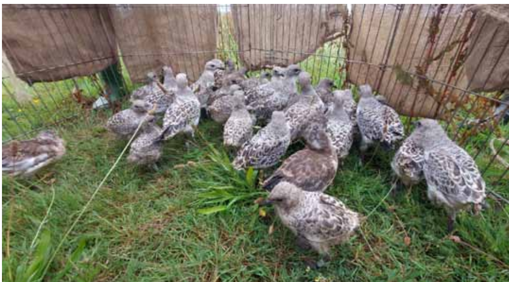
Geringde jonge zwartkopmeeuwen, in de groep ook 2 jonge kokmeeuwen

Tekst: Wouter Van Assche – Vogelwerkgroep Rupel