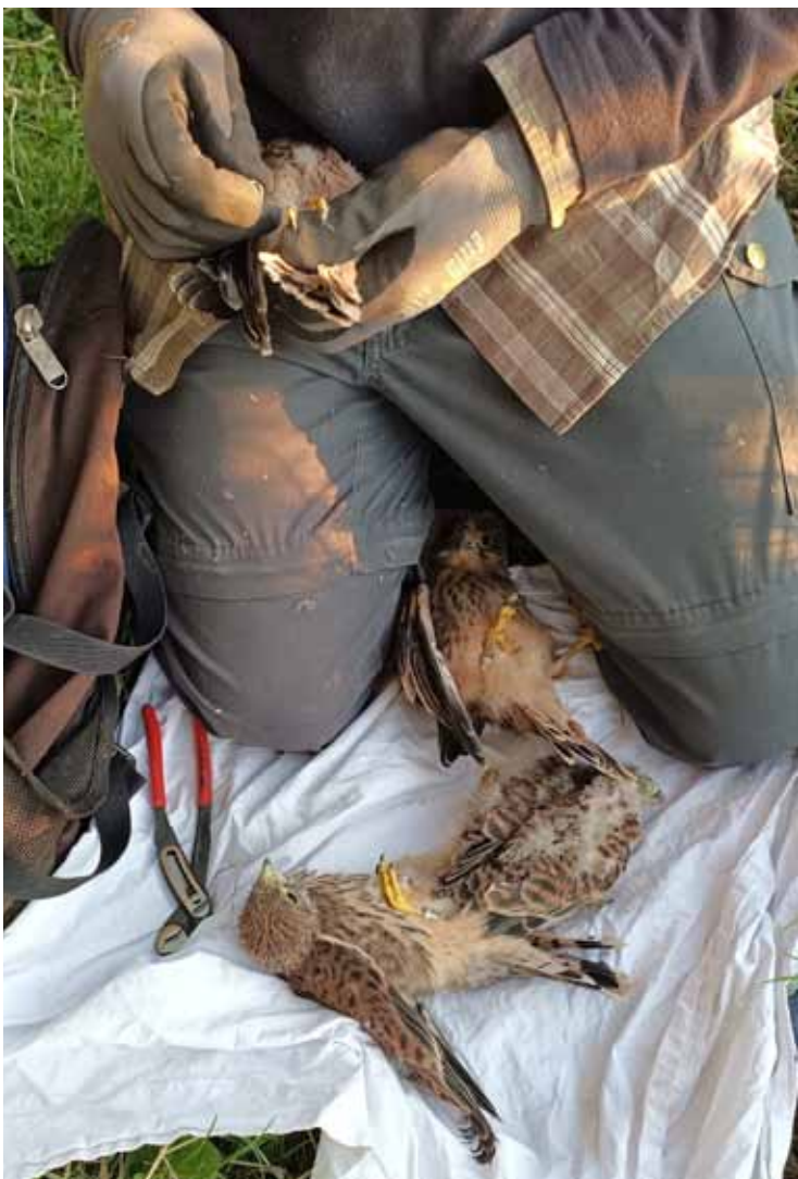
Ringen jonge torenvalken – foto: Gie Wyckmans

Tekst: Erik De Keersmaecker – coördinator projecten kerkuil, steenuil en torenvalk Klein-Brabant/Rupelstreek