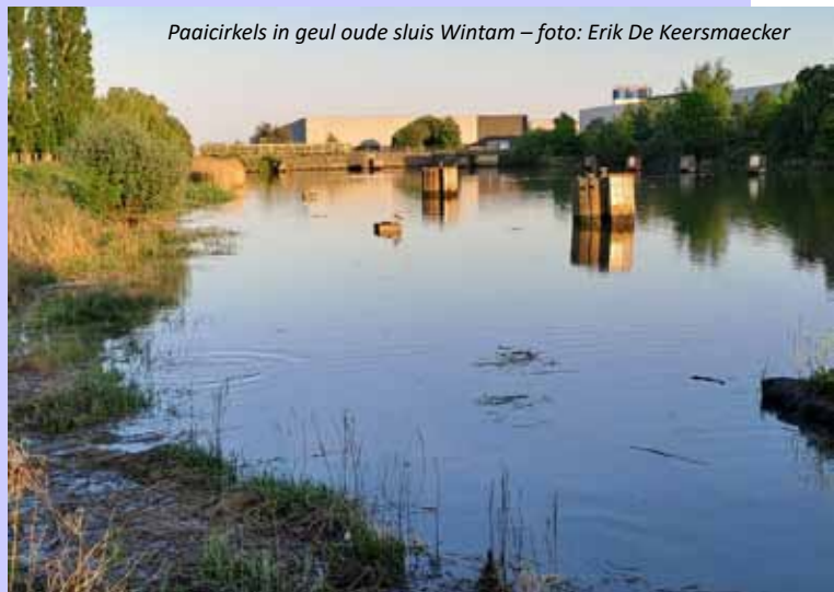
Paaicirkels in geul oude sluis Wintam

Tekst: Erik De Keersmaecker – fintenwatcher langs de oevers van de Rupel en de Dijle