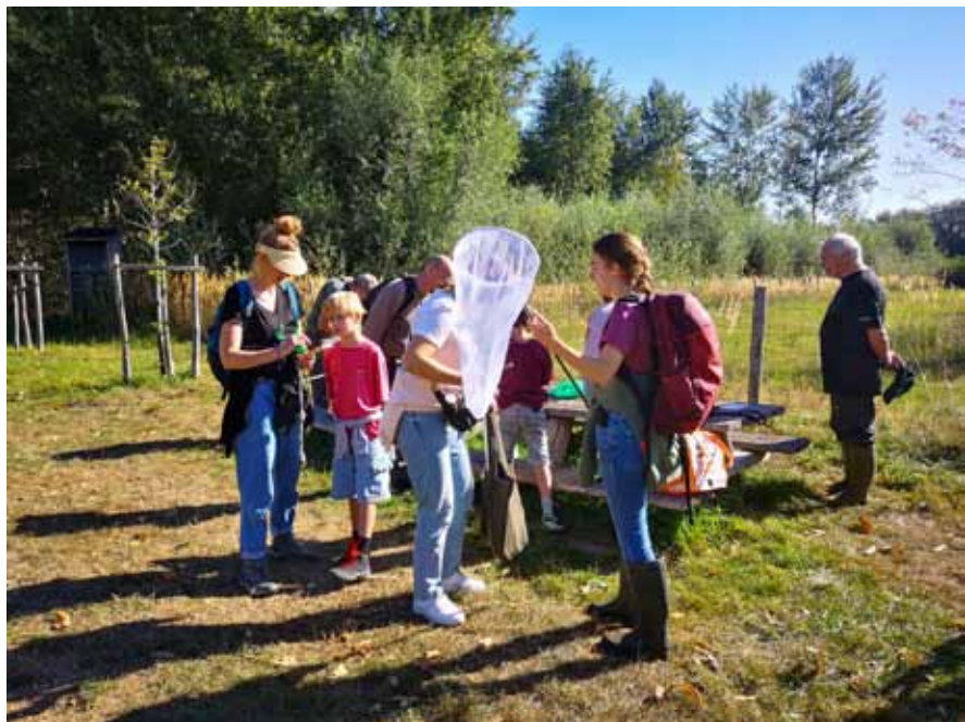
Soortensafari in de Reukens

Deze wandelingen leverden heel wat nieuwe soorten op. En dan zijn er natuurlijk ook de individuele wandelaars, die een grote bijdrage leveren aan het waarnemenbestand.