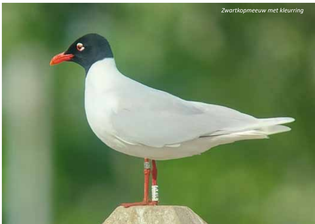
Zwartkopmeeuw met kleurring

Één van die plaatsen, afgelopen april 2025, betrof een plas gelegen langs de ring te Lier, naast de Nete. Hier vergaderden in april zwartkopmeeuwen geringd door Belgische, Nederlandse, Duitse, Franse, Poolse en Tsjechische ringkundigen. Merkwaardig om vast te stellen hoe de diversiteit aan ringen