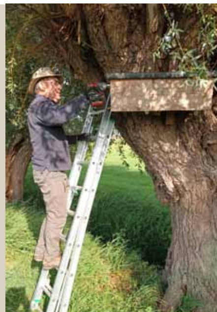
Montage nieuwe nestkast steenuil Molenstraat Reet

Een week later op dinsdag 9 september werden oude nestkasten in de Molenbeekse plas in Reet en in de Kleine Steylen in Boom vervangen door nieuwe nestkasten.