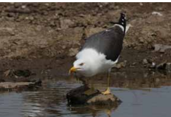
Kleine mantelmeeuw

8. Ter hoogte van de blauwe brug over de Dijle kijk je naar het overstromingsgebied Tien Vierendelen. Vrachtwagens rijden af en aan met gronden voor de bouw van een nieuwe ringdijk. Zodra die werken klaar zijn, wordt de huidige dijk van de Dijle deels verlaagd en die krijgt dan een nieuwe functie als overlooppad.