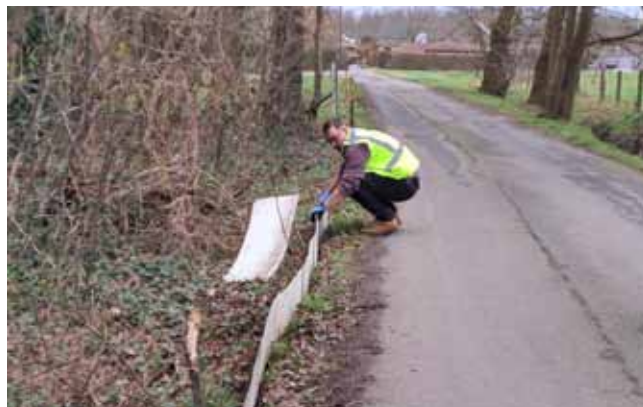
Plaatsen paddenschermen door medewerker Cummins Rumst

Tekst: Erik De Keersmaecker Natuurpunt Rupelstreek