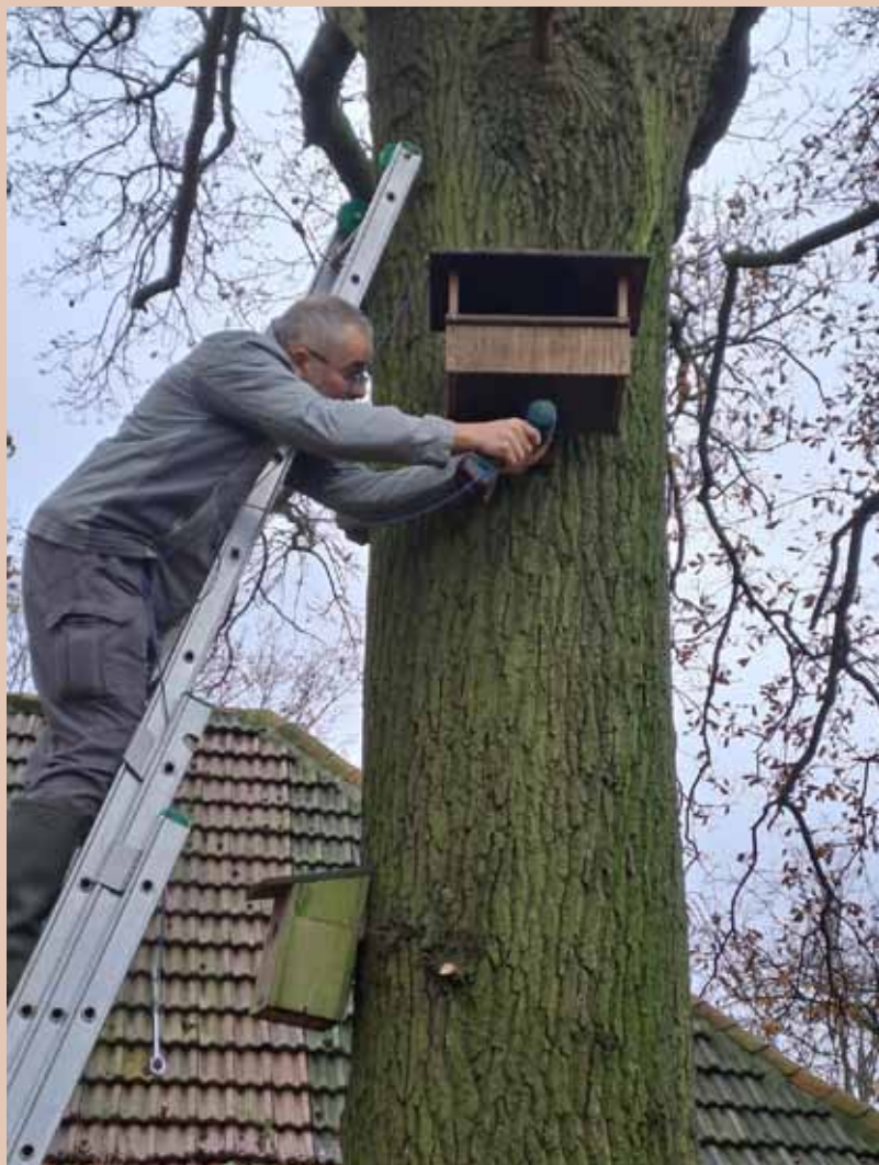
Montage nieuwe nestkast torenvalk door Luc Van den Bergh

Af en toe moeten we ook een nestkast verwijderen, omdat de omstandigheden in de buurt veranderd zijn. Dat deden we met de nestkast langs de Bovenvliet in Hemiksem. In 2023 werd daarin nog met succes gebroed, maar door de realisatie van een nieuwe wandel- en fietsverbinding langs de Bovenvliet werd de nestkast verlaten. Hetzelfde met de nestkast langs de Varenbroekstraat in Reet, daar werden 2 windturbines geplaatst. De kans dat torenvalken in aanvaring komen met de draaiende wieken is bijzonder groot. In de Rupelstreek zijn we nog op zoek naar alternatieve plaatsen, waar we een nestkast kunnen plaatsen.