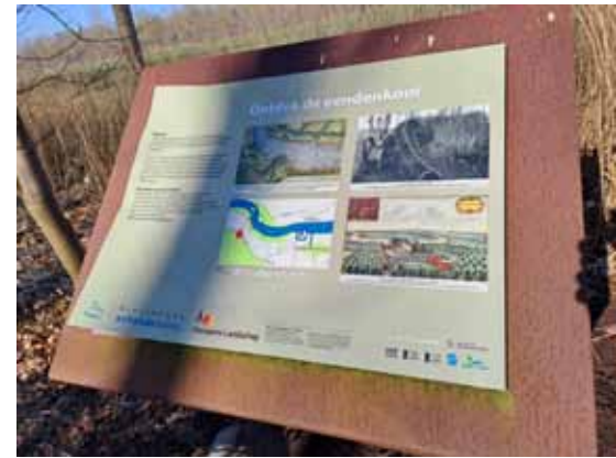
Infobord eendenkooi – foto: Erik De Keersmaecker

Een infobord nodigt je uit voor een bezoek aan één van de oudste en mogelijk best bewaarde eendenkooien van Europa. Reeds in de 14de eeuw werd deze eendenkooi gebruikt om eenden te vangen voor consumptie. In 1973 werd deze vorm van jagen verboden en werd de eendenkooi nog enkele decennia gebruikt om onderzoek te doen. Vanaf dan werden de gevangen eenden geringd met een wetenschappelijke ring en daarna werden ze weer vrijgelaten. Eendenkooien werden steeds aan grote waterpartijen gebouwd,