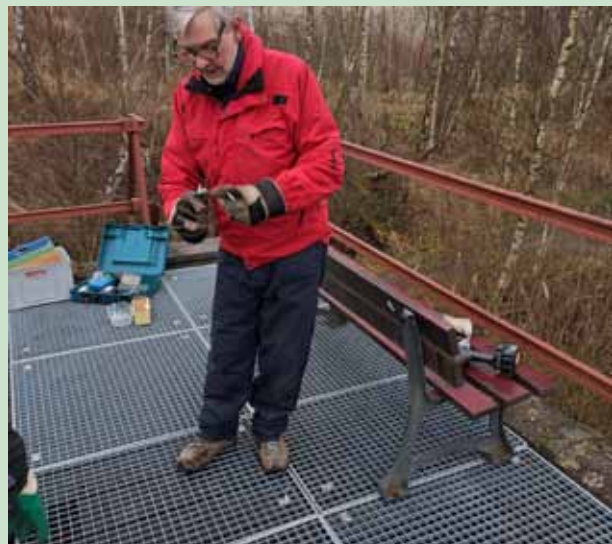
Montage vloerroosters op dakterras kijkpunt IJsvogel

Het weer werkte niet echt mee: koud en grijs, maar gelukkig bleef het droog. Dankzij de enthousiaste inzet van iedereen hebben we opnieuw een stapje vooruit gezet in het onderhoud en de verbetering van ons natuurgebied. Bedankt aan alle vrijwilligers!