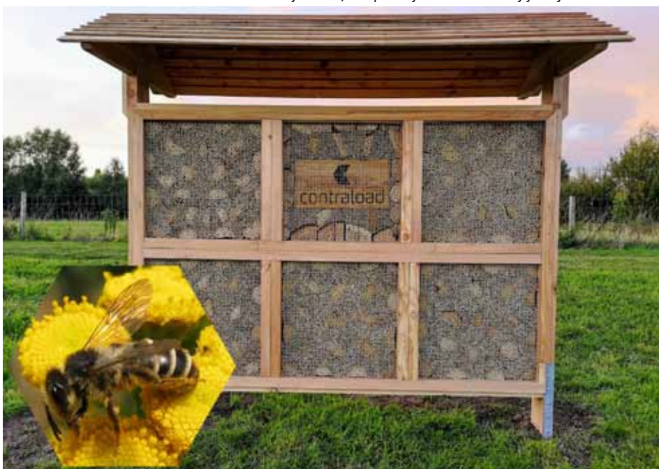
Het bijenhotel, een paradijs voor solitaire bijtjes

Deze workshop is een samenwerking tussen Natuurpunt Aartselaar en Gezinsbond Aartselaar