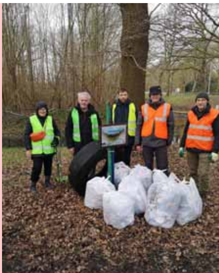
6 deelnemers, 6 goed gevulde vuilzakken, 1 vrachtwagenband – foto: Ria Thys

Werkhandschoenen en stevig schoeisel zijn aan te raden. Wij zorgen voor zakken en grijpers. Deelname melden bij Ronny Verelst – ronnyverelst@telenet.be – 0475 58 55 70