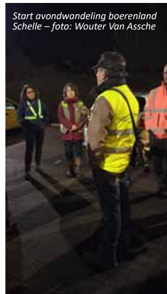
Start avondwandeling boerenland Schelle

Op zaterdag 31 mei rijden we naar de Oostkantons, waar we hopen op waarnemingen van rode wouw, grauwe klauwier en misschien wel waterspreeuw. De bustocht op zaterdag 14 juni brengt ons dan naar de omgeving van Utrecht, waar we purperreigers en zwarte sterns hopen te spotten.