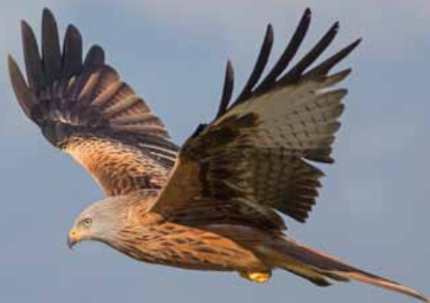
Rode wouw