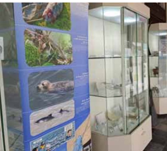
Tentoonstelling kerk Wintam

Tijdens de zomer van 2024 werd mijn aandacht getrokken door een groep jagende oeverzwaluwen. Oeverzwaluwen