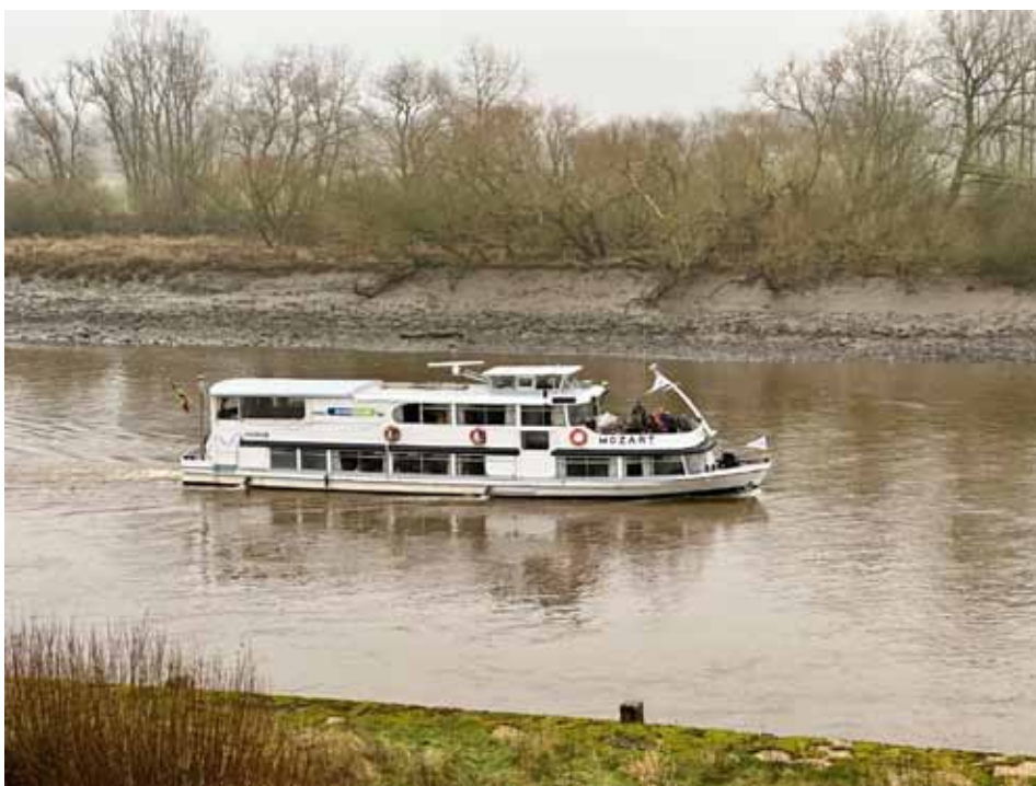
De Mozart op de Rupel ter hoogte van Terhagen

Al snel werd duidelijk dat we een mooie dag voor de boeg hadden. Een van de eerste waarnemingen was een krakeend, gevolgd door de sierlijke bergeend. De wintertaling kwam niet veel later in beeld, met zijn