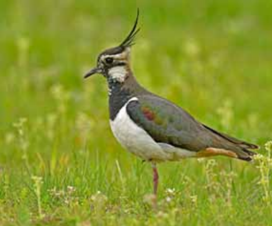
De kievit, een vaak voorkomende weidevogel in het Turnhouts vennengebied