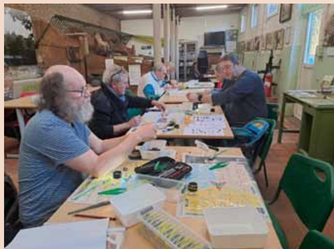
Pluismoment in Natuur.huis de Paardenstal

Voor het onderzoek worden braakballen van kerkuilen gebruikt, die braakballen zijn makkelijk te vinden in onze kerkuilnestkasten. Kerkuilen zijn ook niet kieskeurig bij het vangen van een prooi, omzeggens alle kleine zoogdiertjes in de wijde omgeving van een kerkuilbroedplaats kunnen gegrepen worden. Braakballen zijn de onverteerbare resten, zoals schedeltjes, botjes, beentjes en haren, soms ook veren die na het verteren van de prooi in een soort bal worden uitgebraakt. Opmerkelijk was de vondst van lange, rosse haren in één van de braakballen. De haren zaten in een dikke bundel bij elkaar en wijzen in de richting van een vleermuis.