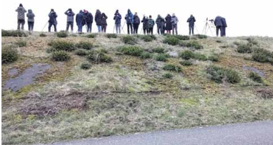
Vogels kijken in de Prunje

De tocht werd afgesloten met een stop aan de Wevers- en Flauwersinlaag en de Prunje, waar het opkomend getij in de Oosterschelde duizenden wulpen dwong om een droog plekje te vinden.