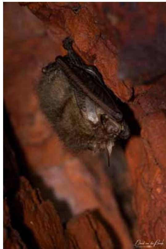
Grootoorvleermuis in ringoven Peeters – van Mechelen

Bijzonder leuk was ook dat we na ons bezoek aan beide ringovens door de beheerders en vrijwilligers van 't Geleeg/Frateur en EMABB/BRIK Boom getrakteerd werden op een warm drankje en een gezellig npraatje.