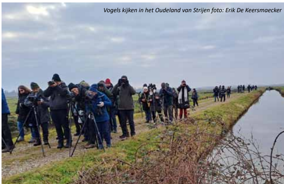
Vogels kijken in het Oudeland van Strijen

Uiteindelijk lukte het toch om enkele groepjes te spotten, eerst een groepje met 2 vogels en daarna een groepje van 6 vogels. Daarna werden de kijkers een poosje op een groepje van 8 vogels gericht, maar dat bleken uiteindelijk kolganzen te zijn.