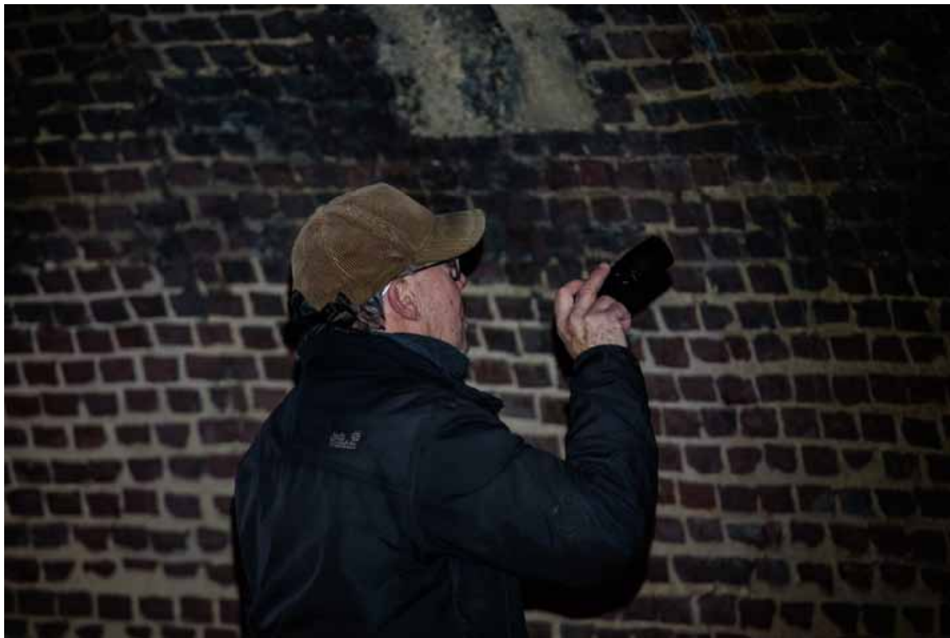
Speuren naar vleermuizen in ringoven BRIK Boom – foto: Mon Van der Mueren

Sinds de winter van 2014 werken we met enkele vrijwilligers van Natuurpunt Rupelstreek aan het tellen van overwinterende vleermuizen in oude ringovens in de Boomse wijk Noeveren.