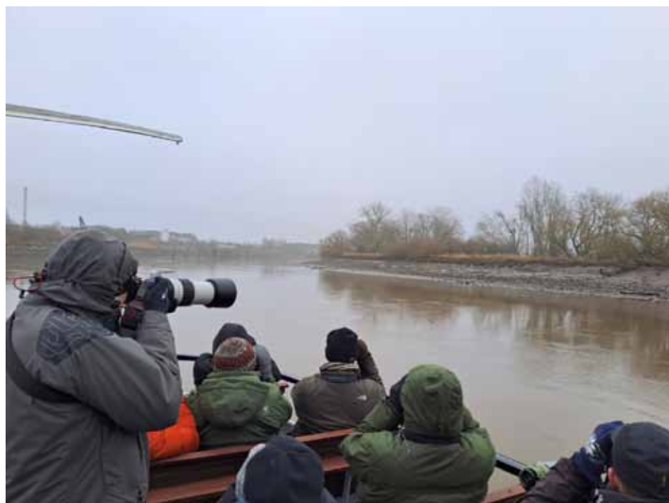
Vogels kijken vanaf het voordek van de Mozart