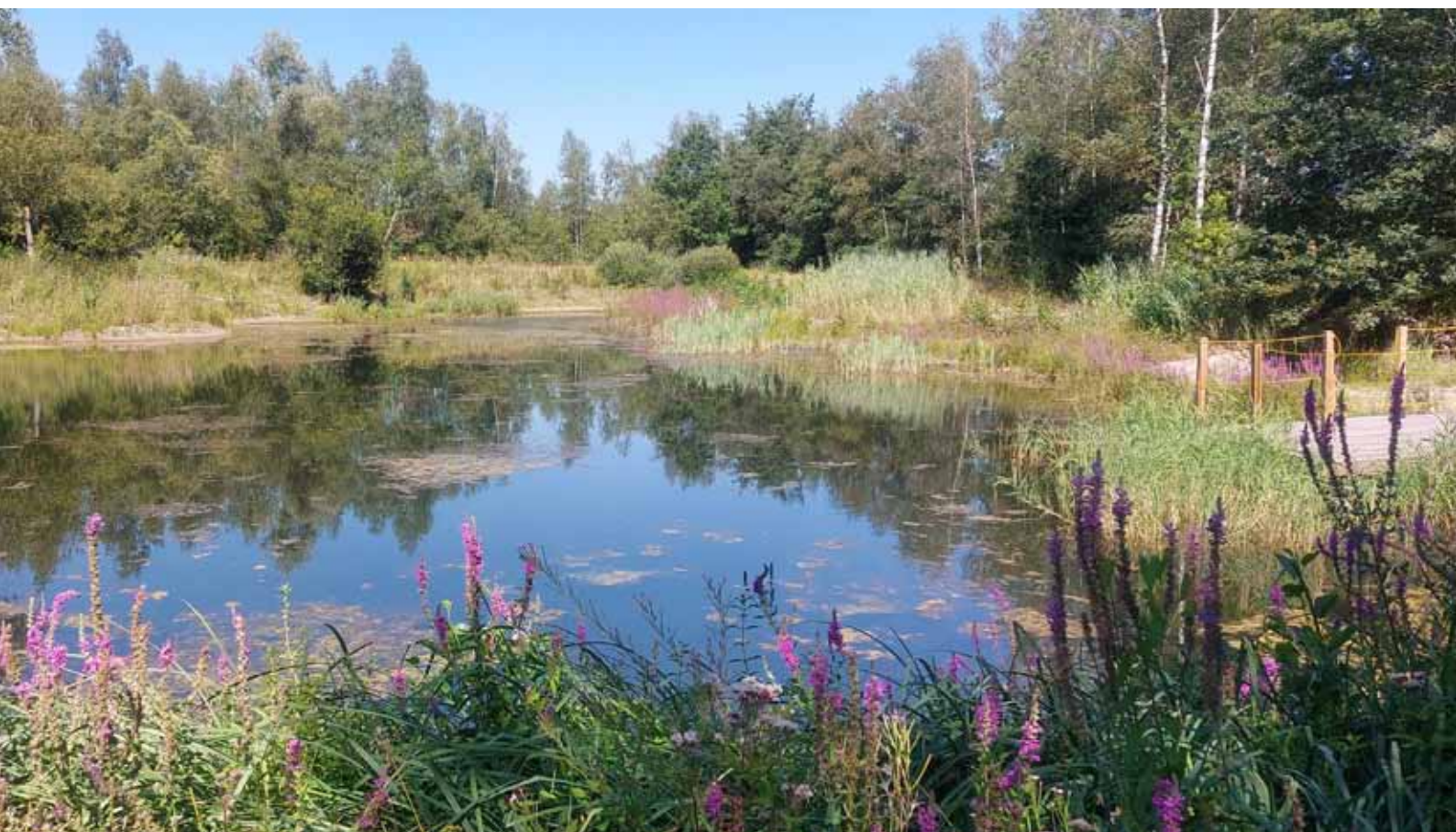
Nieuwe kamsalamanderpoel in de Kleiputten Terhagen