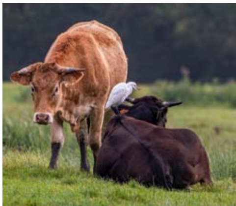
Koereiger in Nielse polder