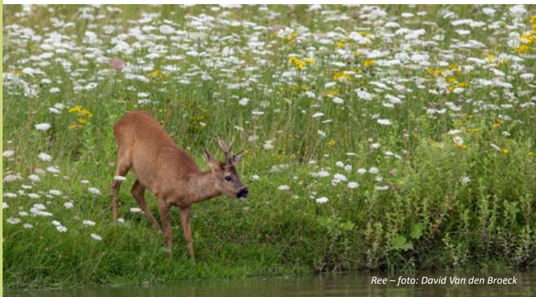
Ree