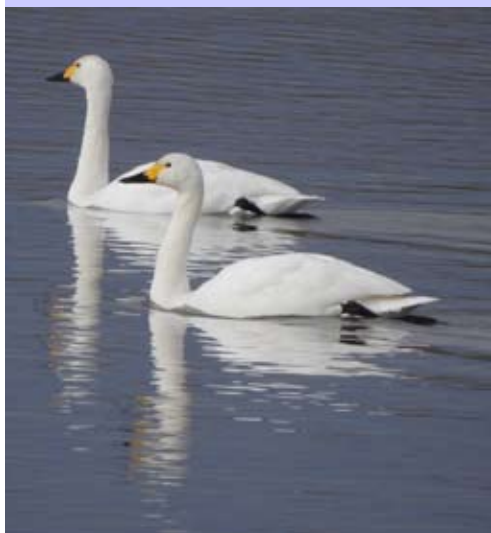
Kleine zwanen op het Noordelijk eiland

Wilde zwanen broeden in Rusland en Scandinavië, waarbij ze moerassen opzoeken om hun nesten te bouwen.