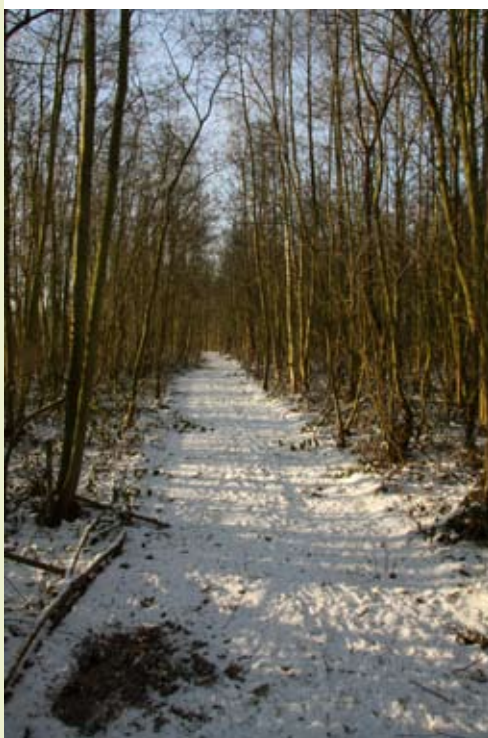
Winter in het Cleydaelbos

Afspraak aan de picknickbank op het Reukenspad. Zoals steeds zullen er en-