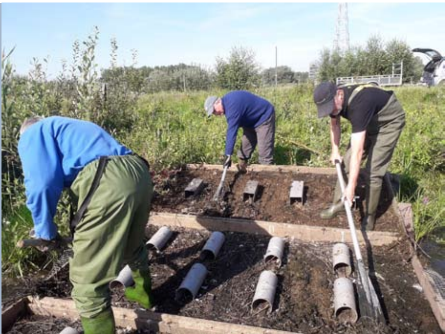
Verwijderen laag vogelpoep van nestvlot

Nadat de vloten aan de oever gebracht waren, werd gestart met het verwijderen van een dikke laag vogelpoep. Een opvallende vaststelling tijdens het heen- en terugvaren was dat de schroef van de elektro-motor van ons bootje meteen vastliep in een dikke laag kranswieren, en dus moest er met mankracht geroeid worden. Dankzij deze vaststelling wisten we dat de kans groot was dat er ergens eind oktober of in november opnieuw kleine zwanen, of wintergasten uit Siberië op het Noordelijk eiland zouden vertoeven. Kleine zwanen foerageren immers op de knolletjes van kranswieren.