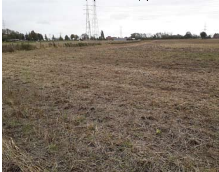
Maisakker wordt project Voedsel+Dorp