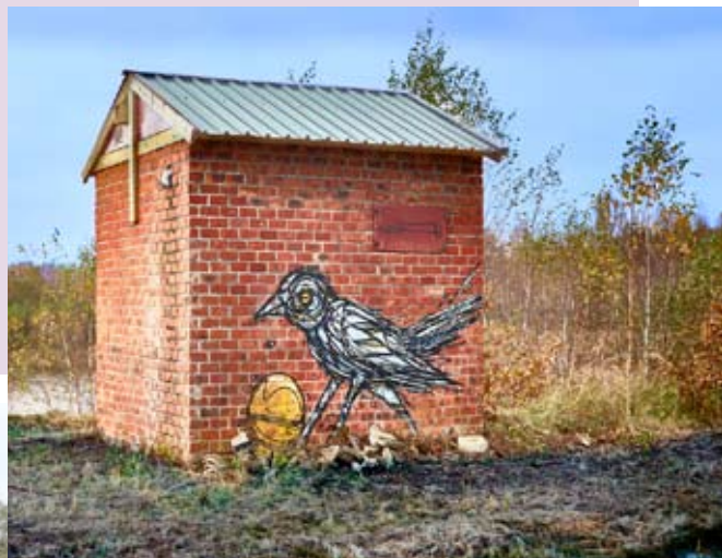
Gebouwtje kraai met nieuw zadeldak

Het behoud van de restanten van het steenbakkerijverleden in het natuurgebied Kleiputten Terhagen is één van de doelstellingen van Natuurland Rupelstreek. Met daarbij enkele kleinere gebouwtjes, die elk een bepaalde functie hadden. Bij de renovatie van die gebouwtjes wordt eveneens getracht om ze een bepaalde natuurfunctie te geven. Zo werd op één van de gebouwtjes een dakconstructie gebouwd, met in de beide wanden nestkasten voor kerkuil en torenvalk. Beide vogelsoorten zijn jagers van het open landschap, waar ze voornamelijk op muizen jagen. Binnenin het gebouwtje creëren we mogelijkheden voor broedplaatsen voor boerenzwaluwen en rustplaatsen voor veldmuizen, dit door een invliegopening te maken bovenaan de deur en binnenin houten balken te monteren waartegen zwaluwen hun nesten kunnen bouwen en verstoptplaatsen voor veldmuizen. De zwaluwen willen we lokken door er tijdens de komende lente regelmatig het geluid van trekkende boerenzwaluwen te laten horen, daarbij hopen op doortrekkende of foeragerende zwaluwen het horen en een kijkje komen nemen.