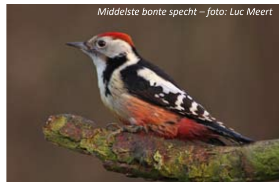
Middelste bonte specht