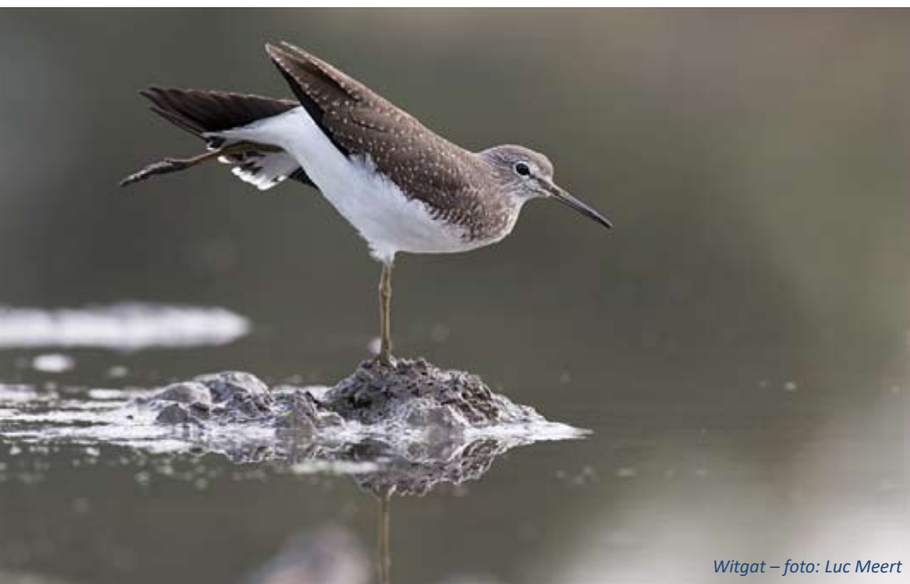
Witgat