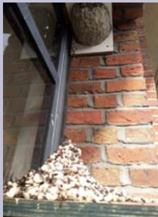
Poepplankje onder kunstnest huiszwaluwen

Met 29 bewoonde nesten halen de huiszwaluwen aan de gebouwen van de PTS-school in Boom het beste resultaat sinds de start van de tellingen in 1994. Het succes heeft alles te maken met 32 kunstnesten die een 10-tal jaar terug werden geplaatst door vrijwilligers van Natuurland. De nestkasten werden deels onder de betonnen dakgoot en deels in de hoeken van de ramen geplaatst, met onder elke nestkast ook een plankje, waar de zwaluwpoep opvalt.