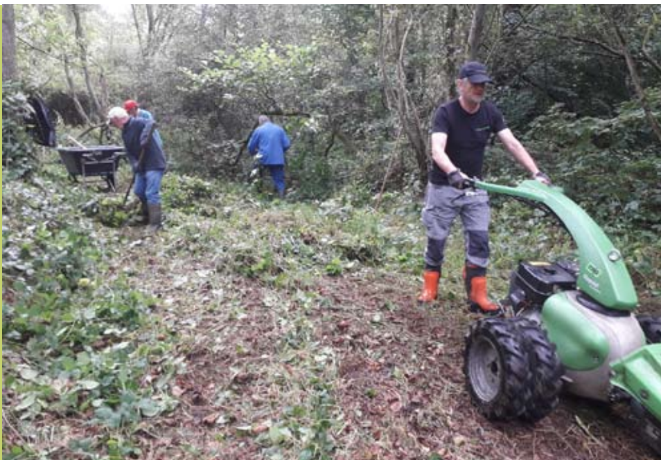
Maaien percelen Walenhoek door vrijwilligers Natuurpunt Rupelstreek

Het maaien, het afvoeren van het maaisel en het verwijderen van het overhangend struweel en omgevallen bomen aan de rand van de percelen werd gespreid over 3 voormiddagen waarbij we telkens konden rekenen op de hulp van een 5-tal vrijwilligers.