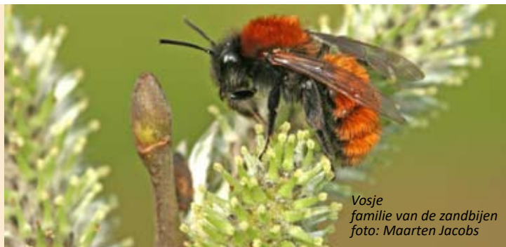
Vosje familie van de zandbijen

Kortom, je wordt ondergedompeld in de intrigerende wereld van deze aalbare diertjes. Vergeten we daarbij niet dat wilde bijen door hun lichaamsbouw en levenswijze veel efficiëntere bestuivers zijn dan hun rechtstreekse voedselconcurrenten, de honingbijen. Ook hommels, die tot de familie van de wilde bijen worden gerekend, komen aan bod. Van alle bijen zijn zij de absolute topbestuivers. Dat zal in een video sprekend worden aangetoond. Geen