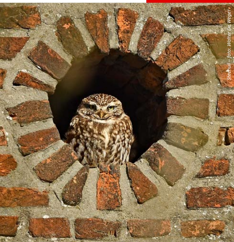
Steenuil