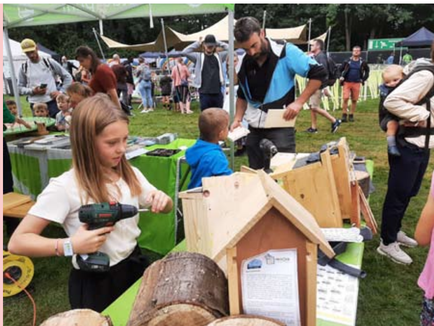
Nestkastjes en bijenhottellets in elkaar knutselen tijdens het Ubuntu-festival