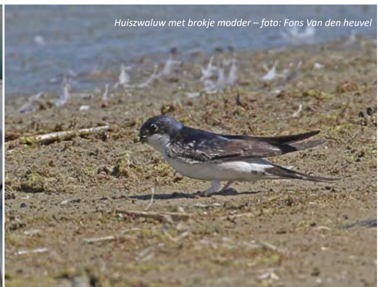
Huiszwaluw met brokje modder