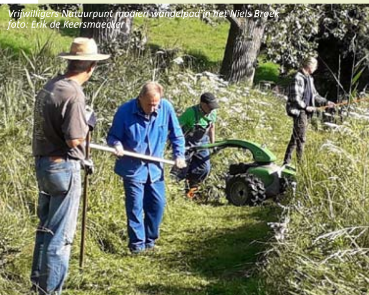
Vrijwilligers Natuurpunt maaien wandelpad in het Niels Broek

Het onderhoud van de wandelpaden in de natuurgebieden die eigendom of in beheer zijn van Natuurpunt is elke lente en zomer een steeds terugkerende taak voor de vrijwilligers van Natuurpunt Rupelstreek. Doorgaans wordt getracht om elk wandelpad minimaal 2 keer te maaien.