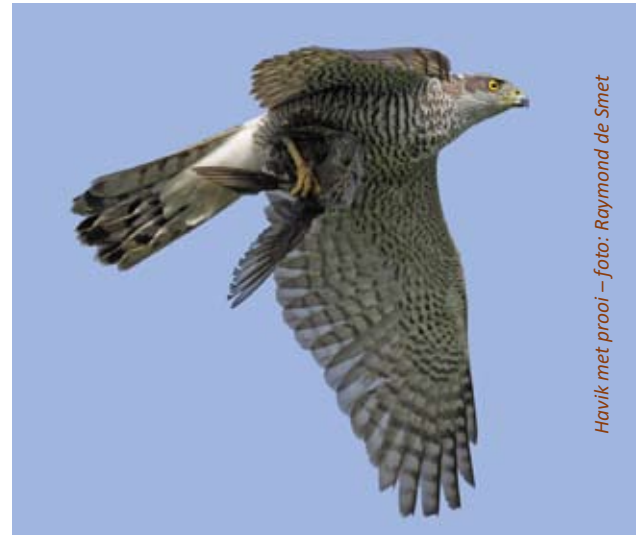
Havik met prooi

Tekst en bron: Nature Today – www.waarnemingen.be