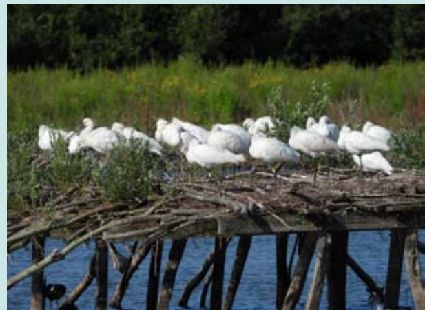
Lepelaars op het takkeneiland Noordelijk eiland

Uit ervaringen in Nederlandse kolonies blijkt dat lepelaars graag tussen kokmeeuwen broeden. Kokmeeuwen beschermen de kolonie tegen vliegende predatoren, zoals blauwe reigers en kleine mantelmeeuwen.