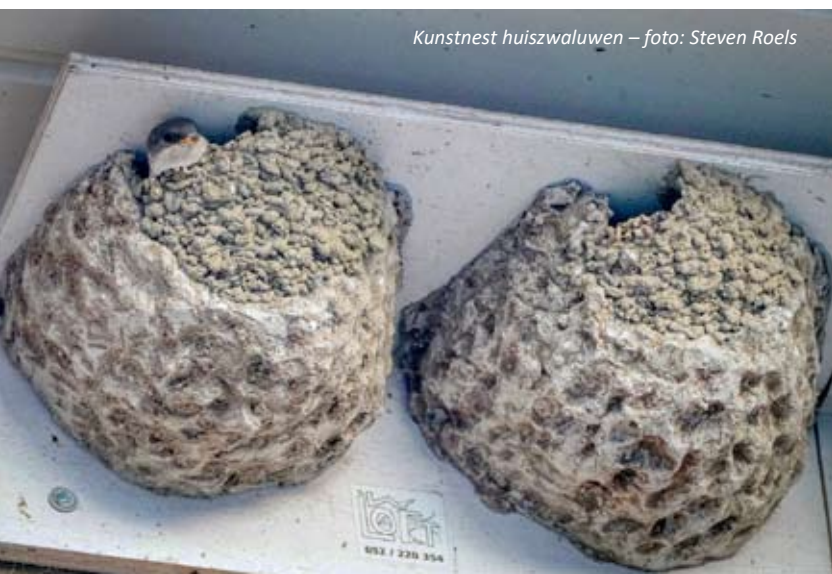
Kunstnest huiszwaluwen