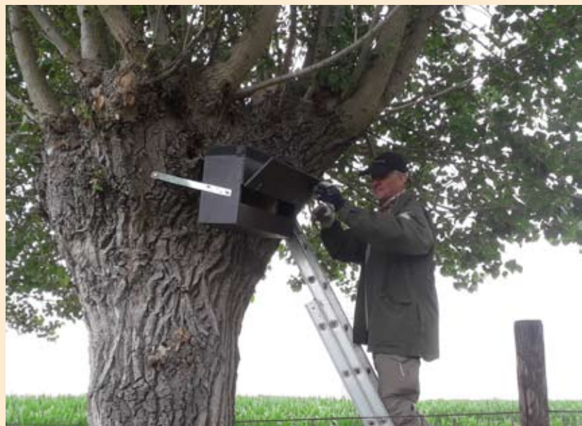
Plaatsen nestkast steenuil