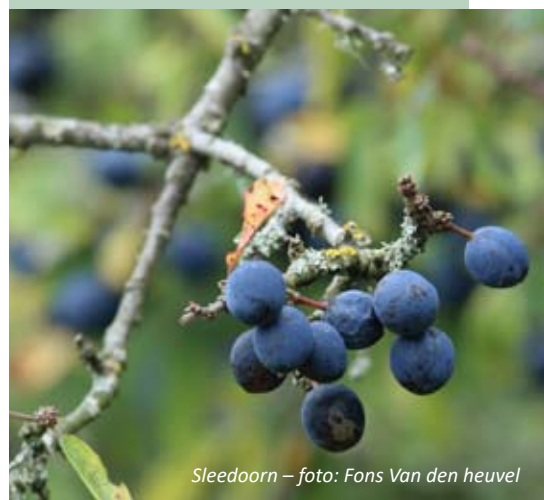
Sleedoorn – foto: Fons Van den heuvel