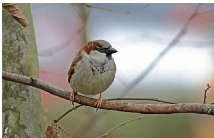
Man huismus