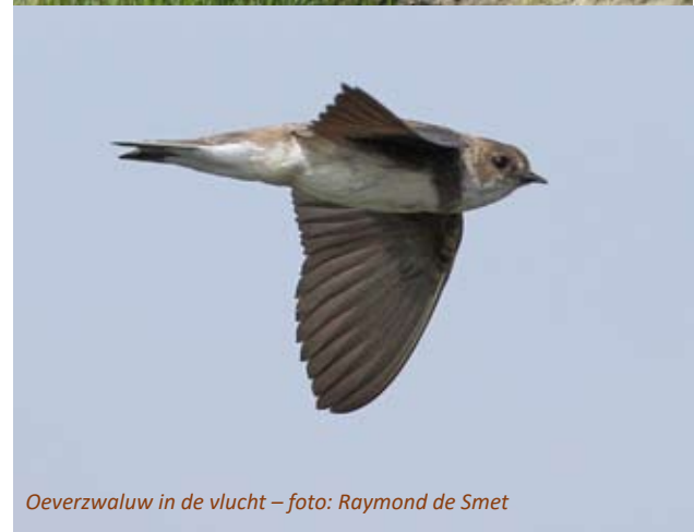
Oeverzwaluw in de vlucht