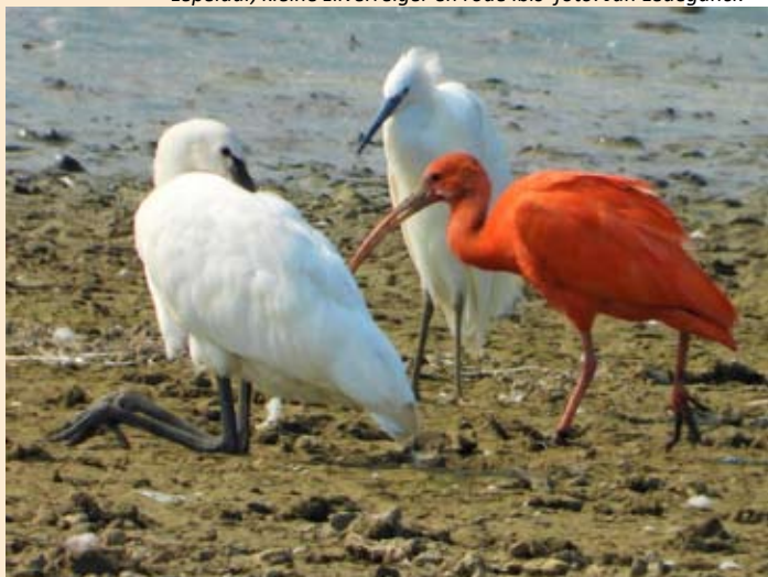
Lepelaar, kleine zilverreiger en rode ibis

Sinds begin augustus is de najaarstrek van kleine zilverreiger volop bezig. Ze zijn op doortocht naar Zuid-Europa en Afrika en maken soms een lange tussenstop in de Lage Landen. Men kan kleine zilverreigers van grote zilverreigers onderscheiden door het kleinere formaat en opvallend gele tenen.