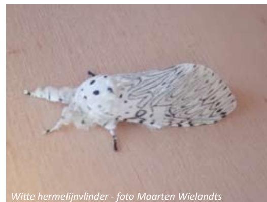
Witte hermelijnvlinder

Er is één gouden regel die van toepassing is als je je tuin nachtvlinder-vriendelijk wil maken en dat is om zo veel mogelijk inheemse planten en struiken aan te planten. Dus bestel snel nog wat inheems plantgoed via Behaag natuurlijk 2020 en maak plaats voor inheemse planten en struiken in je tuin.