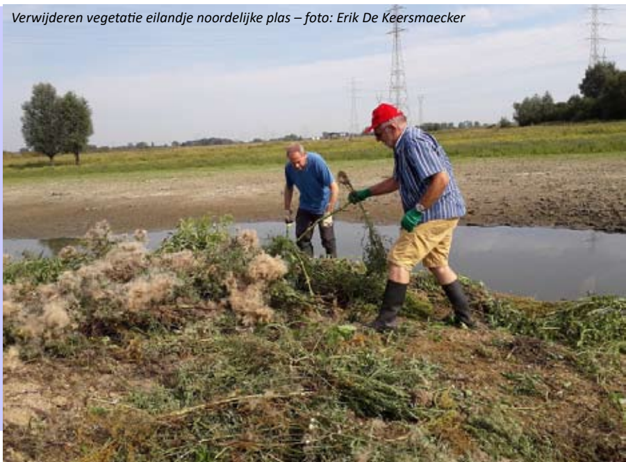
Verwijderen vegetatie eilandje noordelijke plas

Het eilandje dat eind vorig jaar op voorstel van Natuurpunt door het Agentschap voor Natuur en Bos in de noordelijke plas van het Noordelijk eiland werd aangelegd heeft meteen bewezen dat het een prima broedplaats kan zijn voor grondbroeders, zoals visdief, kluut en kokmeeuw. Mits enige optimalisatie kan het ongetwijfeld nog andere grondbroeders aantrekken. Belangrijke voorwaarde om het eilandje optimaal te houden voor die grondbroeders is het regelmatig verwijderen van de vegetatie, zodat de bodem kaal blijft en opgroeiende planten vóór en na het broedseizoen verwijderd worden. Een taak die op maandag 5 augustus voor het eerst werd uitgevoerd door vrijwilligers van Natuurpunt Rupelstreek.