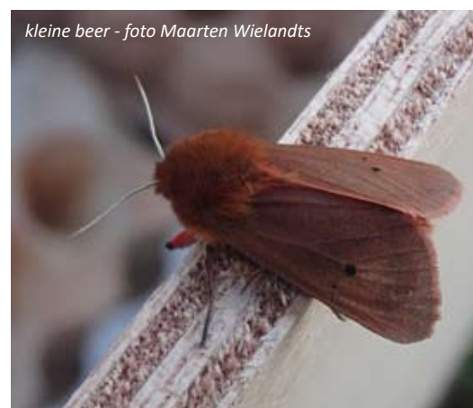
kleine beer