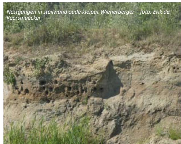
Nestgangen in steilwand oude kleiput Wienerberger

Mits optimale omstandigheden starten oeverzwaluwen met een 2de broedperiode en dat is wat nu gebeurde in deze kolonie. De omstandigheden zijn daar dan ook bijzonder goed, met buitengewoon geschikte jachtgebieden voor de op vliegende insecten jagende oeverzwaluwen. De oude baggerputten in het natuurgebied Kleiputten Terhagen, samen met het aangrenzend natuurgebied van de vroegere steenbakkerijen Swenden en de oude baggerput op het terrein van de provincie Antwerpen bieden een overaanbod aan prooien.