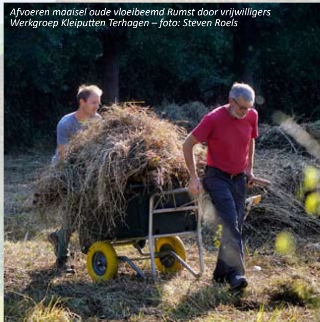
Afvoeren maaisel oude vloeibeemd Rumst door vrijwilligers Werkgroep Kleiputten Terhagen

20u Cultureel Centrum 't Aambeeld, della Faillelaan 34