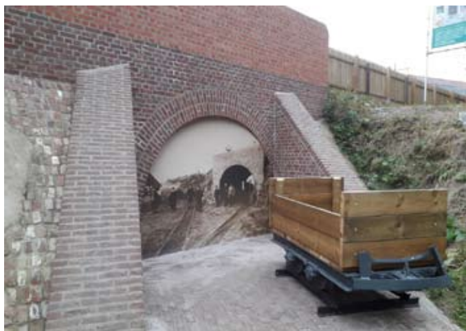
Tunnel 40 bij Natuur.huis de Paardenstal

6. In het kader van het project Buitengewone plekjes kreeg dit kleine bosje eertijds een opknappbeurt, met een kronkelwandelpad er doorheen waarvan de ingangen gemarkeerd werden met gevlochten wilgenpoorten, binnin werd een takkenscherm gebouwd, om een