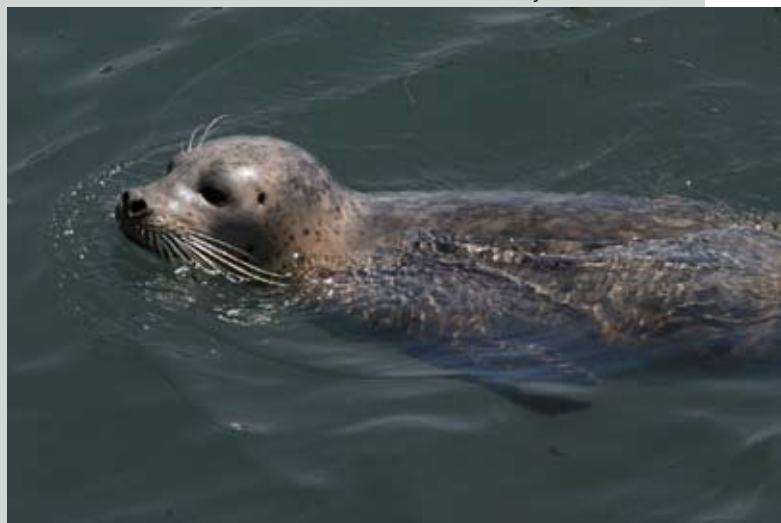
Gewone zeehond

Om 8u45 werd een opname gemaakt van een rustend dier op een slikplaat langs de Schelde ter hoogte van Weert en een klein uur later zag veervrouw Sandra een zeehond smullen van een pas gevangen vis in de Rupel ter hoogte van het veer Schelle/Wintam. RTV, de regionale televisie voor de regio Mechelen/Klein-Brabant vond de waarnemingen zo interessant dat er een nieuwsitem aan gewijd werd.