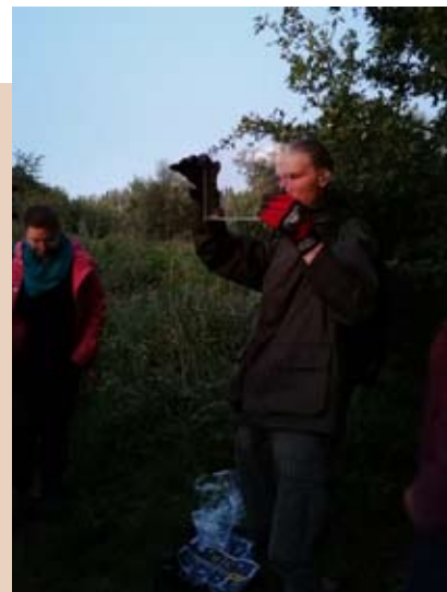
Kijken naar een rosse woelmuis

De wandeling was bijna gedaan tot er opeens een typisch geluid weerklonk voor de tijd van het jaar: de bedelende roep van jonge bosuilen! En terwijl zij de nacht introkken, gingen wij stilletjes terug huiswaarts.