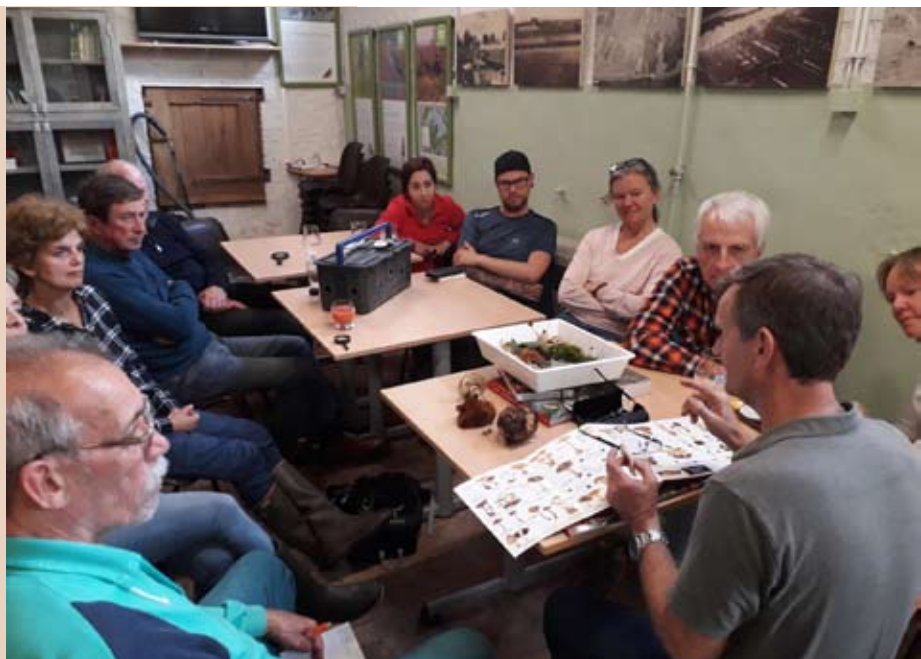
Cursus paddenstoelen in Natuur.huis de Paardenstal

Donderdag 26 september konden 11 natuurliefhebbers kennis maken en met de wonderde wereld van paddenstoelen en zwammen. André De Kesel stond opnieuw garant voor bijzonder veel boeiende info over deze schijnbaar kleine wereld. Twee dagen later, zaterdag 28 september stond de eerste excursie op het programma. De gevreesde regenbuien bleven achterwege, zodat er na een excursie van ruim 2 uur nog een stevig toemaatje in het Natuur.huis aan gekoppeld kon worden. Op 12 oktober werd de cursus afgesloten met een excursie in de Kleiputten Terhagen. Naar André luisteren tijdens een infoavond of op stap gaan op zoek naar paddenstoelen staat telkens garant voor een totaalervaring, die veel verder gaat dan enkel maar naar paddenstoelen zoeken, kijken en luisteren. In de periode september/oktober organiseren we een nieuwe cursus paddenstoelen.