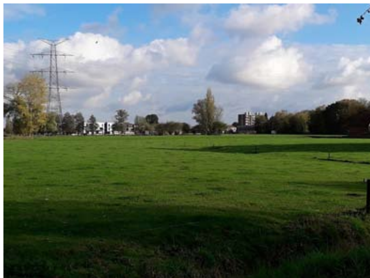
Weilanden tussen de Broeklei en de Korte Ameldijk