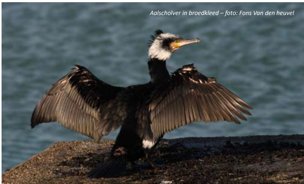
Aalscholver in broedkleed

Kijkhutten Visarend en Aalscholver nodigen je uit om er op z'n minst een half uurtje te vertoeven zonder je te vervelen. Andere opmerkelijke bewoners van het Broek de Naeyer en de Biezenweiden zijn enkele beverfamilies. De kans dat je de dieren te zien krijgt is niet groot, knaagsporen zie je waarschijnlijk wel. Dus laat je verrassen tijdens je wandeling door het Broek de Naeyer en de Biezenweiden.