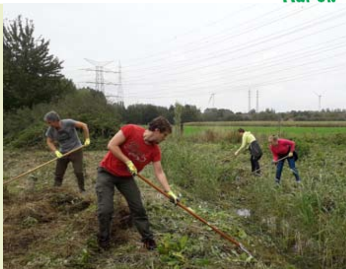
Team Cummins aan het werk in oude vloeibeemd Niels Broek

Het resultaat zullen we pas over enkele jaren kennen, wanneer we dit maaibeheer kunnen volhouden. Het is immers bijzonder zwaar werk en we zijn dan ook bijzonder blij dat we daarvoor telkens kunnen rekenen op de hulp van een groep Cummins medewerkers en Natuurpuntvrijwilligers.