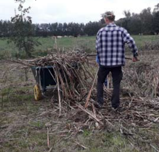
Verwijderen grote lisdodde in poel Niels Broek

Deze wandelkaart is te koop bij Toerisme Rupelstreek, in Natuurhuis de Paardenstal of aan een infostand van Natuurpunt Rupelstreek. Bestellen kan door een storting van 8 euro op rekening BE70 0013 5986 4925 van Natuurpunt Rupelstreek. Gratis levering, voor zover je woonachtig bent in de Rupelstreek.