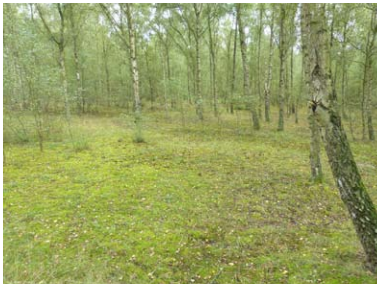
Bos van Terhagen