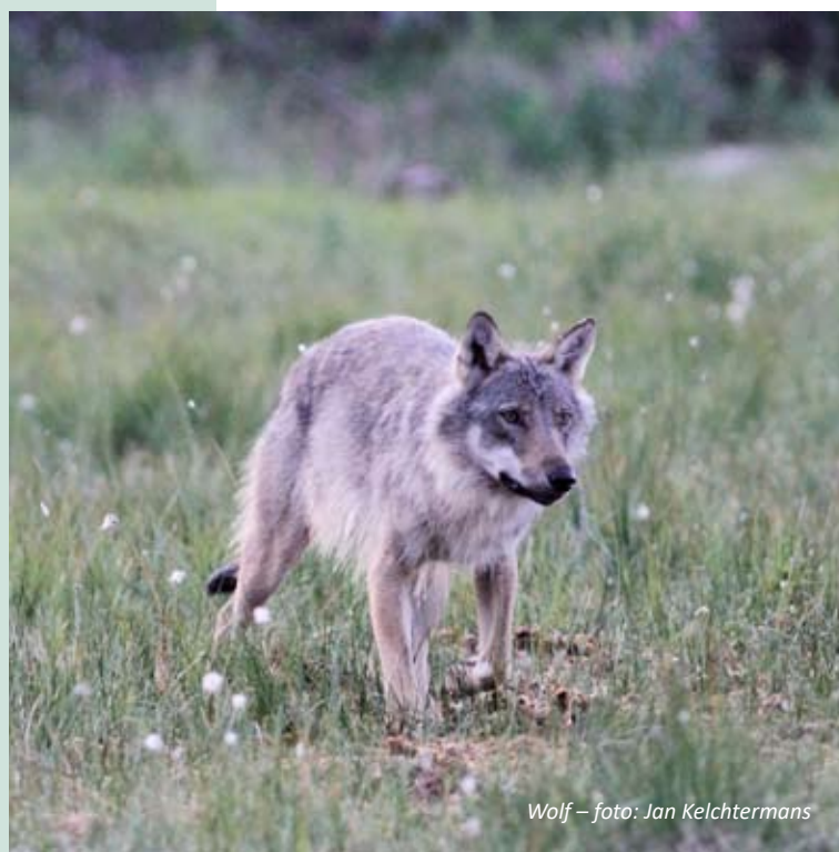
Wolf – foto: Jan Kelchtermans