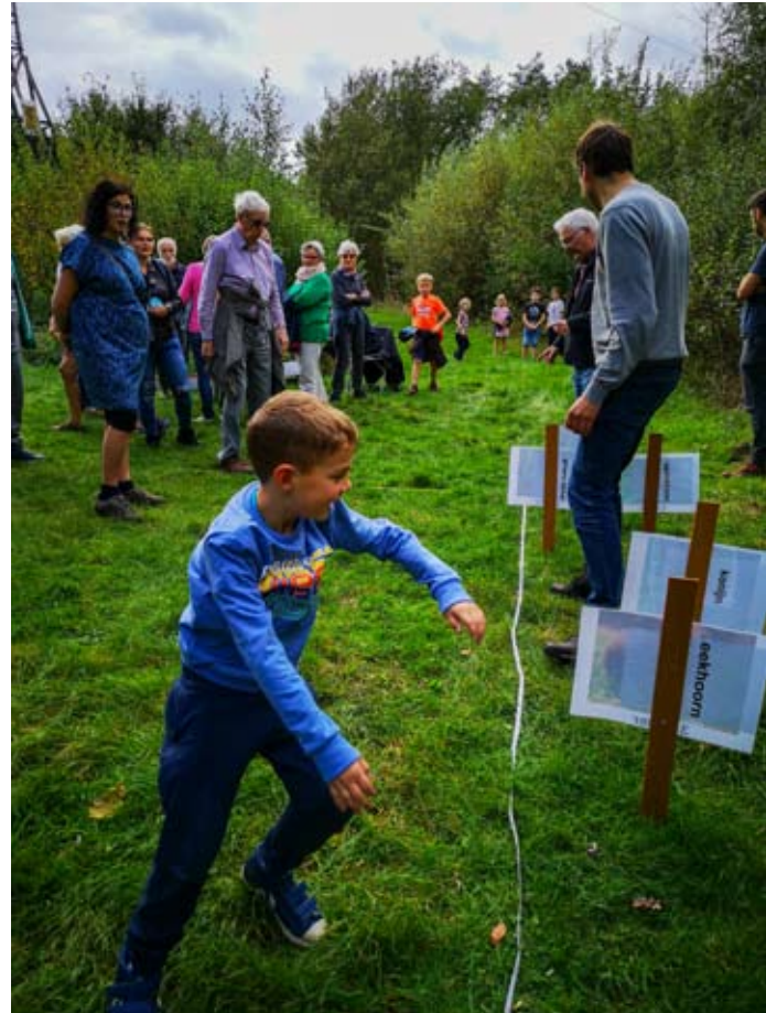
Feesten in de Reukens