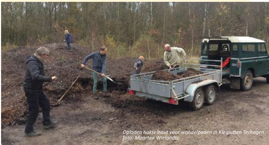
Opladen hakselhout voor wandelpaden in Kleiputten Terhagen

In de Kleiputten Terhagen waren 2 teams actief. Eén team heeft gewerkt aan het uitspreiden van hakselhout op de meest gladde delen van het wandelpad en op de toegangsweg naar het chalet. Terwijl een ander team gewerkt heeft aan het vrijmaken van de noordelijke oever van de visvijver en gestart is met het verwijderen van asbestplaten langs de oever van die vijver.