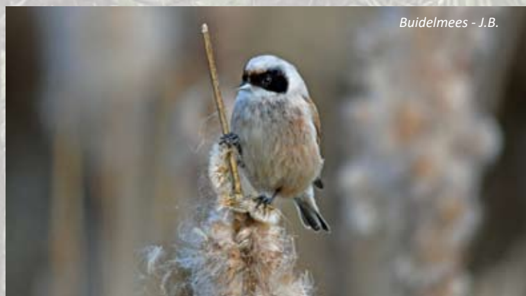
Buidelmees - J.B.