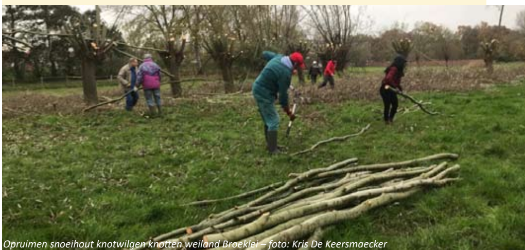
Opruimen snoeihout knotwilgen knotten weiland Broeklei – foto: Kris De Keersmaecker

In een weiland langs de Broeklei in Niel werden 13 knotbomen geknot. Vrijwilligers van Natuurpunt Rupelstreek werken reeds lang aan de bescherming van de knotboom in het landschap. Knotbomen zijn immers, samen met hagen, houtkanten en poelen belangrijk als aankleding van het landschap, daarenboven zijn ze erg belangrijk als leefruimte van planten en dieren. Het knotten en het opruimen van het snoeihout werd uitgevoerd door 10 vrijwilligers.