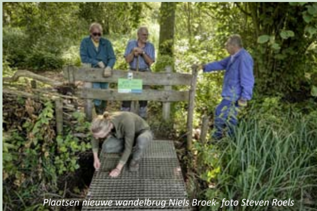
Plaatsen nieuwe wandelbrug Niels Broek

Het onderhoud van de wandelpaden in het Niels Broek is dan ook een regelmatig weerkerend karwei en dat deden we op maandag 19 augustus. Een dag later waren we er opnieuw aan de slag dit keer voor het plaatsen van een nieuwe wandelbrug. Helpers waren: Jan, Steven, Harry, Yente, Jos en Erik