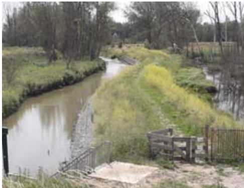
Wandelpad langs Heirbeek

je kiest voor de korte wandeling, dan volg je onderaan de dijk, bij de picknickbank, het pad rechts van de beek en lees de tekst verder vanaf kijkpunt 8.