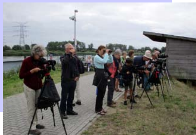
Vogels kijken Noordelijk eiland

De volgende rondjes vogels kijken Noordelijk eiland gaan door op zaterdagen 5 oktober – 2 november en 7 december – afspraak 8u50 parking Tolhuis of om 9u veerboot Rupeldijk Schelle – Heb je geen verrekijker? Geen nood, er worden verrekijkers ter beschikking gesteld. Stuur vooraf wel een mail naar: debacker-vanlinden@telenet.be