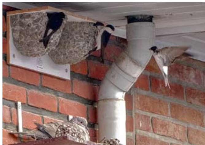
Broedende huiszwaluwen in Rumstse centrumstraten, met onderaan ook een broedende Turkse tortel

De vrijwilligers van Natuurpunt Rupelstreek zijn de gemeente Rumst en Regionaal Landschap Rivierenland dankbaar