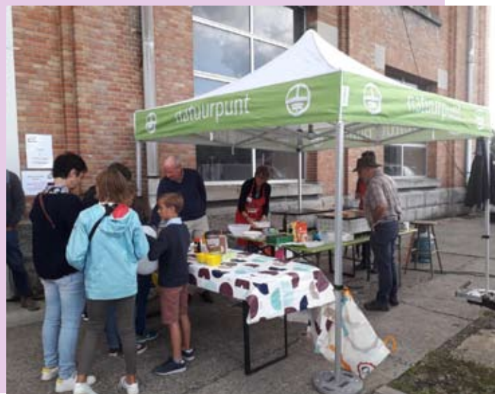
Pannenkoeken bakken voor de natuur