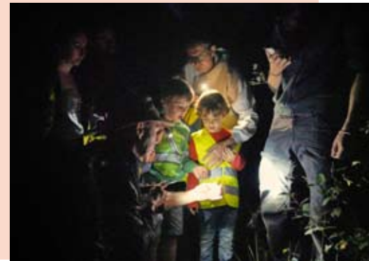
Nacht van de Vleermuis in de Kleiputten Terhagen

Geen overrompeling op zaterdagavond 31 augustus voor de Nacht van de Vleermuis, waarbij we kinderen uitnodigden om samen met enkele gidsen van Natuurpunt op stap te gaan in het halfduister van de Kleiputten Terhagen. Welgeteld 3 gezinnen mochten we verwelkomen, alles samen 5 kinderen en 3 papa's, plus nog enkele natuurliefhebbers. In geologische termen is de Kleiputten Terhagen nog een bijzonder jong gebied en dat vertaalt zich ook in de aanwezigheid van vleermuissoorten en aantallen. Momenteel liggen die cijfers nog aan de lage kant. Met onze batdedectors konden we dan ook slechts 2 soorten determineren: dwergvleermuis en baardvleermuis. Mogelijk overvliegen soorten, zoals grootoorvleermuis, laatvlieger en rosse vleermuis de Kleiputten Terhagen, tijdens hun jachtvluchten, dat zijn meestal kortere momenten, wat de kans op een waarneming kleiner maakt.