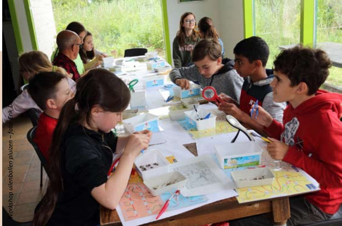
Workshop uilenballen pluizen

soms spannend, maar super leuk - ik vond het een leuke ervaring om de uilenballen uit te pluizen en meer over de uilen te weten te komen - ik vond het leuk, interessant en het was leuk om te kunnen ontdekken welke muis het was - eerst was het vies, maar toen je iets vond, durfde je meer - echt een aanrader - het stonk wel een beetje, maar dat kon de pret niet bederven - het was een beetje vies, maar leuk als je botjes vindt – super!