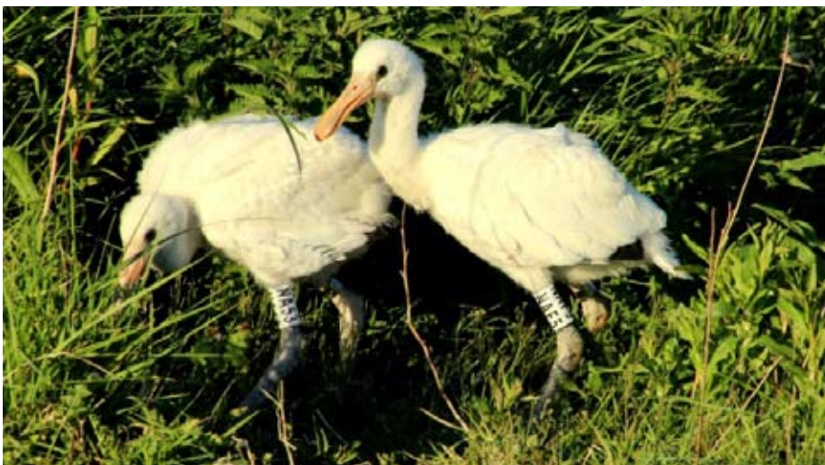
Net geringde jonge lepelaars

Tekst : Erik De Keersmaecker – Natuurpunt Rupelstreek