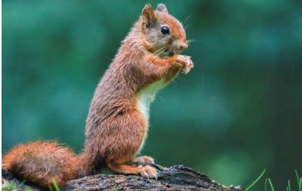
Kraakje de Eekhoorn

Meer info: doerugzak@natuuraartselaar.be