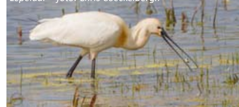
Lepelaar