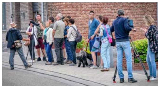
Kijken naar de zwaluwen in Rumstse centrumstraten

voor de hulp om dit formidabel resultaat te bereiken. En we zijn ook de bewoners van de Rumstse centrumstraten dankbaar, zij zorgen ervoor dat de zwaluwen welkom zijn en welkom blijven in hun straat en onder hun dakgoten. Het beetje hinder met soms vogelpoep op de stoep of op een andere plek nemen ze er graag bij.