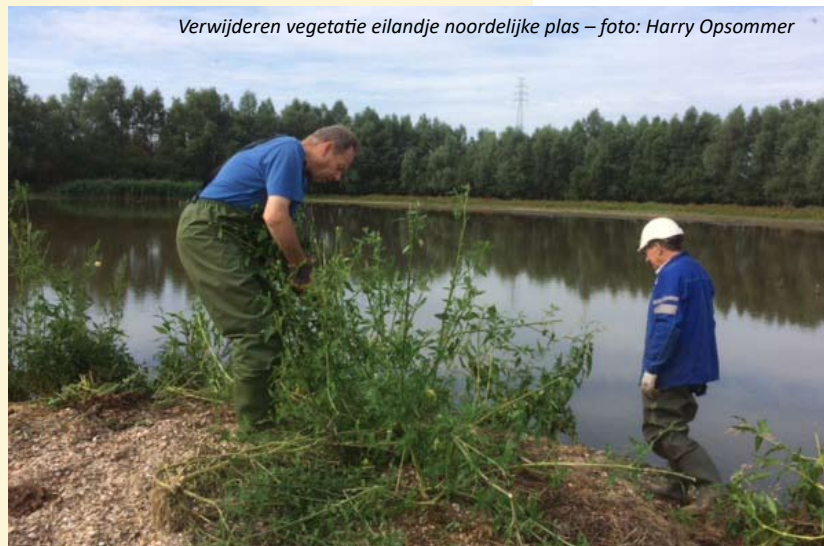
Verwijderen vegetatie eilandje noordelijke plas

Belangrijke voorwaarde om het eilandje optimaal te houden voor die grondbroeders is het regelmatig verwijderen van de vegetatie, zodat de bodem kaal blijft en opgroeiende planten vóór- en na het broedseizoen verwijderd worden. Een taak die op maandag 5 augustus voor het eerst werd uitgevoerd door vrijwilligers van Natuurpunt Rupelstreek.