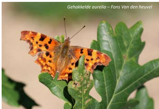
Gehakkelde aurelia – Fons Van den heuvel