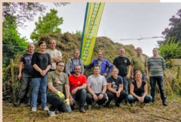
Team Cummins en vrijwilligers Natuurpunt

In oktober 2012 werd de samenwerking tussen Cummins en Natuurpunt opgestart, aanvankelijk met de jaarlijkse hulp bij het opruimen van het maaisel in de oude vloeibeemd in Rumst. Maar sinds enkele jaren ook in de natuurgebieden Kleiputten Terhagen en het Niels Broek. En daar zijn we het bedrijf uit Rumst erg dankbaar voor.