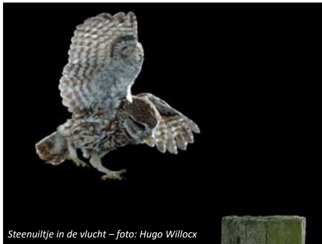
Steenuiltje in de vlucht

Dat trouwens nog flink kan stijgen, er staan immers nog enkele rondjes steenuilen in onze agenda's. Onder meer in het resterend open landschap van Hemiksem, het zuidelijk boerenland van Reet, de omgeving Kleine Steylen in Boom, de Hoge en Lage Vosberg en Lazernij in Rumst. Voor eind maart willen de rondjes steenuilen afronden en de optelsom maken.