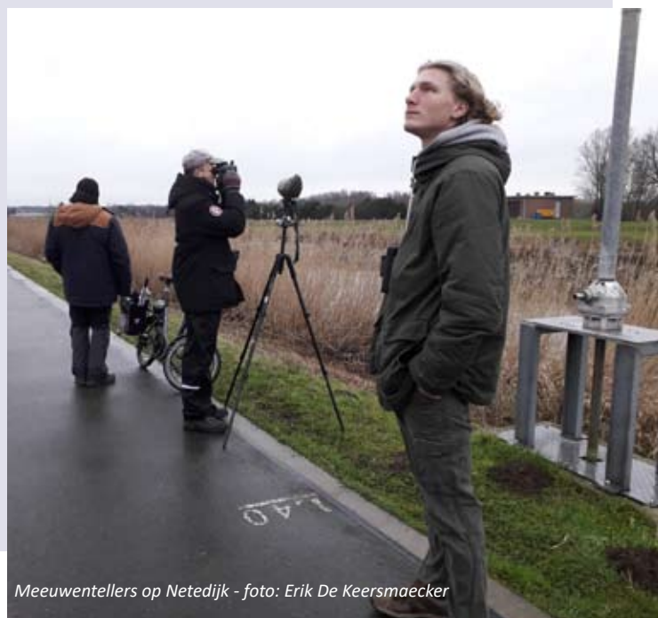
Meeuwentellers op Netedijk

Tekst: Wouter Van Assche en Erik De Keersmaecker