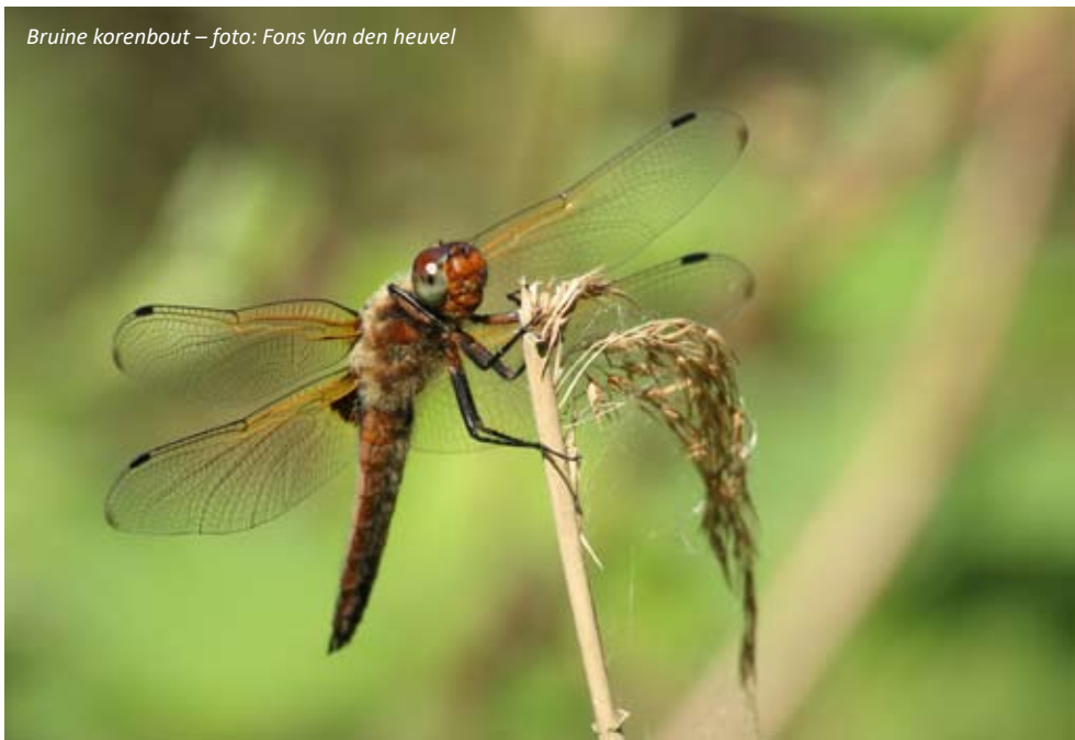
Bruine korenbout