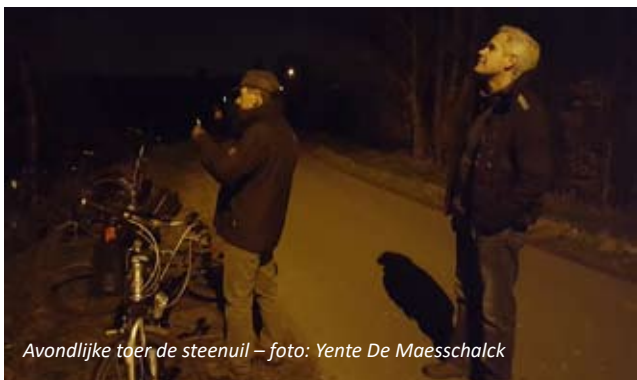
Avondlijke toer de steenuil