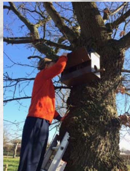
Een nieuwe nestkast voor het steenuiltje in de Schanshoeveeweg in Reet

Meer info over de projecten voor de bescherming van het steenuiltje – www.natuurpunt.be/steenuilen