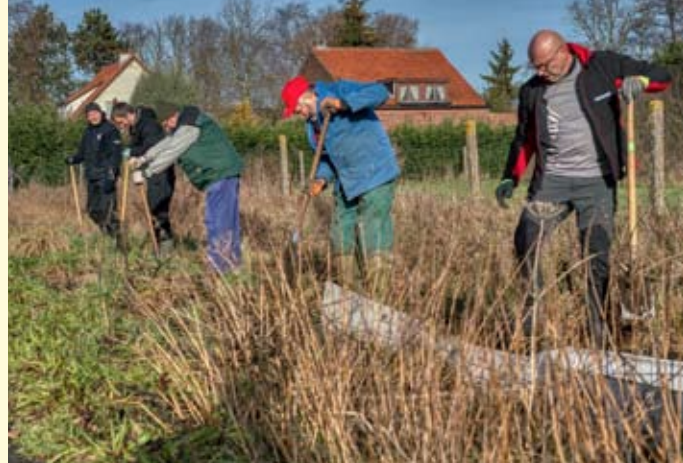
Plaatsen paddenschermen door vrijwilligers Natuurpunt en Team Cummins

Vorig jaar werden 1.276 diertjes veilig de straat overgezet, daarbij: 1.107 gewone padden, 131 kleine watersalamanders, 34 alpenwatersalamanders en 4 groene kikkers. Meteen één van de beste resultaten sinds de start van de paddenoverzetacties in 2010.