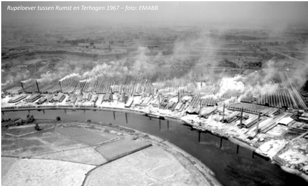
Rupeloever tussen Rumst en Terhagen 1967