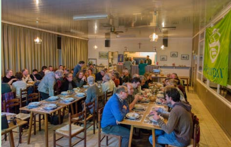
Ledenavond 2019 in Parochiezaal Terhagen