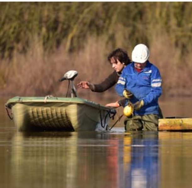
Verwijderen nestvloten Noordelijk eiland

Het grootste nestvlot werd aan de oever getrokken, terwijl de 2 nestvloten van de noordelijke plas, tijdelijk werden gestockeerd aan de rand van het terrein. Eind maart worden de 3 nestvloten allen op de grote zuidelijke plas geplaatst, vooraf wordt er opnieuw een raster omheen gemonteerd, zodat de jonge vogels op de vloten moeten blijven, tot ze kunnen vliegen. Op de vloten wordt telkens een dikke laag schelpen aangebracht, ideaal voor broedplaats voor de visdiefjes. Op de noordelijke plas gaan we dan ook verder werken aan de inrichting van het nieuwe broedeiland, onder meer door het plaatsen van een 20-tal verstop- en rustbuizen voor de jonge vogels.