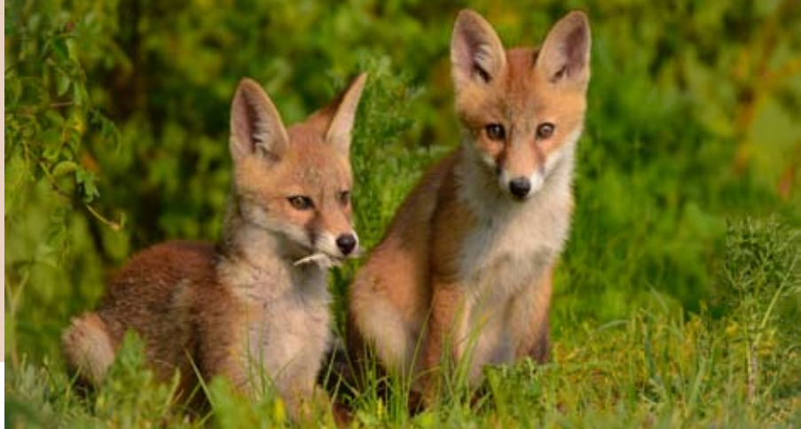
Vossenwelpjes – foto: Yente De Maesschalck

Parking Tolhuis (Rupeldijk), einde Tolhuisstraat Schelle, veerboot 15u, terug om 20u. Info: yente_DeMaesschalck@hotmail.com