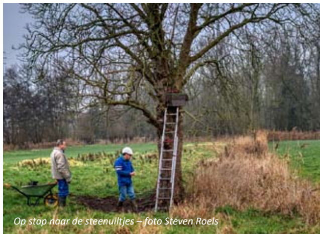
Op stap naar de steenuiltjes