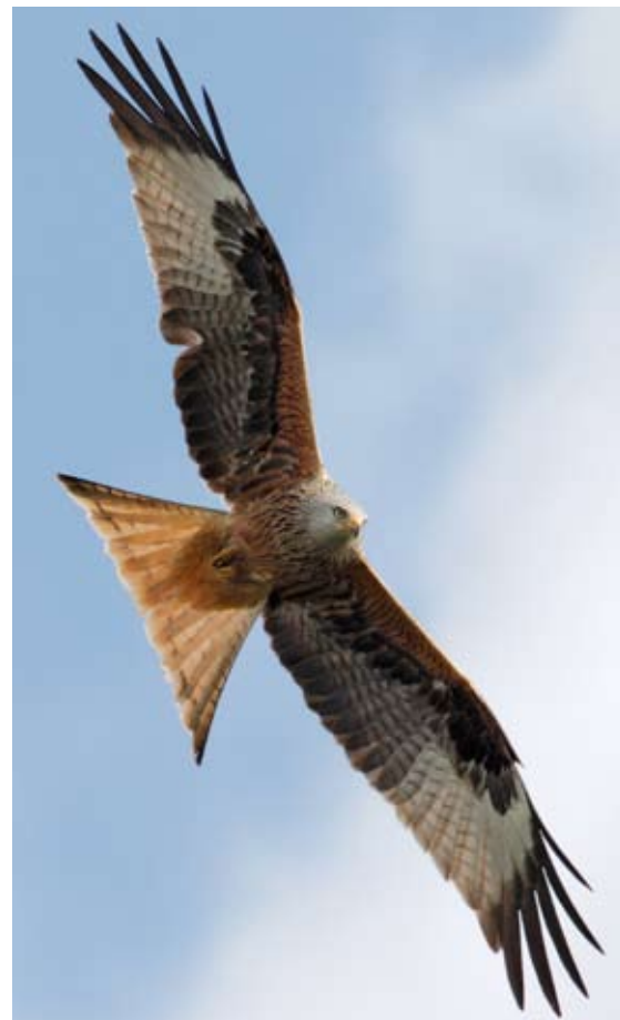
Rode wouw