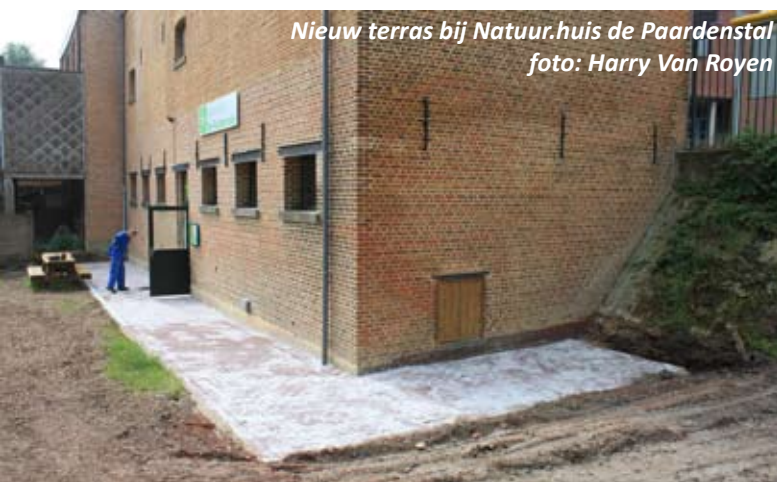
Nieuw terras bij Natuur.huis de Paardenstal