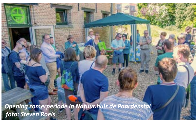
Opening zomerperiode in Natuur.huis de Paardenstal