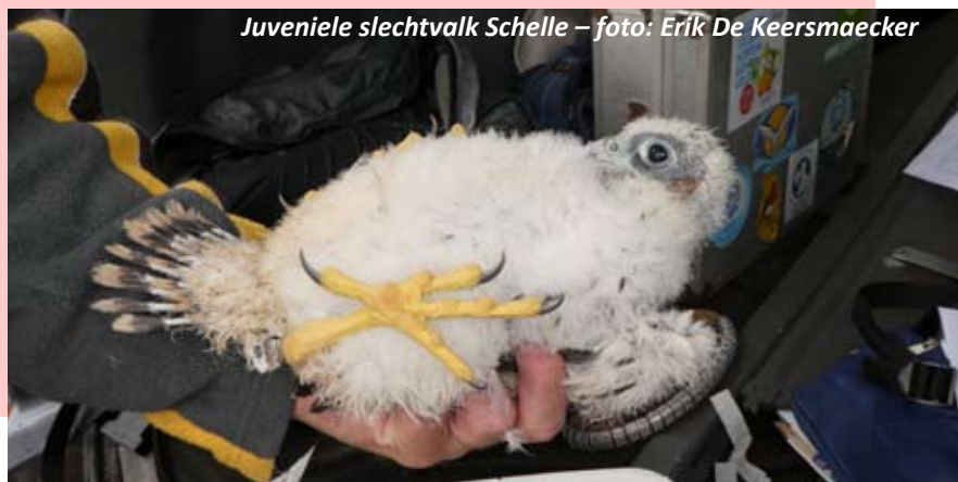
Juvenile slechtvalk Schelle

Slechtvalken zijn echte vogeljagers en een jagende slechtvalk is een van de meest spectaculaire natuurbeelden, die men in de natuur kan zien. Bij hun stootvluchten op vliegende prooivogels halen ze snelheden tot meer dan 250 kilometer per uur, wat hen tot de snelste vogels ter wereld maakt. De prooien worden in de lucht gegrepen en al vliëgend meegenomen naar een hoge plaats. De Schelse slechtvalken worden intens opgevolgd door Linn en Rik. Bijna dagelijks zijn ze aanwezig in een parkje langs de Alexander Wuststraat, vlakbij de centrale, om met verrekijker en telescoop het wel en wee van de slechtvalken te volgen.