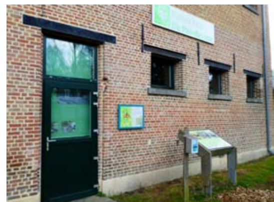
Natuur.huis de Paardenstal