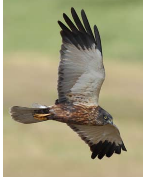
Bruine kiekendief

Aan iedereen een prachtige zomer toegewenst en tot in het najaar!