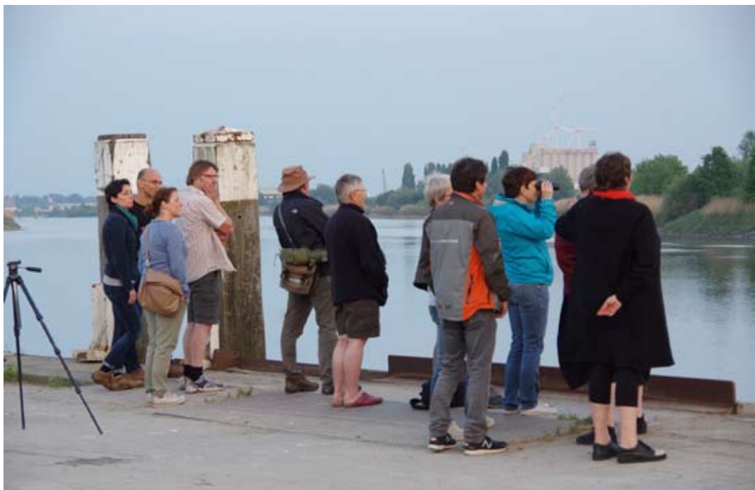
Fintenwatchers langs de Rupel

Zodra de paaiperiode afgelopen is, trekken de finten opnieuw naar zee. De bevruchte eitjes die afgezet werden worden dan larven en tijdens de herfst laten die zich met het getij meedrijven richting zee, waar ze opgroeien tot volwassen finten.