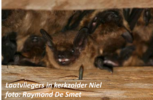
Laatvliegiers in kerkzolder Niel