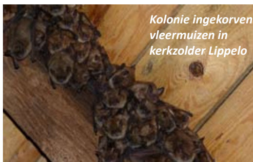
Kolonie ingekorven vleermuizen in kerkzolder Lippelo

Tijdens lente- en zomermaanden troepen vleermuizenvrouwtjes samen in zogenaamde kraamkolonies, om daar hun enig jong te baren. Dit gedrag heeft enkele voordelen, de groep kan immers makkelijk de temperatuur regelen. Op koude dagen kruipen ze dicht tegen mekaar aan met de jongen tussen hen in, op warme dagen hangen ze wat verder uit mekaar. Bovendien hebben de moeders steeds een oppas in de buurt. De vrouwtjes gaan om beurten jagen, er blijven steeds enkele vrouwtjes achter om op de jongen te passen. De grootte van de groep hangt af van soort tot soort. Grootoorvleermuizen leven meestal in kleine groepen van 10 tot maximaal 20 diertjes. Bij ingekorven