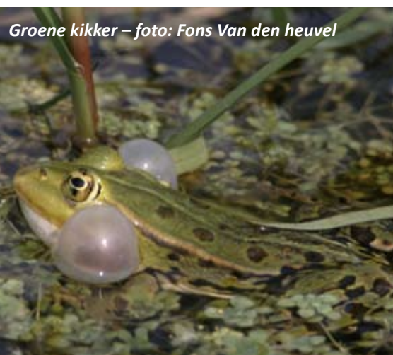
Groene kikker

9. Hier kan je eventueel een laarzenpad door Walenhoek volgen. Onderweg ontmoet je enkele open perceeltjes in het pioniersbos. Elk jaar, tijdens het laatste weekend van augustus worden deze perceeltjes gemaaid door vrijwilligers van Natuurpunt en het maaisel wordt gestockeerd aan de rand van de perceeltjes. Het resultaat van dat werk mag gezien worden, met tijdens de zomermaanden telkens duizenden bloeiende bosorchissen. Een hek en afsluiting vormen de grens met de percelen van het ANB. Hier grazen Gallo-