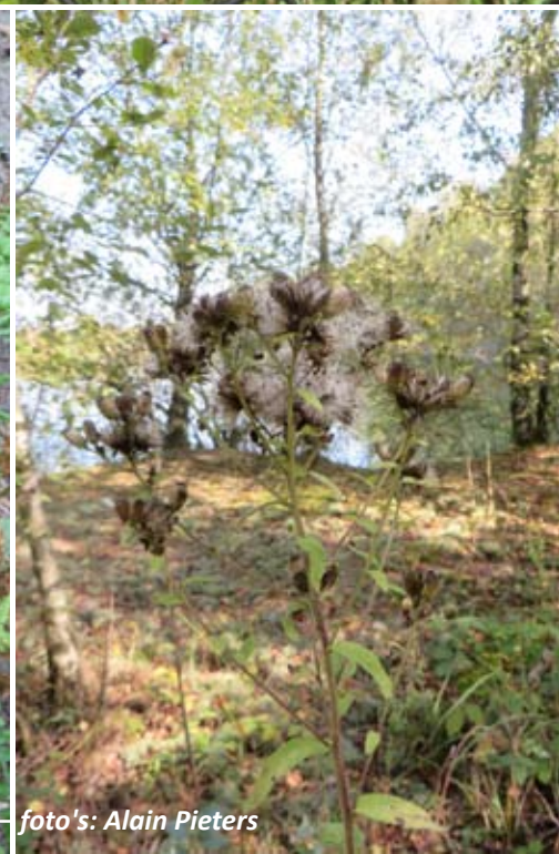
vlnr Geschubde mannetjesvaren, Donderkruid