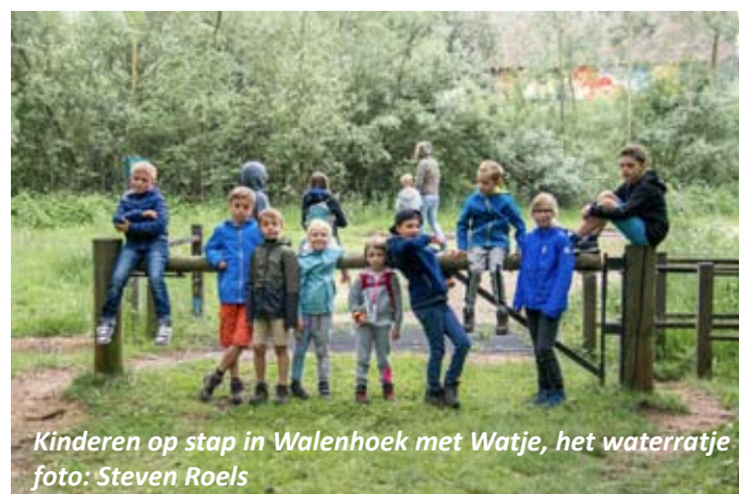
Kinderen op stap in Walenhoek met Watje, het waterratje