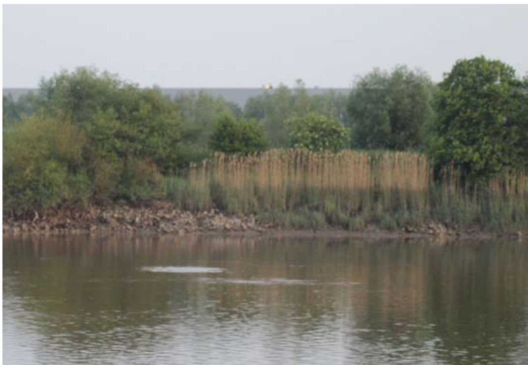
Kring paaiende finten in de Rupel