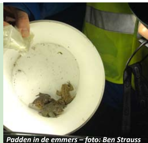
Padden in de emmers