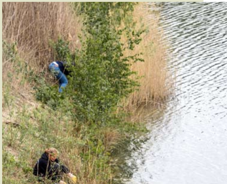
Verwijderen berkenstruweel op noordelijke helling

Een andere groep OLVI's werkte aan het verder uitgraven van oude spoorwegrails en nog een andere groep werkte aan het verwijderen van een dik pak klei op de bielzentrapp tussen de oriëntatietafel en de poort die toegang geeft tot de Kleiputten Terhagen.