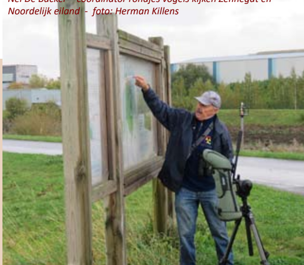
Uitwandeling vogels kijken 2017