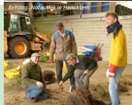
Behaag..Natuurlijk in Hemiksem

En er werden ook weer bijenhottelletjes te koop aangeboden en daarvan werden 86 stuks verkocht. Deze bijenhottelletjes worden vervaardigd bij Arbeidszorgbedrijf den Atelier in Niel en daar werd hard gewerkt om de bestellingen tijdig klaar te krijgen tegen het verdeelmoment.