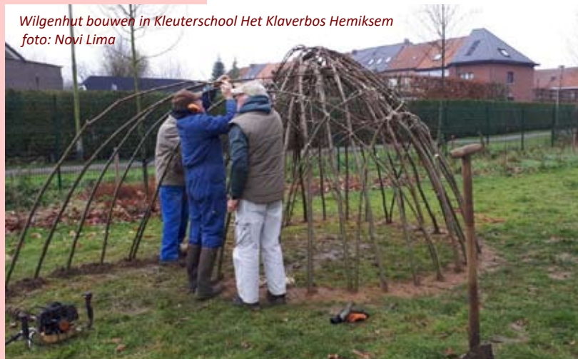
Wilgenhut bouwen in Kleuterschool Het Klaverbos Hemiksem

Met veel goede moed en de nodige hulpmaterialen, zoals een motorgrondboor gingen we op dinsdag 19 december opnieuw aan de slag voor de bouw van een wilgenhut op een grasveld naast de speelplaats van de Kleuterschool. Als het tijdens de komende lente af en toe eens regent en de wilgenhut tunnel blaadjes en takjes krijgen, kan het daar nog een gezellig plekje worden.