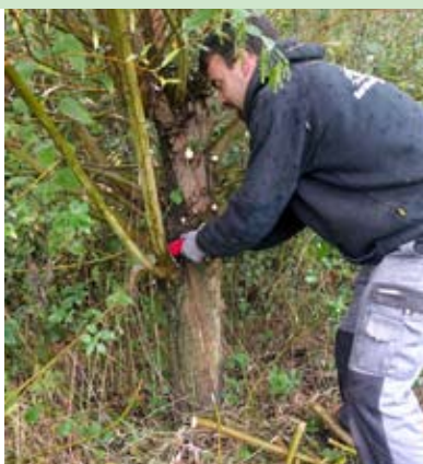
Natuurwerkdag in de Reukens

Info: Jan Eulaers 0495 52 77 31 of Luk Smets 0477 66 94 32