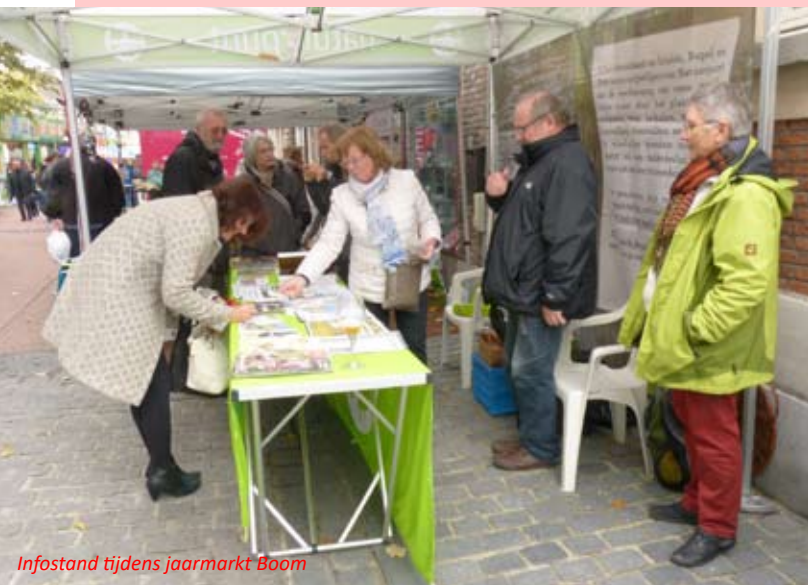
Infostand tijdens jaarmarkt Boom