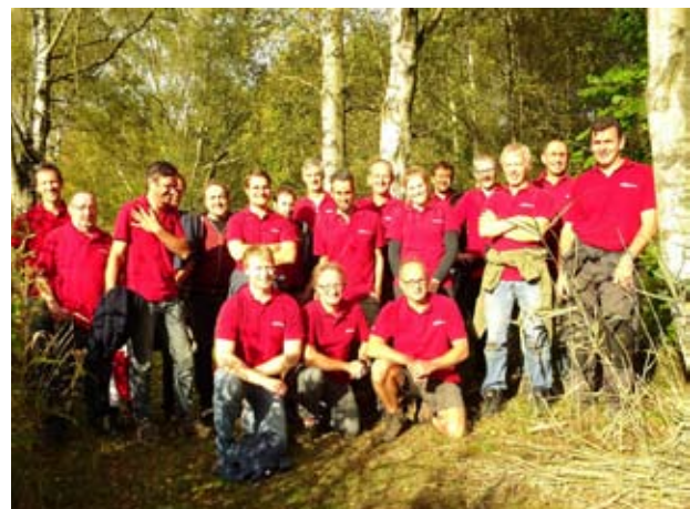
Team Keppel Seghers in de Kleiputten Terhagen