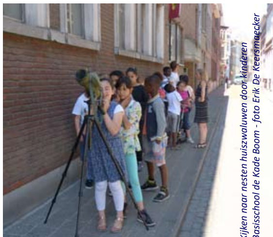
Kijken naar nesten huiszwaluwen door kinderen Basisschool de Kade Boom