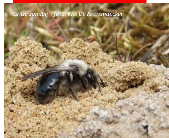
Grijze zandbij

Bekijk alle activiteiten op www.natuurpunt.be/rupelstreek