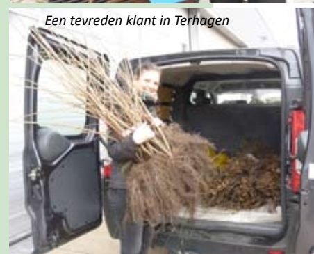
Een tevreden klant in Terhagen