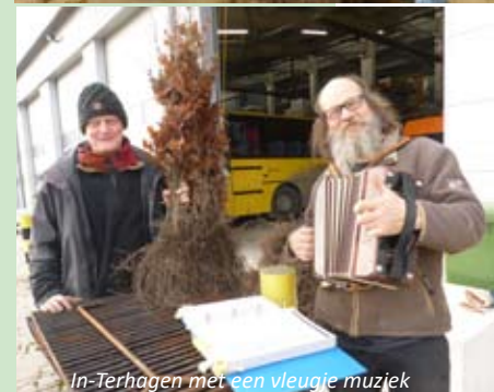
In-Terhagen met een vleugje muziek