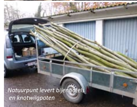
Natuurpunt levert bijenhôtels en knotwilgpoten