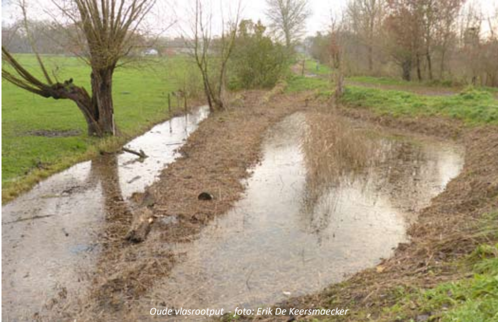
Oude vlasrootput

groepen Canadese ganzen, Nijl ganzen en grauwe ganzen zien. En met wat geluk ook blauwe reigers, kleine zilvereigers of zelfs een ooievaar. Natuurpunt werkt hier aan het herstel van het landschap door het aanplanten en onderhoud van knotbomen. Op de hoek van de Korte Ameldijk en de Broeklei werd door Natuurpunt een oude vlasrootput hersteld. Vlasrootputten danken hun naam aan hun vroegere functie: het roten van vlas. Oude vlasrootputten zijn echter ideale voortplantingsplaatsen voor kikkers en salamanders. Door hun geringe diepte drogen ze tijdens de zomer uit, waardoor ze niet geschikt zijn voor vissen. Ideale poelen dus voor onze amfibieën en tevens voor vele kleine waterinsecten.