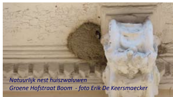
Natuurlijk nest huiszwaluwen Groene Hofstraat Boom

Tijdens de voorbije broedperiode konden we er een geslaagd broedgeval van ransuil vaststellen. Net zoals bij bosuil verlaten de jonge ransuilen het nest voor ze kunnen vliegen. Om hun ouders te lokken roepen de jongen voortdurend een jankend geluid.