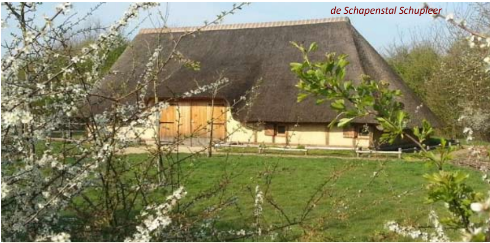
de Schapenstal Schupleer

te bevelen. Het einde van de wandeling is voorzien rond 16.15 u waarna, wie dat wenst, nog kan genieten van een Gageleer in de Schapenstal. Dit zeldzaam stuk Kempens erfgoed werd in 2010 en 2011 door een ploeg enthousiaste vrijwilligers van Natuurpunt heropgebouwd. Een pareltje! Meer info: jan.eulaers@icloud.com of 0495 52 77 31