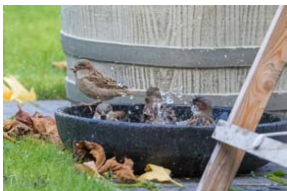
Huismussen in bad