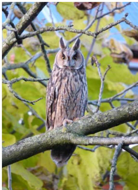
Ransuil in tuin