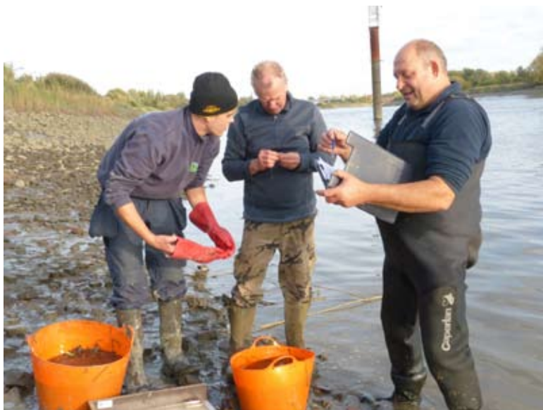
Bemonstering schietfuiken door Team Serge Loverie

Woensdag 11 oktober en donderdag 12 oktober stonden de schietfuiken van Serge Loverie opgesteld langs de Rupeloever ter hoogte van het 't Steencycken in Boom. Woensdag was de buit: 1 spiering, 1 blankvoorn, 1 blauwbandgrondel, 69 brakwatergrondel, 41 palingen, 2 snoekbaarzen, 5 wolhandkrabben en ongeveer 430 steurgarnalen. Achteraf werden alle gevangen vissen teruggeplaatst in de rivier