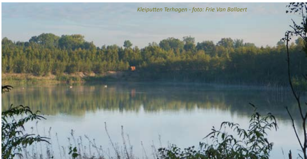
Kleiputten Terhagen

Terwijl de ene ploeg zich in de modder en de klei in het zweet werkte, ruimde een andere doorheen het gebied restanten op van de klei-industrie en dumpingpraktijken. Stapels oud ijzer, oude afvoerbuizen, ovenplaten of wielassen: je kan het zo gek niet bedenken of je vindt het hier. Toch is elk opgeruimd blikje weer een stap verder, hoe klein ook. Behalve schroot kwamen er in onze kranige aanhangwagen ook stapels houten balken, multiplexplaten, loodzware paletten, kippengaas en camouflagenetten terecht. Binnenkort gaat ook het stalen onderstel van de laatste jachthut definitief tegen de vlakke.