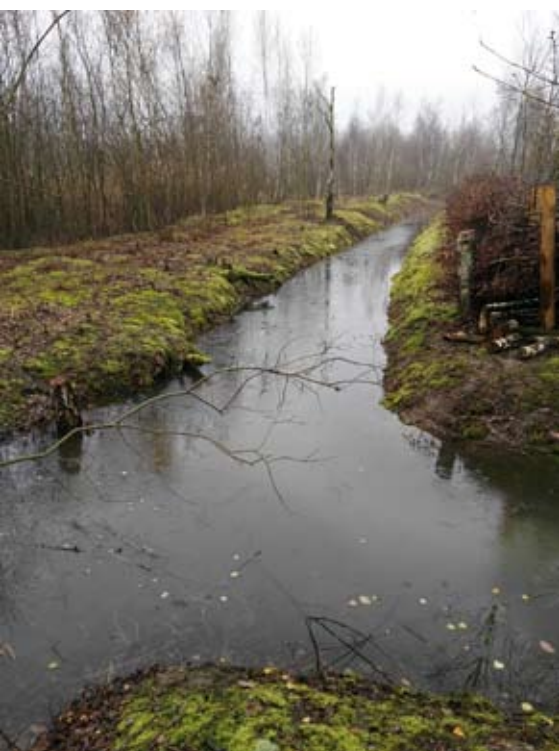
Nieuwe poel voor kamsalamander

Eén van de kwetsbare diersoorten die we in het natuurgebied zeker een plaats willen geven, is de kamsalamander. Daarom vormden we een oude, opgedroogde gracht om tot een nieuwe langgerekte poel, afgeschermd door een takkenwal. Na de regenval van de voorbije weken is er daadwerkelijk een nieuwe poel ontstaan. Hopelijk biedt die nieuwe kansen voor deze zeldzame draakjes.