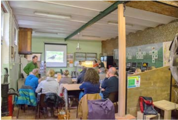
Workshop tuinvogels in Natuur.huis de Paardenstal

Met 17 deelnemers, waarvan er 12 een nestkastje in elkaar schroefden, was er een mooie belangstelling voor dit infomoment op zaterdag 4 november in Natuur.huis de Paardenstal. Een workshop waarbij de deelnemers eerst kennis konden maken met een 20-tal vogelsoorten die in elke min of meer natuurlijke tuin kunnen waargenomen worden. Op kop natuurlijk koolmees en pimpelmees, soorten die zich graag laten verleiden door een nestkastje. Op de website van Natuurpunt kan je de Tuingids voor blije vogels downloaden en dan ben je meteen klaar voor het Grote Vogelweekend van 27 en 28 januari.