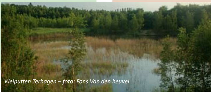
Kleiputten Terhagen

Meld vooraf je deelname: SMS naar 0475/371473 of mail naar: mdmaesen@gmail.com