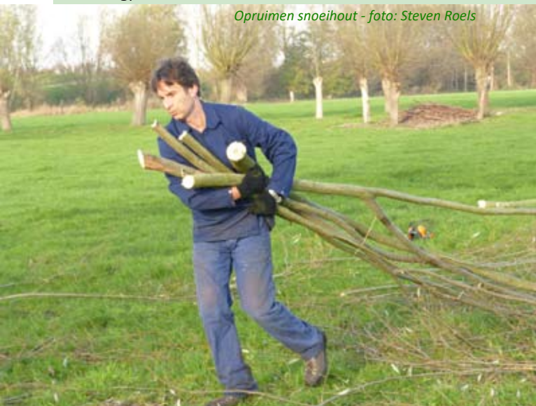
Opruimen snoeihout

Elke winter organiseert Natuurpunt enkele knotacties, het knotten van de bomen en vooral het opruimen van het snoeihout is een bijzonder zwaar karwei. Gelukkig kan Natuurpunt telkens rekenen op een aantal gemotiveerde vrijwilligers. Dat bleek nu ook weer op zaterdag 18 november tijdens de Dag van de Natuur, toen 11 vrijwilligers op de afspraak waren voor het knotten van 8 knotwilgen langs de Wullebeek op de grens van Niel en Schelle. Die knotbomen werden in 1995 door Natuurpunt aangeplant en ze markeren er mooi de kronkelende loop van de Wullebeek in het landschap. Met het snoeihout werden enkele houtmijten gebouwd. Die houtmijten zijn prima schuilplaatsen voor kleine zoogdierpjes en vogels. Een 40-tal rechte takken werden apart gehouden voor de campagne Behaag..Natuurlijk. In totaal werden tijdens Behaag..natuurlijk 260 knotwilgpoten verkocht. Natuurpunt Rupelstreek zorgt voor de levering van de knotwilgpoten in Aartselaar, Hemiksem, Niel en Rumst.