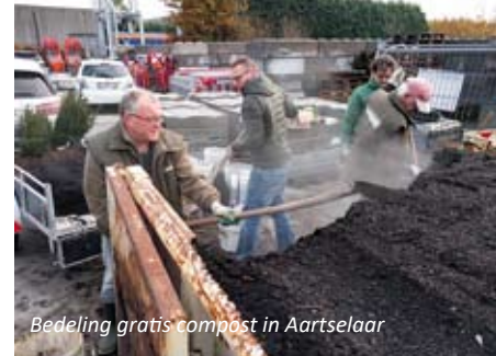
Bedeling gratis compost in Aartselaar