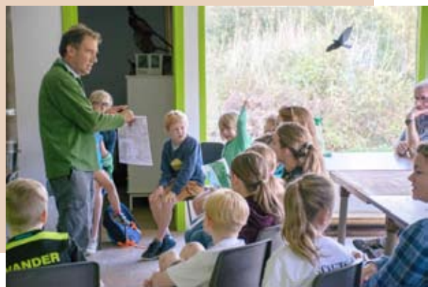
Wat kruipt er rond in de Kleiputten Terhagen?

Daarna kregen we nog een boeiende rondleiding door de kleiputten Terhagen waar op dit moment vooral vele verschillende paddenstoelen de show stelen. Het prachtige weer en de kleurenpracht maakten er een heerlijke wandeldag van.