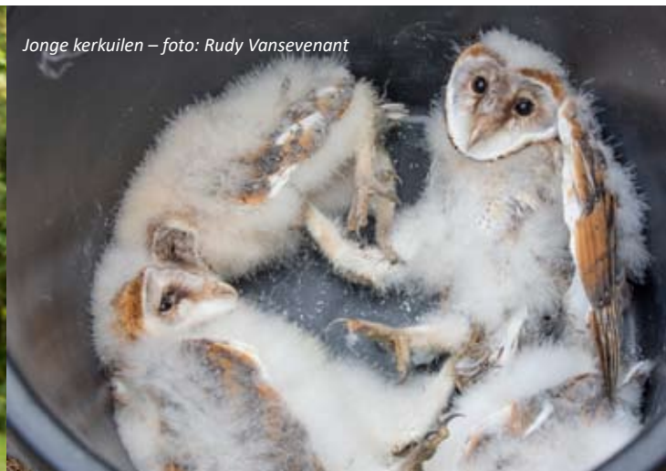
Jonge kerkuilen