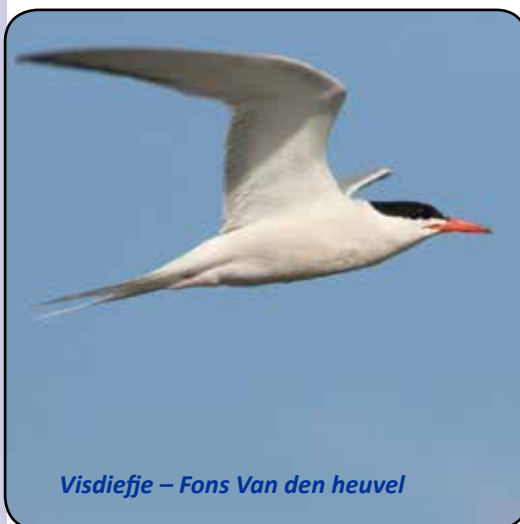
Visdieffe – Fons Van den heuvel