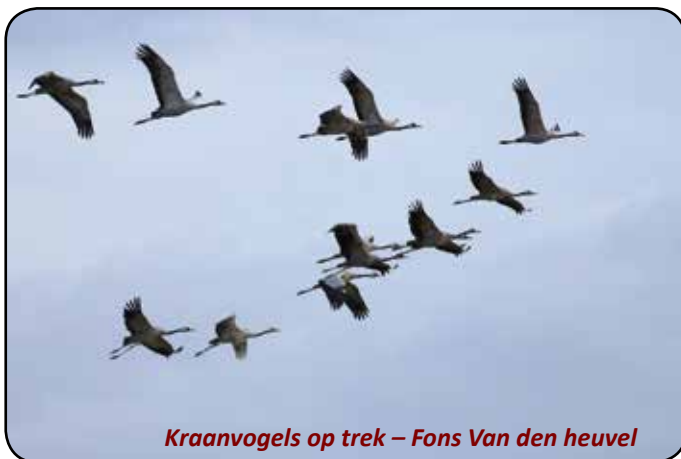
Kraanvogels op trek – Fons Van den heuvel

Tekst: Wouter Van Assche – Vogelwerkgroep Rupel en Erik De Keersmaecker – Natuurpunt Rupelstreek