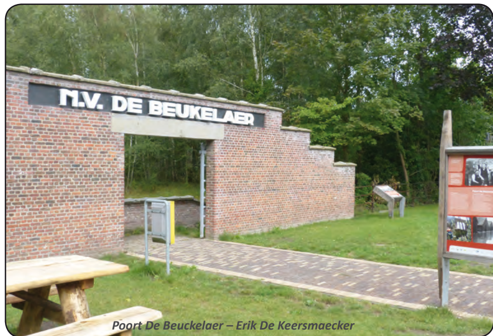
Poort De Beukelaer – Erik De Keersmaecker

4. Een afdaling langs een steile helling en de oversteek van het Keibrekerspad brengt je bij een grotere plas. Kleine karekiet en blauwborst broeden in de brede rietkragen. Scholen rietvoorns zwemmen in het heldere water. In de lente hoor je hier de melancholische zang van fitis. Oeverzwaluwen jagen boven deze plas.