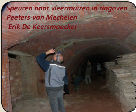
Speuren naar vleermuizen in ringoven Peeters-van Mechelen Erik De Keersmaecker

Op 29 december leverde een bezoek aan ringoven Peeters-van Mechelen 6 baardvleermuizen, 2 watervleermuizen en 1 grootoorvleermuis op, een 10de vleermuis zat zo diep in een voeg verstopt, dat determinatie onmogelijk was. Maandag 2 januari leverde een bezoek aan ringoven Frateur 2 baardvleermuizen op. Op 11 januari werd voor het eerst de ringoven op de EMABB-site bezocht en dat bezoek leverde 5 baardvleermuizen op. Na een bezoek aan ijskelder hof ten Eiken in Rumst konden we 1 overwinterende grootoorvleermuis opschrijven en camerabeelden toonde dat een grootoorvleermuis een regelmatige bezoeker van de vleermuizenkelder in de Kleiputten Terhagen is.