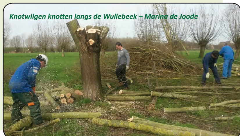
Knotwilgen knotten langs de Wullebeek - Marina de Joode

Eerste afspraak daarvoor op zaterdag 18 november tijdens de Dag van de Natuur.