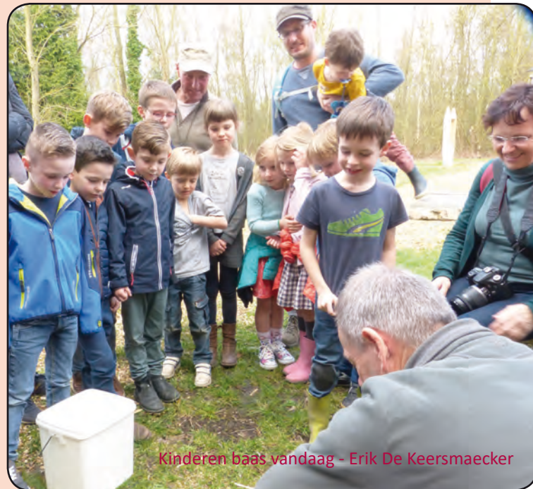
Kinderen baas vandaag - Erik De Keersmaecker

Maar toch voldoende voor de vele nieuwsgierige kinderoogjes. Het diertje werd vrijgelaten en spurtte in zeven haasten naar de veilige bosrand. Terug aan het Natuur.huis was het opnieuw kinderen baas, met soms oplopende decibels van joelende en boomklimmende kinderen.