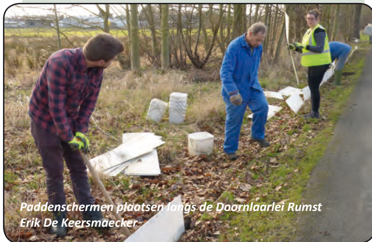
Paddenschermen plaatsen langs de Doornlaarlei Rumst Erik De Keersmaecker

Op 16 maart stond de teller van overgezette diertjes op 472 padden, 254 kleine watersalamanders, 1 bruine en 1 groene kikker, 27 padden en 8 kleine watersalamanders werden voorlopig genoteerd als verkeersslachtoffers. Het recordaantal overgezette diertjes werd gehaald in 2011, toen meer dan 1.200 diertjes de straat werden overgezet.