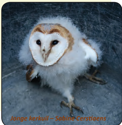
Jonge kerkuil – Sabine Cerstiaens

Dit jaar, op 27 februari werd kerkuil L112601 dood teruggevonden in de wijk Groenenhoek op de grens van Aartselaar en Hemiksem. Deze vogel werd op 6 juni van vorig jaar als nestjong geringd in de nestkast Tolhuisstraat Schelle.