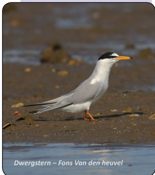
Dwergstern – Fons Van den heuvel