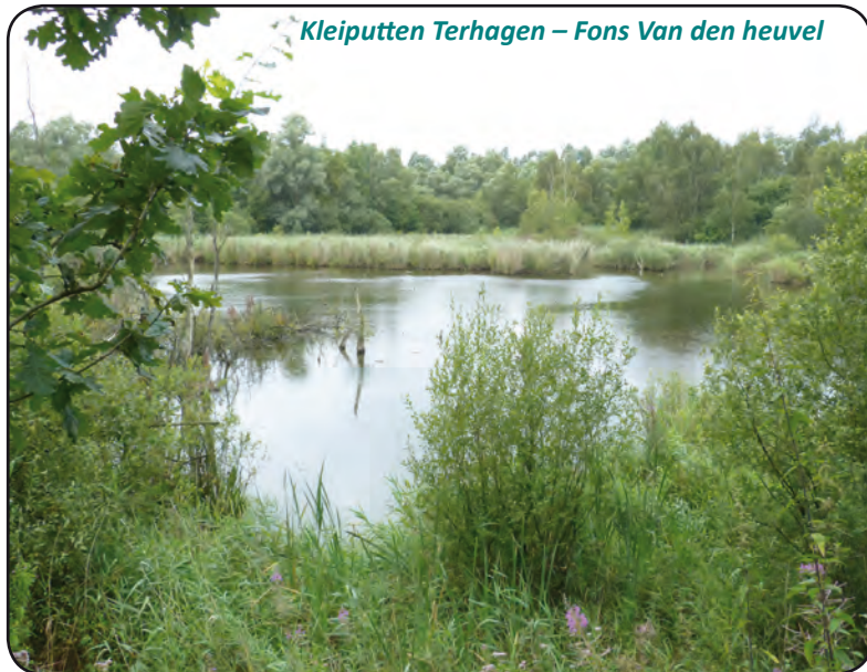
Kleiputten Terhagen – Fons Van den heuvel

3. Je staat nu 22 meter boven de zeespiegel met een prachtig uitzicht over de kleiputten. Bij helder weer kan je zelfs de skyline van Antwerpen, Brussel en Mechelen zien. Een oriëntatietafel helpt je bruggen en gebouwen dichtbij en veraf te ontdekken. Onder je kijk je naar de vijvers van de Kleiputten Terhagen.