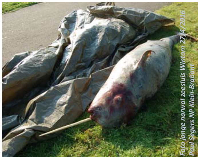
Foto jonge narwal zeeluis Wintam 27/4/2016 Paul Segers NP Klein-Brabant

Het spreekt voor zich dat, mocht het dier op 30 maart beter waargenomen geweest