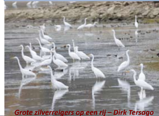
Grote zilverreigers op een rij – Dirk Tersago