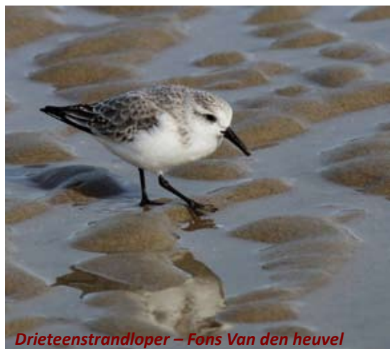
Drieteenstrandloper – Fons Van den heuvel