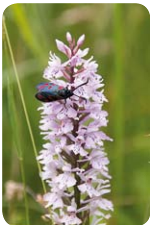
Sint-Jansvlinder op bosorchis

Opvallend in een bloemrijk grasland zijn de bloeiende orchideeën. Vele soorten zijn in de twintigste eeuw achteruitgegaan. Waar eertijds vele graslanden in mei en juni gekleurd waren door orchideeën, zijn ze nu vaak beperkt tot natuurgebieden. Een soort die in de graslanden van de Hobokense Polder voorkomt is de bosorchis. De bosorchis bloeit van eind mei tot een heel eind in juni. De rozetten met gevlekte bladeren kun je al vroeger op het jaar vinden. In de late lente kan je langs het wandelpad ook de grote kever-, de brede wespenorchis en misschien wel de zeldzamere bijenorchis tussen het gras ontdekken.