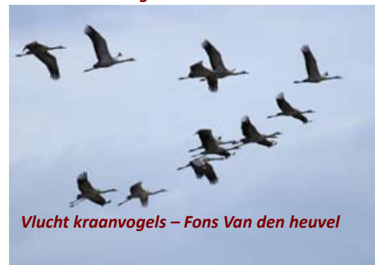
Vlucht kraanvogels – Fons Van den heuvel

Tekst: Erik De Keersmaecker – Guy Buyst Foto's: Fons Van den heuvel – Hilde De Paepe – Dirk Tersago