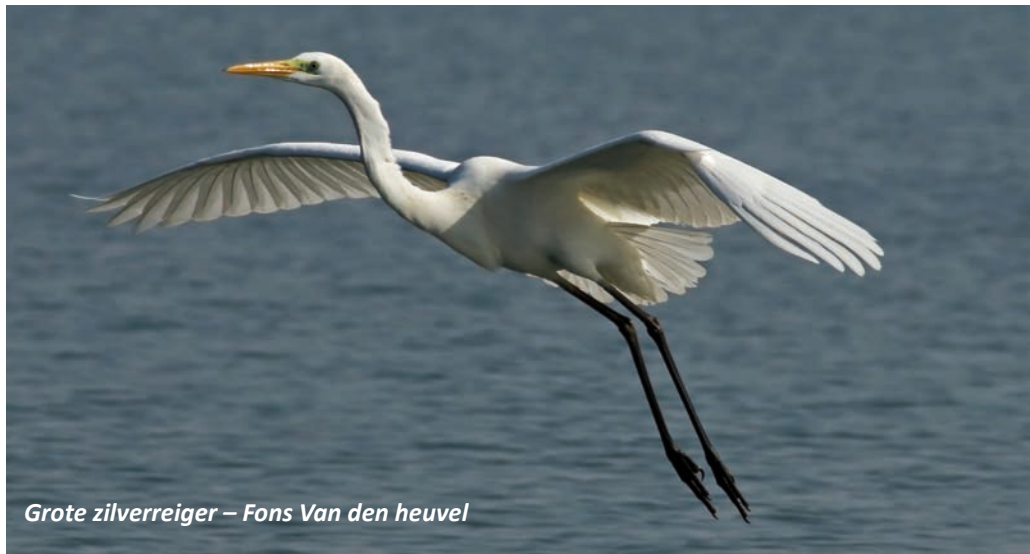
Grote zilverreiger – Fons Van den heuvel