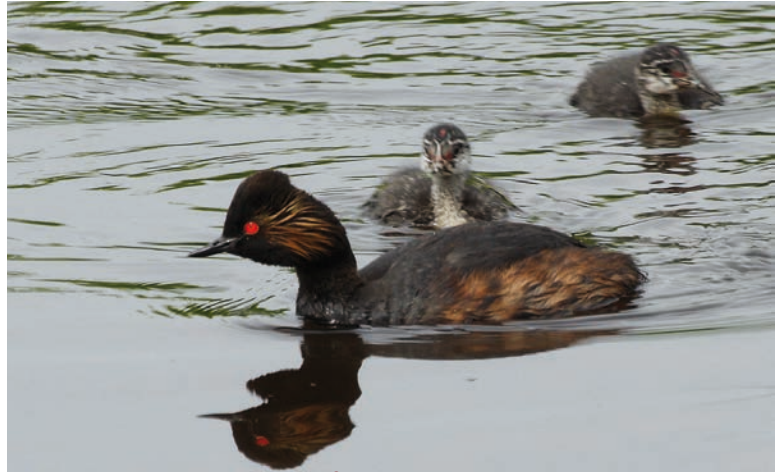
Geoorde fuut met jongen – Fons Van den heuvel