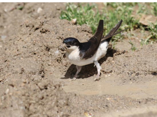
Huiszwaluw – Fons Van den heuvel