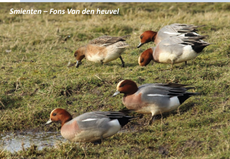
Smienten – Fons Van den heuvel

ten op in de graslanden en herbergen de plassen en krekken een verrassende diversiteit aan watervogels en overwinterende steltlopers. Terwijl zeeschepen op de achtergrond voorbij varen, jagen boven de Scheldeschorren steevast kiekendieven. Baardmannetjes verraden met hun pingelende roep hun