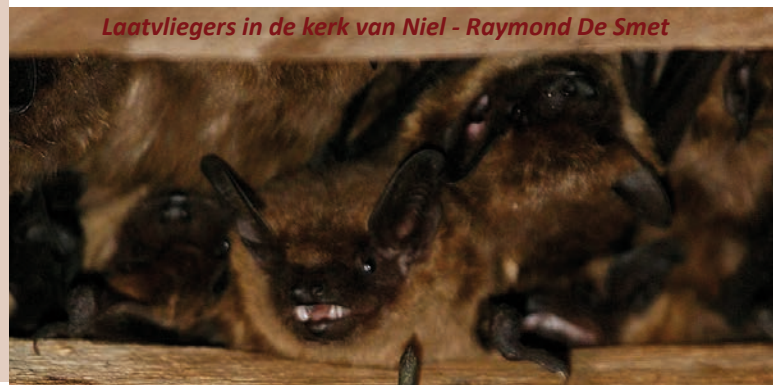
Laatvliegers in de kerk van Niel - Raymond De Smet

Het eerste was het eerste geslaagde broedgeval van zwartkopmeeuw en nu dus ook geoorde fuut. In tegenstelling tot dodaars die met zijn roep zijn aanwezigheid verradert, zijn geoorde futen eerder zwijgzzaam. In zomerkleed is de geoorde fuut goed te herkennen aan de gele oorpluimen. Geoorde futen bouwen een drijvend nest in de dichte begroeiing. Net zoals bij de fuut liften de jongen mee op de rug van de ouders. Bij gevaar duiken ze onder water, terwijl de jongen gewoon op de rug blijven zitten.