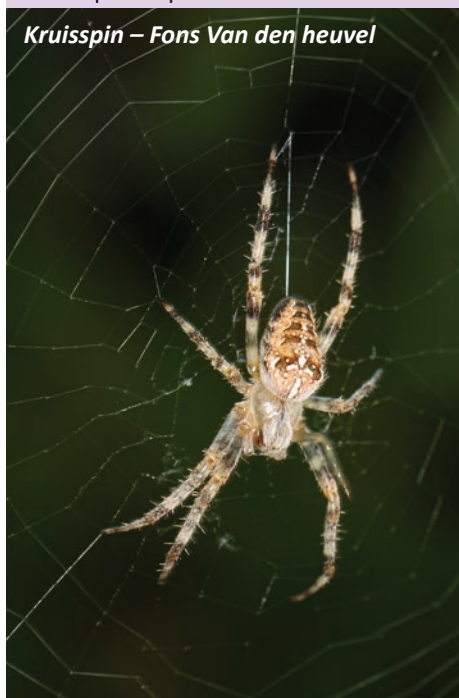
Kruisspin – Fons Van den heuvel

Ridder Berthoutlaan 1 thv het gemeentehuis van Niel. Vooraf melden: Info@natuurpuntrupelstreek.be