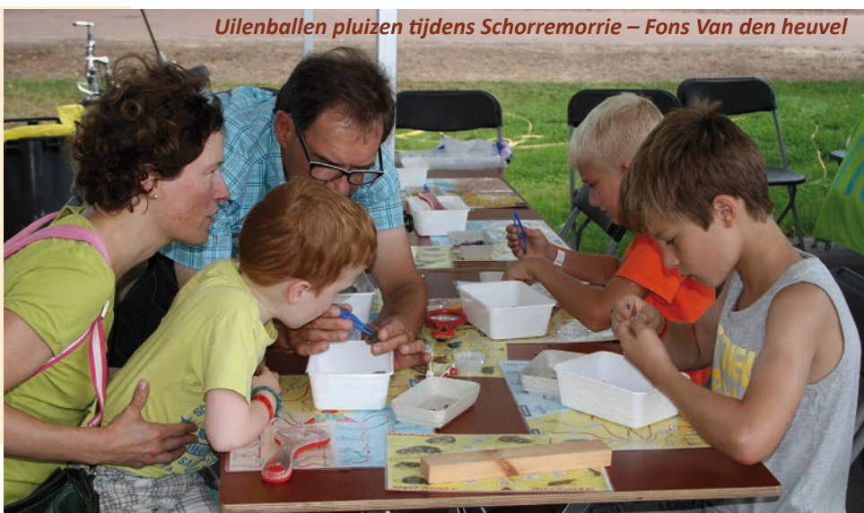
Uilenballen pluizen tijdens Schorremorrie – Fons Van den heuvel

Zondag 28 augustus was het opnieuw een gezellige drukte in de Schorre in Boom. Honderden kinderen konden er samen met hun ouders genieten van de vele attracties. En net zoals de voorbije jaren kon men bij Natuurpunt terecht voor een workshop uilenballen pluizen. Met 5 vrijwilligers stonden we klaar om te helpen bij het pluizen en info te geven over de kleine beentjes en schedeltjes die dan tevoorschijn kwamen. Een pluiskaart en een vergrootglas waren daarbij een bijzonder goede hulp.