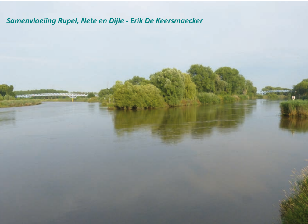
Samenvloeiing Rupel, Nete en Dijle - Erik De Keersmaecker

1. Vanop de wandelbruggen over de Nete en de Dijle heb je een prachtig zicht op beide rivieren. De wandelbrug over de Nete toont je een mooi beeld van de samenvloeiing van de 3 rivieren. Links zie je brede uitsteeksels in de rivier, dat zijn zogenaamde kribben. Ze zorgen ervoor dat de kracht van het water bij opkomend getij gebroken wordt. Met laag tij liggen voor die kribben brede slikplaten bloot, doorgaans zitten er dan enkele wilde eenden en kraakeenden. Vanop de wandelbrug over de Dijle kijk je naar het toekomstig overstromingsgebied Battenbroek. De grote waterplas is een prima overwinteringsgebied voor watervogels. Futen, kuifeenden, tafeleenden en meerkoeten zijn er de talrijkste overwinteraars. Als het over enkele maanden gaat winteren, heb je er ook een goede kans om brilduikers en grazende smienten op de graskanten te bekijken.