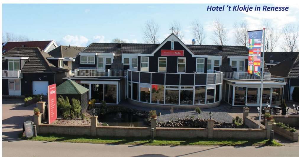
Hotel 't Klokje in Renesse

Luk en Ria Smets-Thys, 03 289 73 66, luk.smets@telenet.be