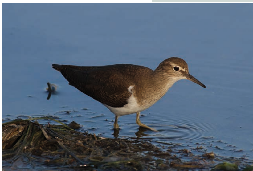
Oeverloper – Fons Van den heuvel

Meer info: 0476/39.19.94 of info@natuurpuntrupelstreek.be