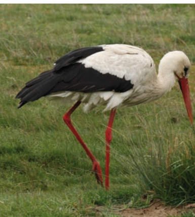
Ooievaar – Fons Van den heuvel