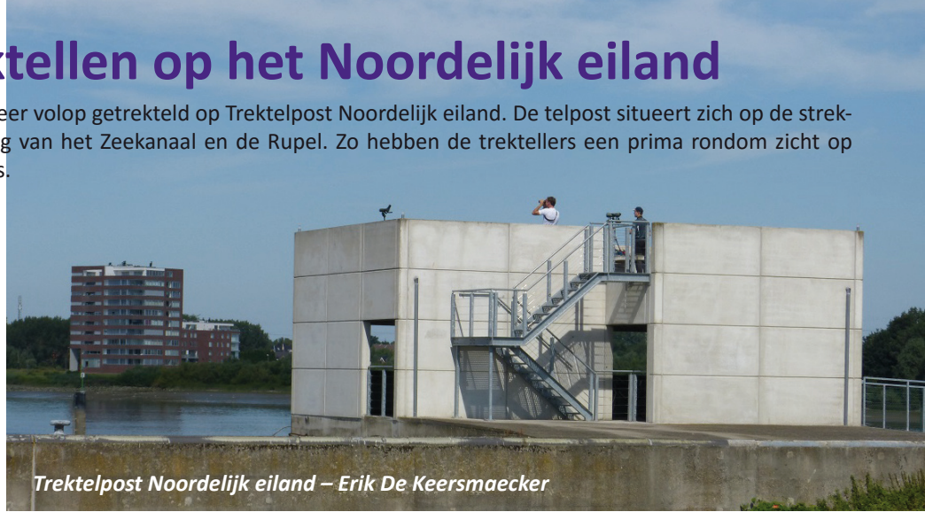
Trektpost Noordelijk eiland – Erik De Keersmaecker

April bracht kilte over het Noordelijk eiland samen met 3.813 vogels op 11 trektel-sessies van in totaal 43u30'. Tot max. 4 beflijsters scharrelden op 13/04 hun superfood naar binnen. Ook migreerden 147 boerenzwaluwen die dag noordwaarts. De eerste gier- en huiszwaluwen kliefdien op 16/04 langsheen de trekterruimte. 17/04 leverde fraaie soorten op met een visarend en een kwak, een groep van 13 zwarte sterns, 5 dwergmeeuwen, 2 zilverplevieren en een rosse grutto. Een rumoerige groep van 31 zwarte sterns koos ervoor om op 20/04 langsheen Wintam te snellen, die dag gevolgd door vier ooievaars en evenveel bruine kiekendieven. Een Noordse kwikstaart, die wat later doortrekt dan 'onze "gewone" gele kwik, zette zich op 28/04 even in het gras. Op 30/04 waren de steltlopers terug aan zet met 56