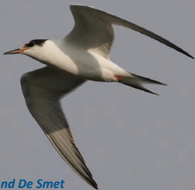
Juvenile visdief – Raymond De Smet