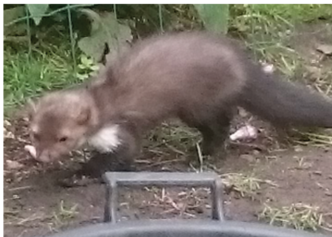
Steenmarter