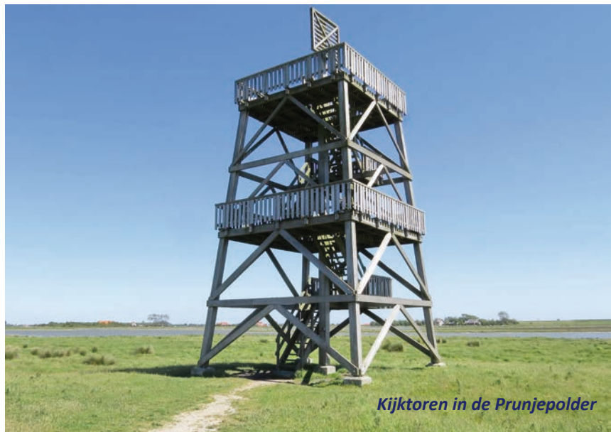
Kijktoren in de Prunjepolder

Vrijdag en zondag zullen we vooral wandelen. Zaterdag gaan we fietsen met eigen of gehuurde fiets. We verblijven in een prachtig hotel, 't Klokje in Renesse, waar we twee nachten vertoeven en ook tweemaal het avondmaal nuttigen. Leuk detail: in het hotel is een zwembad voor wie 's morgens of 's avonds een frisse duik wil nemen.