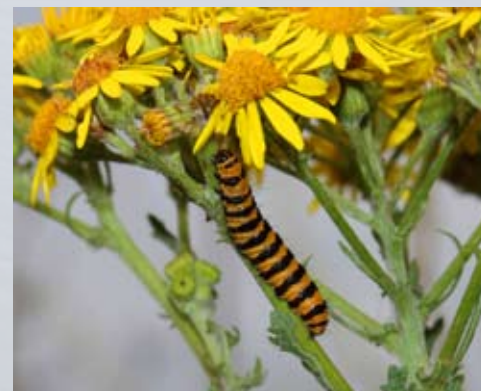
Rups St. Jacobsvlinder op Jacobskruiskruid Fons Van den heuvel

zo 25 september: WANDELING WOUWENDONKSE LOOP 13u30 parking CC della Faillelaan te Aartselaar