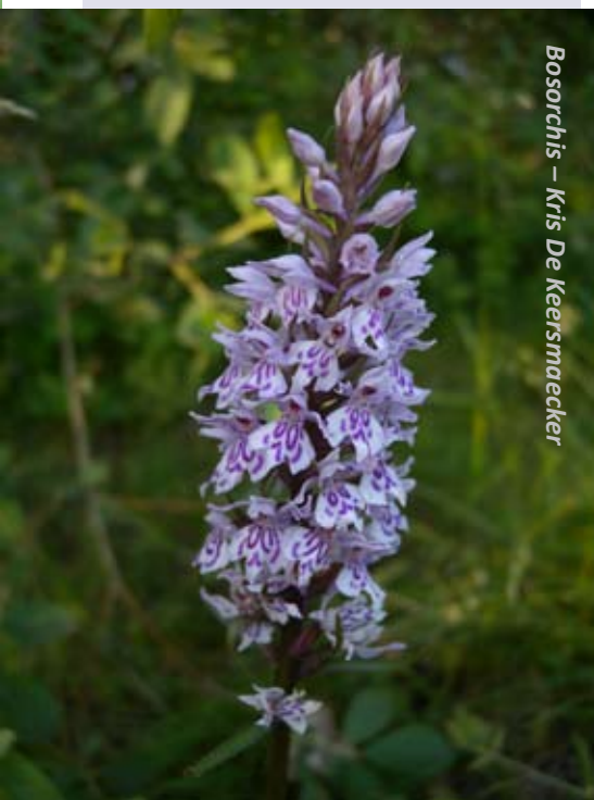
Bosorchis – Kris De Keersmaecker

Vooraf inschrijven: info@natuurpuntrupelstreek.be