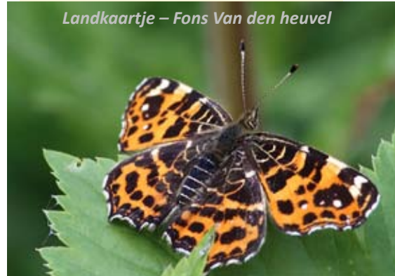
Landkaartje – Fons Van den heuvel

Inschrijven: 0473/91.65.09 of friedh@telenet.be