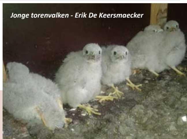
Jonge torenvalken - Erik De Keersmaecker

Het mooiste schouwspel kregen de leerlingen te zien in de Groene Hofstraat, met aanligende huiszwaluwen, volop bezig met de bouw van hun modernest en het verder dicht metsen van de invliegopeningen van de kunstnesten.