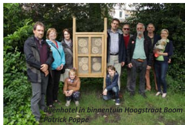
Bijenhotel in binnentuin Hoogstraat Boom Patrick Poppe