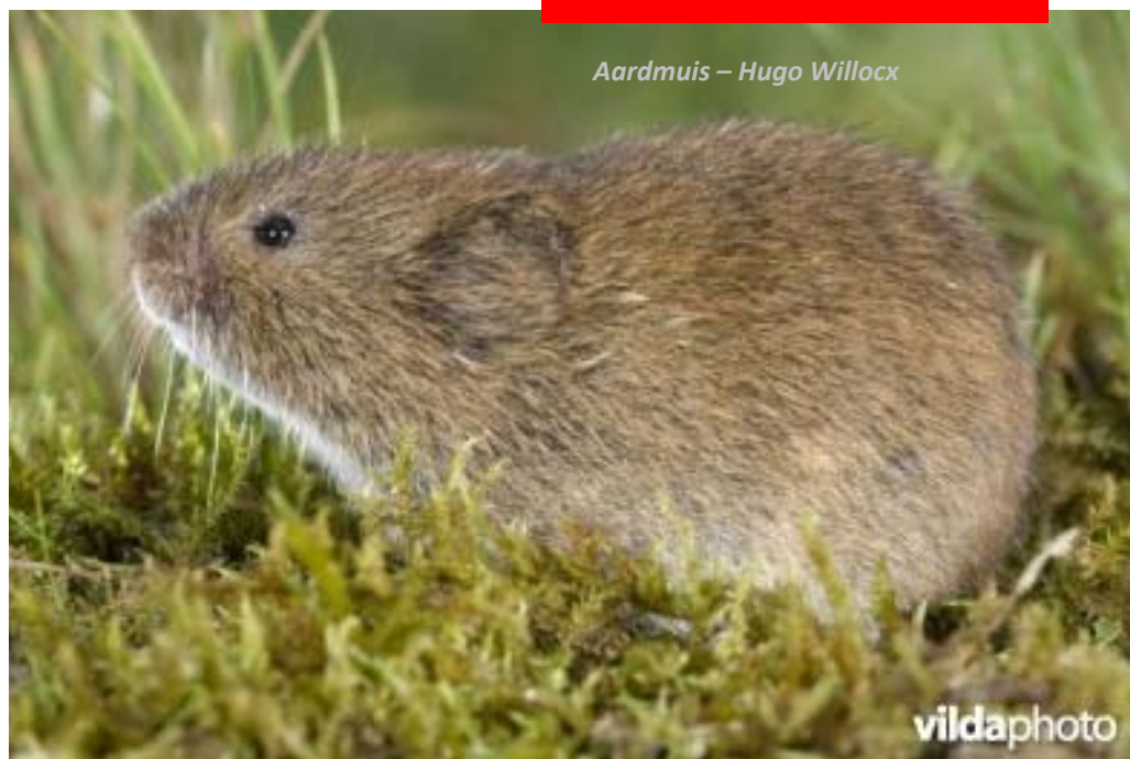
Aardmuis – Hugo Willocx

Tijdens deze wandeling maken we dankbaar gebruik van de veerboten die ons in een wip over de Rupel en 2 keer over de Schelde brengen. We starten met een wandeling omheen het vogelrijke Noordelijk eiland, in deze periode van het jaar kunnen we hier met een beetje geluk een 4-tal reigersoorten bekijken. Om dan via de Nattenhaasdonk naar de