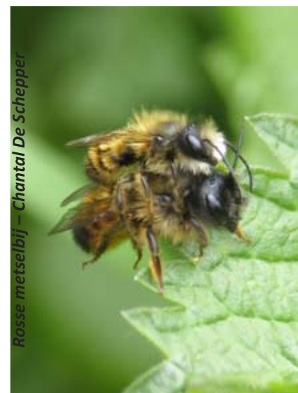
Rosse metselbij — Chantal De Schepper