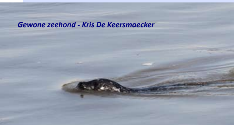
Gewone zeehond - Kris De Keersmaecker

Toch lijkt het om puur toeval te gaan en zijn de merkwaardige strandingen niet met elkaar in verband te brengen. Narwallen leven in de arctische zeeën rond Groenland, Rusland en Canada, terwijl gewone dolfijnen vooral in tropische en subtropische wateren voorkomen. Het onderzoek op de dode narwal door de Universiteit Gent bracht intussen al aan het licht dat het dier erg ondervoed was.