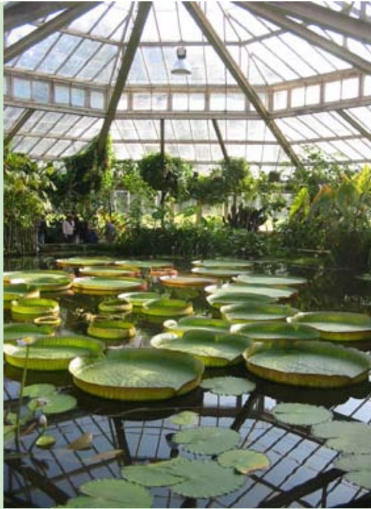
Er groeit iets in Meise

In het kasteel van Bouchout bekijken we de tijdelijke tentoonstelling: Achilles Cools en Brenine. Hun kunst vormt een symbiose tussen plant, dier en mens. In beelden, schilderijen en etsen brengen zij hun persoonlijke weergave van de wereld, van de natuur met zijn grote vormenrijkdom en raadsels.