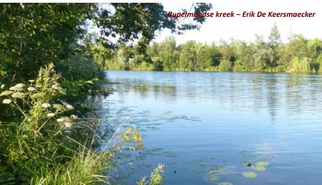
Rupelmondse kreek – Erik De Keersmaecker

8. Het park omheen de abdij wordt beheerd door het Agentschap Natuur en Bos. Je kan er kennismaken met perceeltjes grasland, ruigten, struwelen en de restanten van een oud parkbos. Af en toe kan je de doordringende roep van de bosuil horen en ook de kerkuil jaagt in deze omgeving. In de toren van de abdij werden nestkasten voor kerkuil en torenvalk geplaatst. De oude abdijmuur is bijna volledig begroeid met klimop, een laatbloeier die een belangrijke voedselbron voor vlinders is.