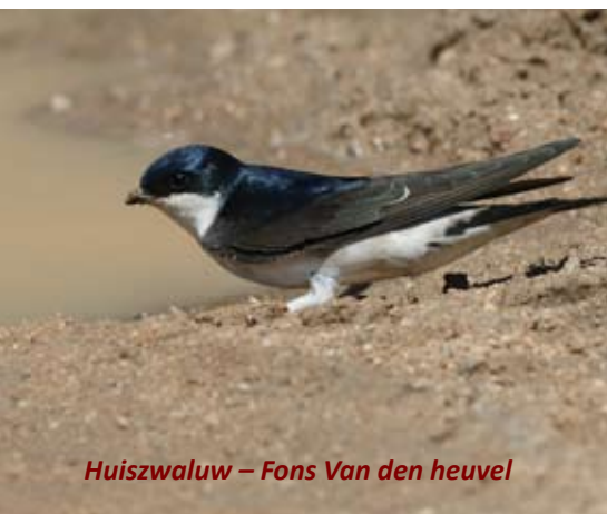
Huiszwaluw – Fons Van den heuvel

11. Aan de gebouwen van de oude elektriciteitscentrale woont een grote kolonie huiszwaluwen. Met ongeveer 50 broedpaartjes, een van de grootste kolonies van de streek. Vanaf begin april komen ze terug vanuit de overwinteringsgebieden in Afrika. Huiszwaluwen bouwen hun nesten onder de brede dakgoten en in de hoeken van de ramen. Na 3 weken verlaten de jongen het nest. Daarna starten de ouders met een tweede broedsel. Opvallend is dat de jongen van het eerste nest helpen bij het voederen van de jongen van het tweede nest.