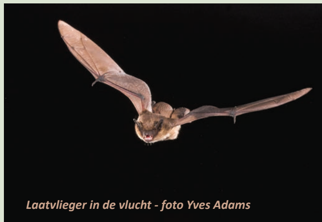
Laatvlieger in de vlucht

In de Nielse kerkzolder woont een kolonie laatvliegers. Met een vleugelspanwijdte van 35 cm één van onze grootste vleermuizen. De kolonie telt gemiddeld zo'n 70 diertjes en behoort daarmee tot de grootste kolonies van de provincie. Tijdens de lente- en zomermaanden verlaten de vleermuizen bij zonsondergang, dagelijks de kerkzolder voor hun nachtelijke jachtpartijen. 's Winters houden vleermuizen noodgedwongen een winterslaap. Bunkers, ijskelders en forten zijn hun favoriete overwinteringsplaatsen.