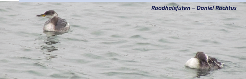
Roodhalsfuten – Daniel Rochtus

Roodhalsfuten hebben een verspreidingsgebied dat zich uitstrekt van West-Europa tot Oost-Azië. De grootste aantallen wonen wel in Oekraïne, Finland, Litouwen en Roemenië. In Vlaanderen en Nederland is de roodhalsfuut een zeer zeldzame broedvogel. In het nabije buitenland, zoals het Duitse Sleeswijk-Holstein en Mecklenburg-Vorpommeren, nemen de aantallen van de roodhalsfuut wel flink toe.