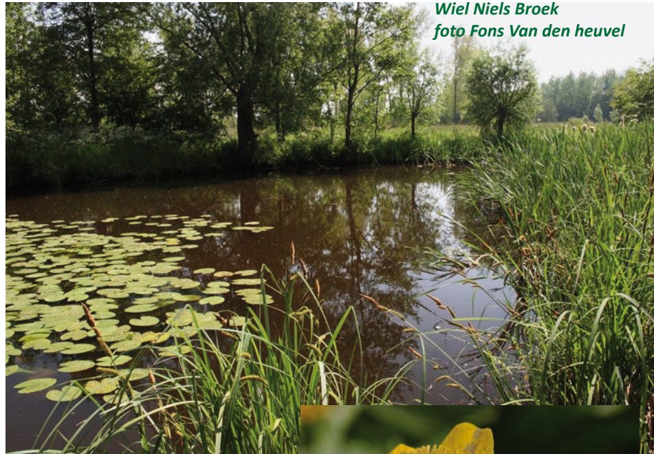
Wiel Niels Broek

4. Terugkeren richting de Korte Ameldijk en dan het wandelpad richting het broekbos volgen. De greppels in de graslanden zijn prima groeiplaatsen voor dotterbloemen. Het brugje over de brede sloot brengt je in het broekbos. Als je naar rechts kijkt, zie je een waterpartij, één van de historische wielen in het Niels Broek.