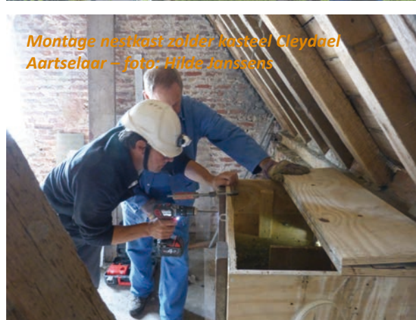
Montage nestkast zolder kasteel Cleydael Aartselaar