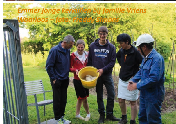
Emmer jonge kerkuilen bij familie Vriens Waarloos