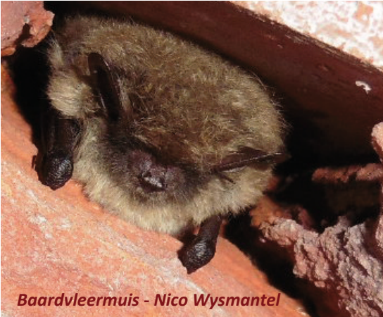
Baardvleermuis - Nico Wismantel