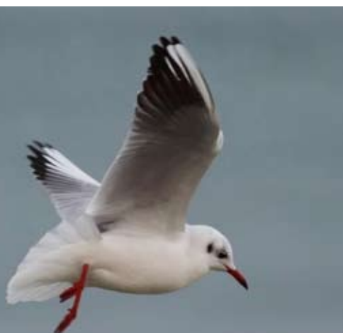
Kokmeeuw in winterkleed – Fons Van den heuvel

7. Grachten langs wegen en landwegeltjes hebben een belangrijke functie om regen- en bodemwater af te voeren naar een sloot of beek. Mits een aangepast beheer kunnen ze ook fungeren als lange