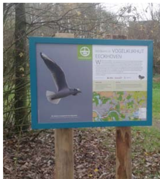
Nieuw infobord aan vogelkijkhut Eeckhoven Rumst