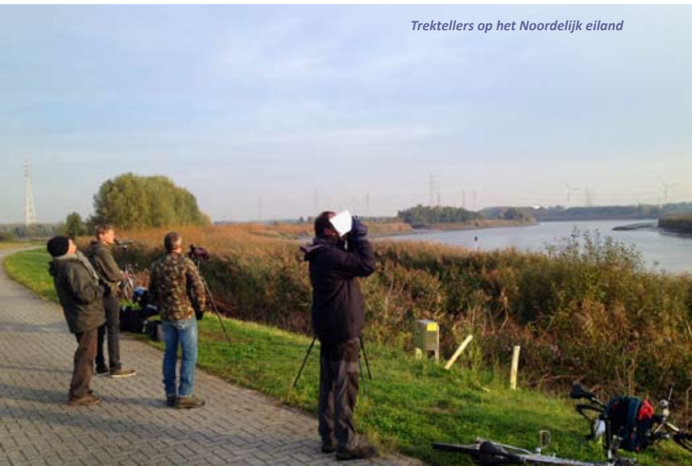
Trektellers op het Noordelijk eiland

Soms lijkt het als wachten op de komst van de Sint, met die nuance dat het spannender is, het twee maanden lang duurt en dubbele cadeaus niet moeten worden ingeruild, want meer is beter. Net als het voorgaande najaar vond het gros van de trektellingen plaats gedurende de tiende en de elfde maand.