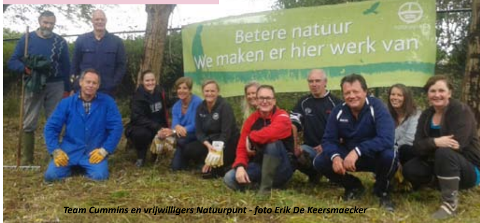
Team Cummins en vrijwilligers Natuurpunt