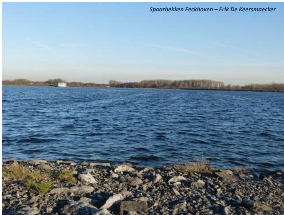
Spaarbekken Eeckhoven – Erik De Keersmaecker

Het Lazaruspad start aan de mooi gerestaureerde Lazaruskapel. Onderweg staan mooie infoborden, met info over de land- en tuinbouwbedrijven in de wijken Vosberg en Lazernij. In de wandelbrochure is er ook aandacht voor de fauna en flora langs de wandelroute, met teksten en foto's aangeleverd door Natuurpunt Rupelstreek.