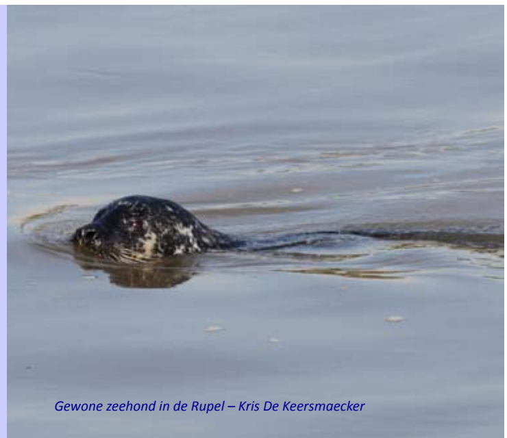
Gewone zeehond in de Rupel – Kris De Keersmaecker

Het leefgebied van de gewone zeehond situeert zich voornamelijk in de Waddenzee en in het Deltagebied (Ooster- en Westerschelde). Voor de Belgische kust worden ook regelmatig gewone zeehonden waargenomen. De dieren die in de Rupel en de Schelde worden waargenomen zijn afkomstig van de populatie in de Westerschelde. De dieren zwemmen met het getij mee en kunnen op die manier op korte tijd grote afstanden afleggen. Voedsel is ook geen probleem, door de betere waterkwaliteit is er meer vis in de rivieren aanwezig. Het aantal zeehonden in de Westerschelde is de afgelopen jaren flink gestegen. Dat blijkt uit tellingen van Stichting A Seal in samenwerking met de Schorrenwerkgroep Galgenschuur – Groot Buitenschuur van Natuurpunt. Uit die tellingen blijkt dat sinds 2010 het aantal getelde zeehonden bijna verdubbeld is van 80 naar 156 dieren in 2014.