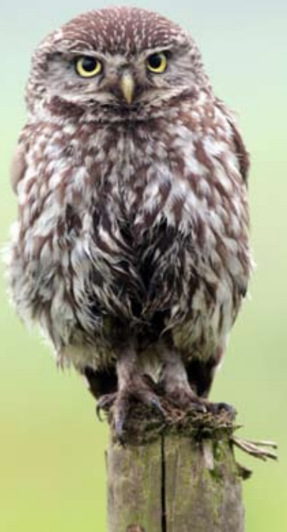
Tekst Luk Smets

In het vorige nummer van Rupel.blad gaven we reeds een eerste indruk van de resultaten van ons steenuilenonderzoek. Nu is het volledig verslag gepubliceerd op onze website.