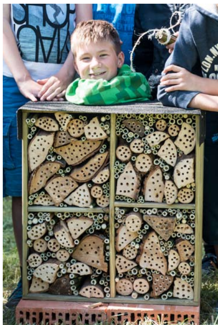
Het afgewerkt hotel