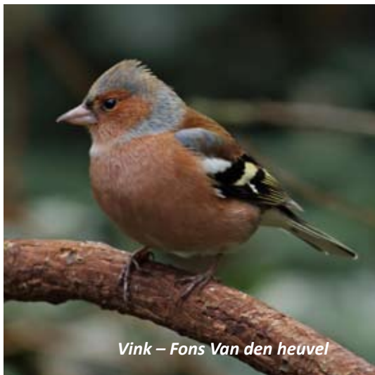
Vink – Fons Van den heuvel

voor kerkuil gebouwd, sindsdien is deze prachtige nachtroofvogel er een vaste bewoner. Een brugje over de Boom/Nielse Scheibek vormt de grens tussen beide gemeenten. Rechts van het brugje loopt de beek over in een spaarbekken, nu een kleine natuuroase. Let hier op de zang van de vink, met achteraan het liedje suskewiet .