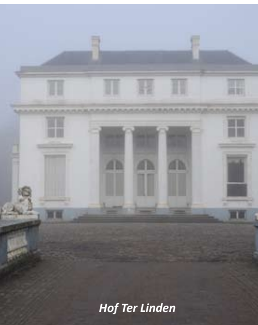
Hof Ter Linden

Gids en info: Martine Herygers 03/288 56 45 of 0491/95 06 20 martine.herygers@hotmail.com