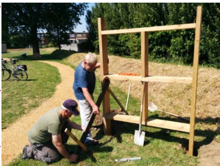
opbouw van het bijenhotel aan WZC Zonnetij