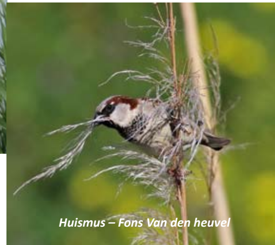
Huismus – Fons Van den heuvel