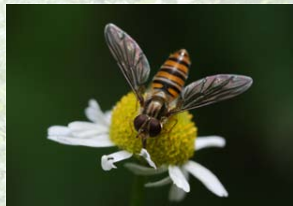
Foto: pyamazweefvlieg op kamille Heb je zelf een mooi verhaal en mooie foto? Zend het naar: info@natuurpuntrupelstreek.be

Of het nu over wilde planten of tuinplanten gaat, als ze aan kruisbestuiving doen is de wind niet altijd voldoende om stuifmeel en stamper van verschillende exemplaren van een soort bij mekaar te brengen. Bijen zijn daarom zo belangrijk, maar ook andere insecten die bloemen en bloesems bezoeken. Zweefvliegen bijvoorbeeld, totaal ongevaarlijke beestjes, die in alle tuinen rondzoemen. In deze familie, waarvan er officieel 341 soorten in België voorkomen, zijn een groot aantal vleeseters, niet als volwassen dier, maar wel als larve. En hun belangrijkste prooien zijn dan bladluizen. Kolonies van deze beestjes kunnen en ware ravage aanrichten onder de planten. Maar de larven van sommige zweefvliegen, waaronder de pyamazweefvlieg, kunnen wel enkele honderden bladluizen verorberen in enkele weken tijd. En nadat ze zich vervolgens enige tijd verborgen hebben gehouden als pop, komen ze als volwassen dier opnieuw de planten ter hulp. Omdat ze nu pollen en nectar eten krijgen ze ook heel wat stuifmeel op hun lichaam, net als bijtjes en hommels. En bij hun bezoek aan volgende bloemen en bloesems laten ze een deel hiervan weer achter, en kunnen deze planten voor nakomelingen zorgen. Eerst lijfwacht en dan relatiebemiddelaar, en dat in één beestje, meer moet dat niet zijn zeker?