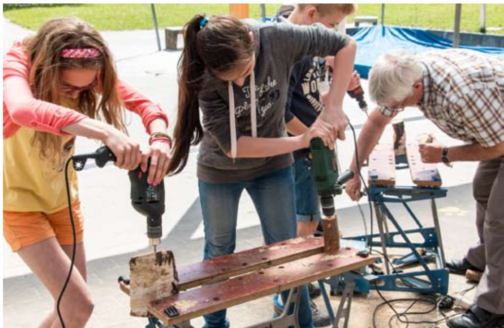
Leerlingen aan de slag met boor en zaag

Natuurpunt Aartselaar heeft haar steentje bijgedragen. Op 12 mei werd er met achtereenvolgens 2 vijfde klassen en 2 zesde klassen een bijenhotel gebouwd: zagen, boren, knutselen dat het een lieve lust was. Elk kind kreeg van Natuurpunt een zakje bloemenzaad mee naar huis om een bijenvriendelijk bloemperkje aan te leggen. En de kinderen knutselden een klein bijenhotelletje om eveneens mee naar huis te nemen.