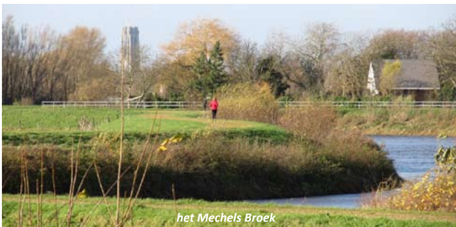
het Mechels Broek