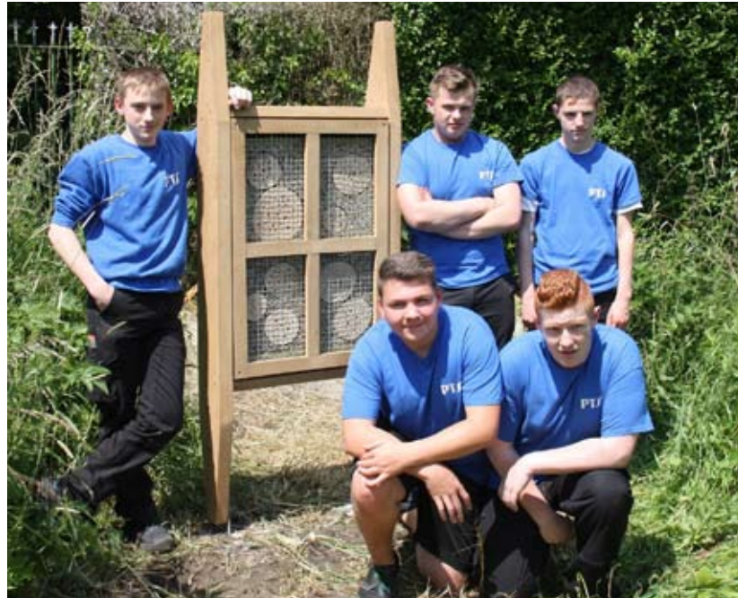
Leerlingen klas 3TH bij bijenhôtel oude vloei-beemd Oude Nete-arm Rumst