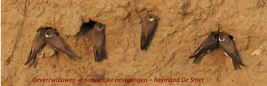
Oeverzwaluwen in natuurlijke nestgangen – Raymond De Smet

maal tot eind augustus onaangeroerd zou blijven liggen, zodat de zwaluwen rustig hun kroost konden grootbrengen, vooral eer ze terug naar Afrika vertrokken.