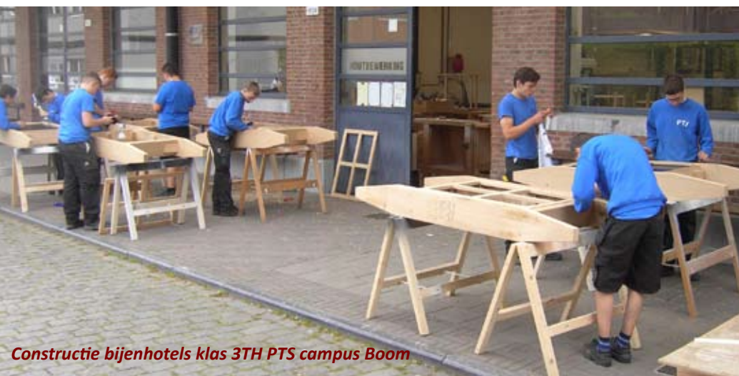
Constructie bijenhôtels klas 3TH PTS campus Boom

In de loop van de komende weken, werken we verder aan het opvullen van de houten bakken, en het voorbereiden van het plaatsen van de 3 andere bijenhôtels. Die zullen geplaatst worden in de omgeving van het Eetcafé 't Steencaycken in Boom, aan Natuur.huis de Paardenstal in Niel en langs de Broeklei, eveneens in Niel. Bij elk bijenhôtel wordt ook nog een infobord geplaatst.