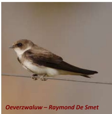
Oeverzwaluw – Raymond De Smet

Zanddepots of tijdelijke hopen aarde kunnen eveneens gekoloniseerd worden door oeverzwaluwen. Dat gebeurde in 2014 toen enkele aandachtige vogelkijkers hadden opgemerkt dat er regelmatig oeverzwaluwen rondvlogen boven de site van het bedrijf Rumst Recycling aan de Steenberghehoekstraat in Rumst. Via de gemeente werd door Natuurpunt contact opgenomen met het bedrijf, dat resulteerde in een bedrijfsbezoek. Daarbij werd de broedlocatie ontdekt in een hoge zandstock, met een 30-tal nestgangen. Met het bedrijf werd toen de afspraak gemaakt, dat de zandhoop mini-