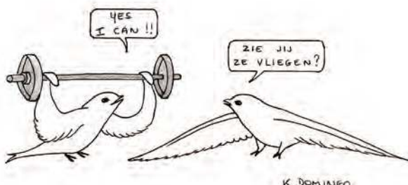
Gierzwaluw : Luc Meert