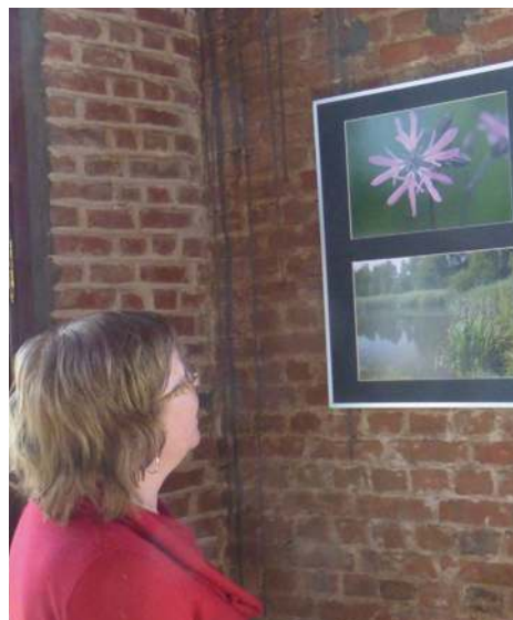
Fototentoonstelling Natuur rondom de Rupel

Eetcafé 't Steencycken, Hoek 76 Boom, tijdens de openingsuren (dinsdag gesloten).