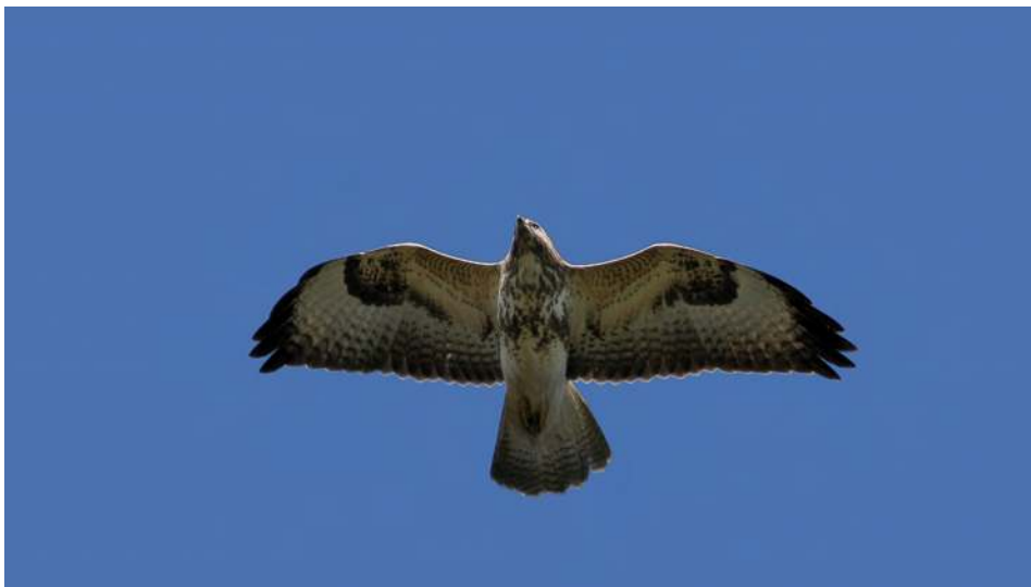
Buizerd - Raymond De Smet