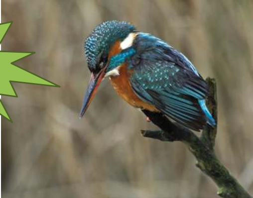
Ijsvogel - Fons Van den heuvel

met een lange gebogen snavel en een jodelende zang.