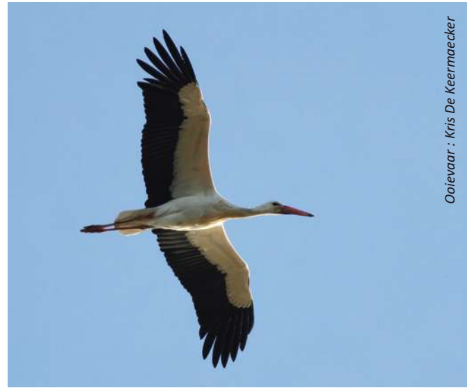
Ooievaar : Kris De Keermaecker

Buizerds stelden ronduit teleur met maximum 64 stuks op 12/10. Een memorabele roofvogeldag is helaas allerminst een jaarlijkse certitude. Voor buidelmees was het een erg goed seizoen met 24 waargenomen vogels op trek, waaronder een groep van maar liefst 8 vogels. De houtduif had ditmaal wat vriendjes meegenomen, wat resulteerde in 2 nieuwe dagrecords, nl. 6.161 op 26/10 en 7.249 op 09/11. Andere, schaarsere vogels waren een zwarte ibis (31/10), een lading goudplevieren, enkele geelgorzen en beflijsters, redelijke aantallen boom-