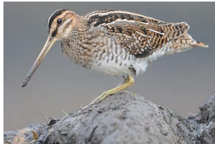
Watersnip - Hugo Willocx