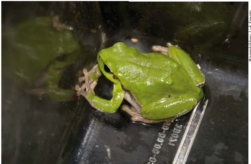
Boomkikker: Luk Smets