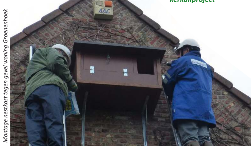
Montage nestkast tegen gevel woning Groenenhoek