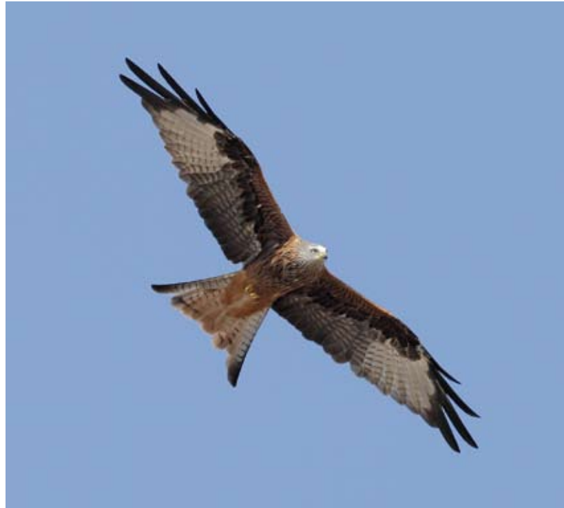
Tekst: Erik De Keersmaecker

De vogels live ontmoeten kan tijdens een bustocht naar de Oostkantons. Daar zullen vooral de prachtige rode wouwen de aandacht trekken. Voor iedere natuurliefhebber is het een waar genot om naar deze vogels te kijken, Dankzij de diep gevorkte staart zijn ze bijzonder wendbaar. Hun vliegtechniek is totaal anders dan van buizerd, eveneens een algemene broedvogel in de Oostkantons. Buizerden gaan hoog in de lucht cirkels draaien, en speuren daarbij naar het landschap onder hun. Rode wouwen gaan wiekend en draaiend op zoek naar een prooi, tijdens de broedperiode zijn dat niet zelden jonge kramsvogels, die door de wouwen uit de nesten worden geplukt.