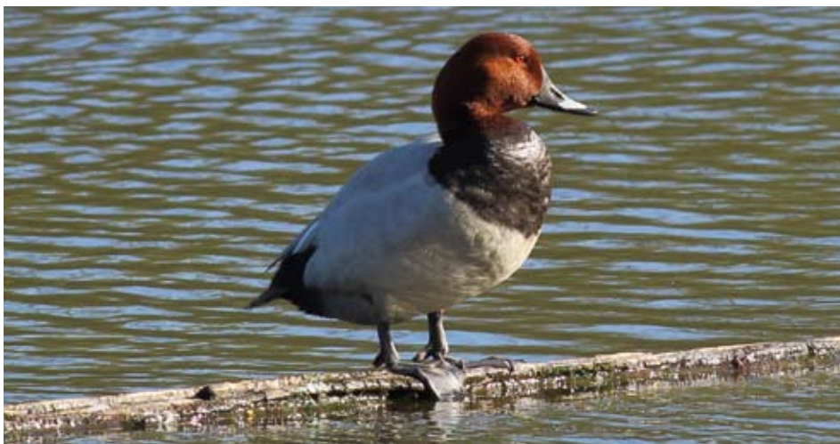
Tafeleend - Fons Van den heuvel

Breng een warme jas mee voor de rondleiding in de oude klampoven!