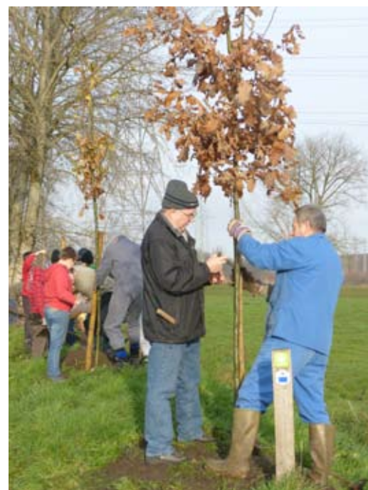
Tekst en foto: Erik De Keersmaecker

ze behoren tot ons natuurlijk erfgoed en bevorderen de lokale soortenrijkdom. Meer dan andere boomsoorten hebben zomereiken echter, na het aanplanten voldoende vocht in de bodem nodig om nieuwe wortels te maken. De voorbije lente, met 5 opeenvolgende weken zonder regen, was de oorzaak dat de 35 jonge zomereiken volledig zijn uitgedroogd en uiteindelijk allemaal zijn afgestorven. Opgeven staat niet in ons woordenboekje en dinsdag 9 december gingen we opnieuw aan de slag in de Broeklei, opnieuw met de hulp van onze partners van vorig jaar: Regionaal Landschap Rivierland en leerlingen van School Groenlaar uit Niel, en gewapend met vele spaden, grondboren en boompalen. De bomen werden dit keer wel met een zware kluitwortel aangeplant, en niet met blote wortel, zoals vorig jaar. De kans op overleven tijdens de komende lente en zomer wordt daarmee veel groter, zelfs tijdens een periode van langdurige droogte.