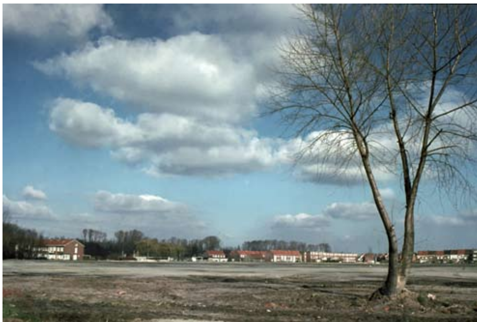
Put N vlak na de opvulling