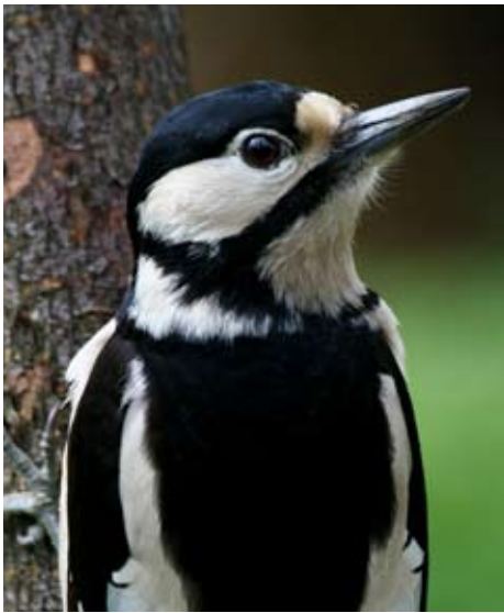
Grote bonte specht - Fons Van den heuvel