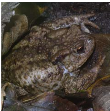
Gewone pad - Fons Van den heuvel