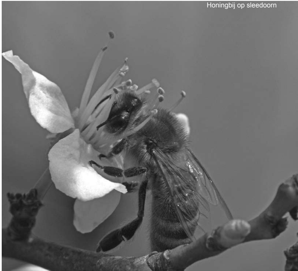
Honingbij op sleedoorn

Tijdens het overleg in de werkgroep werden afspraken gemaakt over het aanbod, de samenstelling van de pakketten, de prijzen en de keuze van de