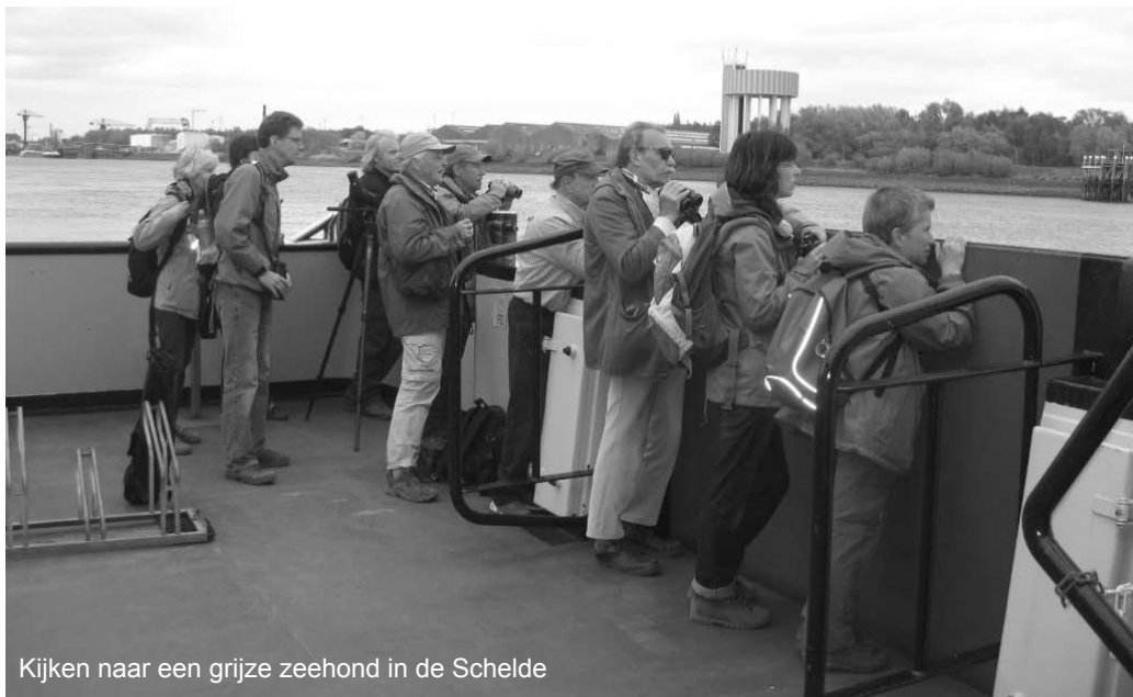
Kijken naar een grijze zeehond in de Schelde

In totaal werden in het toekomstig overstromingsgebied 70 verschillende vogelsoorten geteld. Na een gezamenlijk avondmaal trok de groep naar het Blaasveld Broek voor een avondexcursie. Om 21u45 werd deze excursie afgesloten, voor het Blaasveld Broek stond de teller dan