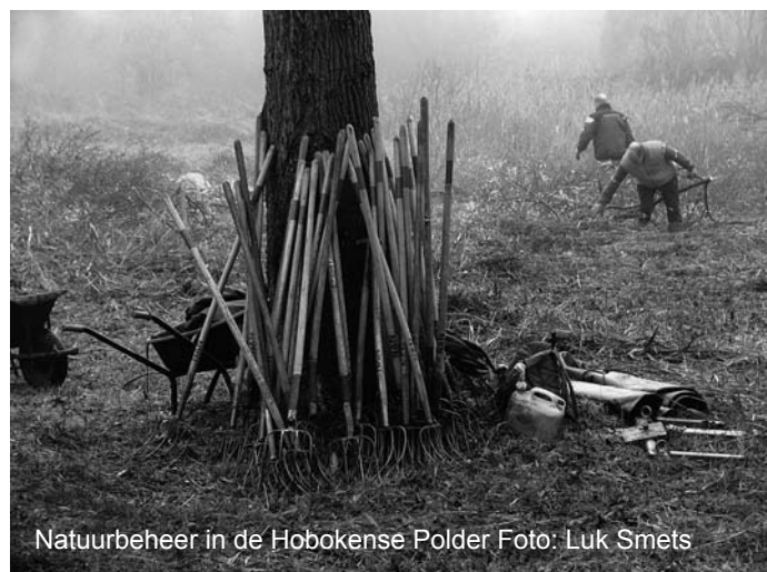
Natuurbeheer in de Hobokense Polder