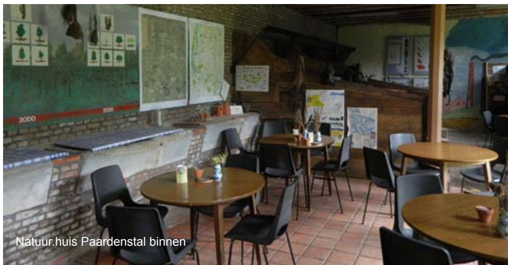
Natuur.huis Paardenstal binnen

Een stevig hek en afsluiting vormen de grens met de percelen van het ANB. Hier grazen Galloway-runderen, de kans dat je er één ontmoet is eerder klein. Als je er toch een zou ontmoeten, wacht dan even tot de dieren het pad verlaten, doe ze niet schrikken en geef ze zeker niets te eten.