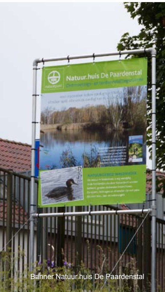
Banner Natuur.huis De Paardenstal

Het grootste deel van Walenhoek is eigendom van het Vlaams gewest en wordt beheerd door het Agentschap voor Natuur en Bos (ANB). In het ruim 30 ha grote boscomplex loopt een begrazingsproject met Gallowayrunderen. In het zuiden van