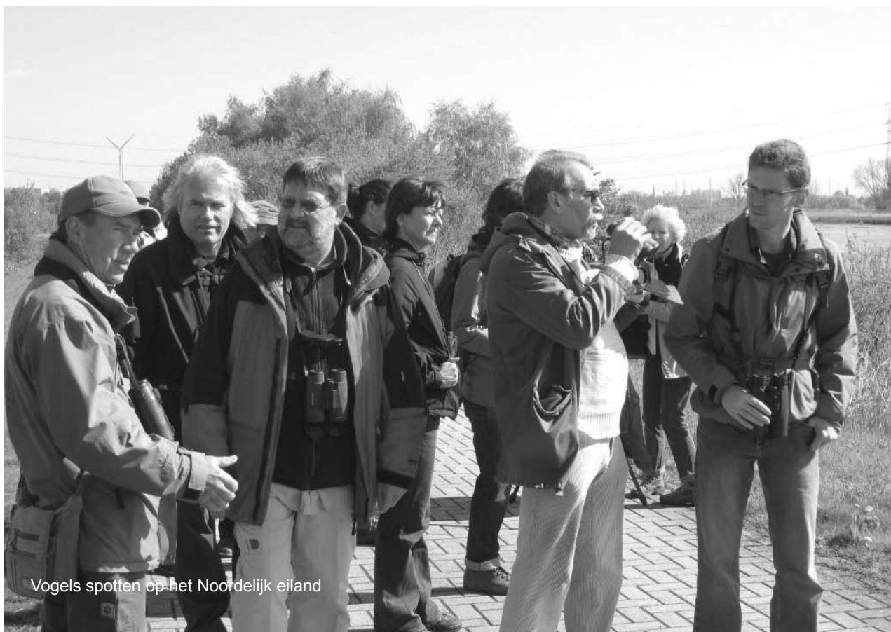
Vogels spotten op het Noordelijk eiland

Tekst: Erik De Keersmaecker