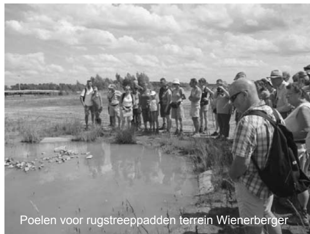
Poelen voor rugstreeppadden terrein Wienerberger