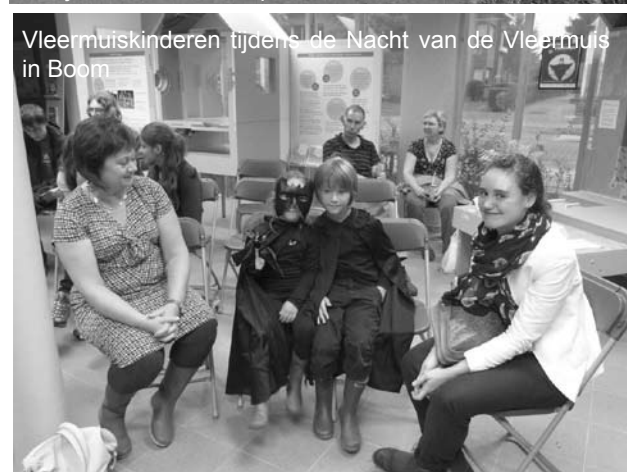
Vleermuis kinderen tijdens de Nacht van de Vleermuis in Boom

De intense promotiecampagne op de radio, televisie, in kranten en 6000 flyers in Boomse brievenbussen, rondgedragen door 13 Natuurpunt-vrijwilligers hadden hun effect duidelijk niet gemist. De vleermuizen waren eveneens op de afspraak. Talrijk waren de dwergvleermuizen, die vlogen ons soms bijna om de oren en ook de watervleermuizen waren present. Samengevat, een meer dan geslaagde Nacht van de Vleermuis in Boom. Stip nu reeds zaterdagavond 30 augustus 2014 in je agenda aan, voor de volgende Nacht van de Vleermuis!