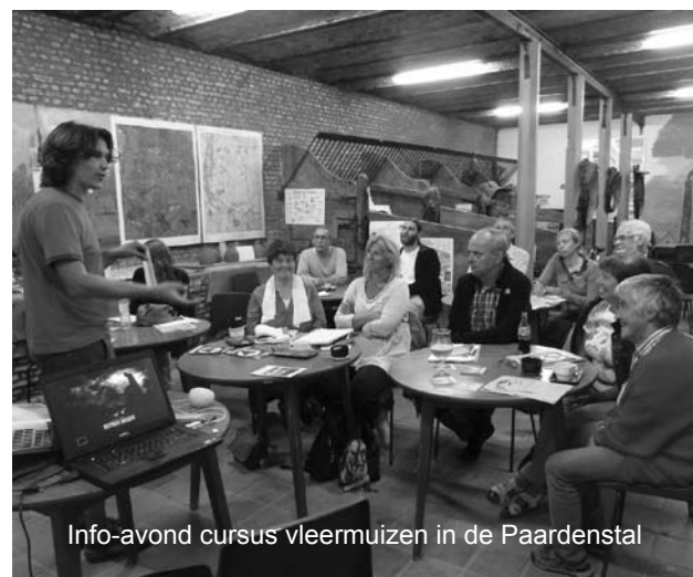
Info-avond cursus vleermuizen in de Paardenstal

Blijkt dat ook het hof ten Eiken een toplocatie is voor vleermuizen. Dwergvleermuizen, waaronder ook ruige dwergvleermuizen, watervleermuizen, laatvliegers en mogelijk ook baardvleermuizen en franjestaarten konden we in een lichtstraal vangen.