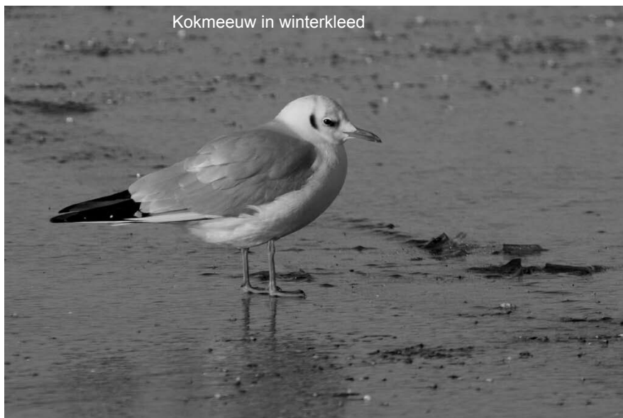
Kokmeeuw in winterkleed

Meld vooraf je deelname: 03/887.13.72 of natuur.rupel@skynet.be