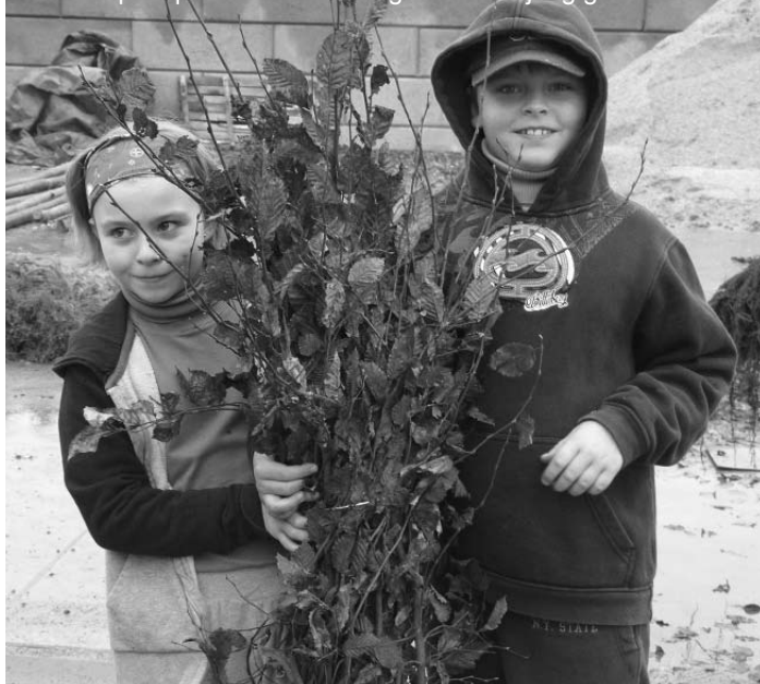
Afhalen plantpakketten in Terhagen 2012 – jong geleerd...

Let op: Bedeling pakketten in Schelle op vrijdag 29 november.