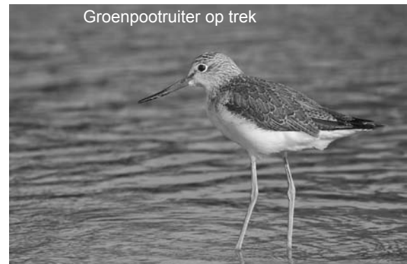
Groenpootruiter op trek