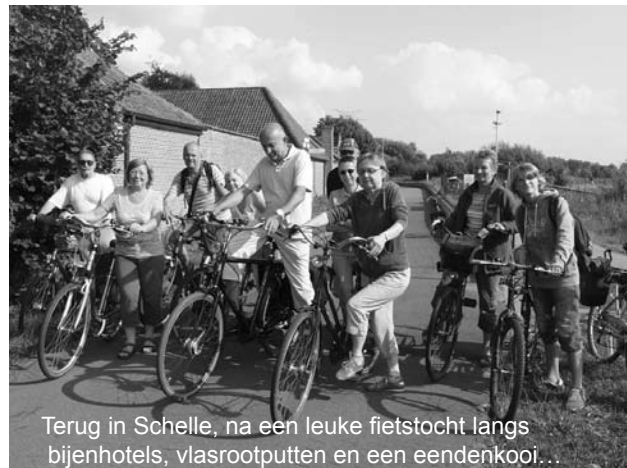
Terug in Schelle, na een leuke fietstocht langs bijenhôtels, vlasrootputten en een eendenkooi...

Prima fietsweer op woensdag 14 augustus voor 11 fietsers die deelnamen aan een aangename fietstocht door het prachtige landgoed van het Graafschap, langs de oevers van de Oude Schelde en de Schelde. Langs bijenhôtels, vlasrootputten en een bezoek aan de eeuwenoude eendenkooi in het Graafschap. En stops aan de Steenovens en de Cuyteghemhoeve in Sint-Amands, een herstelde vlasrootput in Oppuurs en de Sint-Pietersburcht in Puurs.