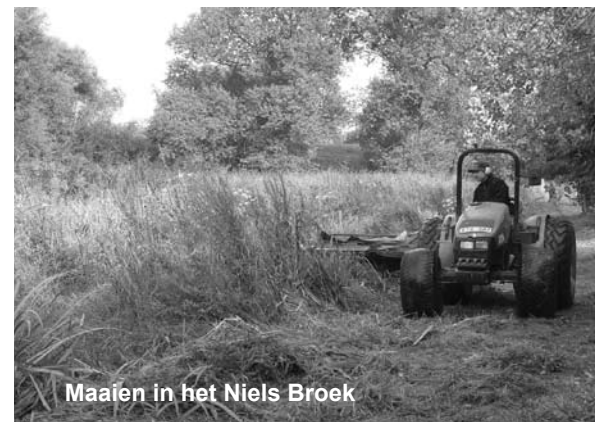
Maaien in het Niels Broek