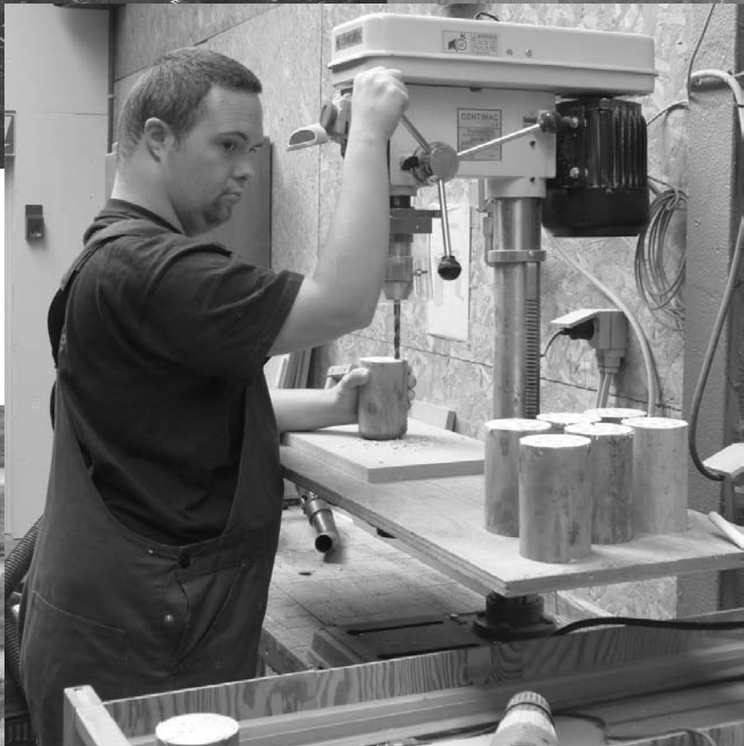
Bijenhotelletje – fabricage bijenhotelletjes in Den Atelier