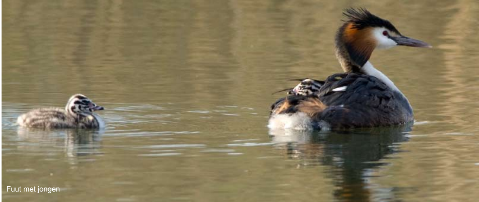
Fuut met jongen