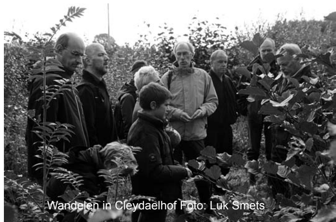
Wandelen in Cleydaelhof

Inschrijven: door betaling van het cursusgeld op rekening BE88 9799 7675 4841 van Natuurpunt Aartselaar met vermelding "Natuur voor groentjes": 30 euro voor Natuurpuntleden en 40 euro voor niet-leden. Beslis je tijdens de cursus lid te worden, dan krijg je 10 euro korting op je lidmaatschap: we mikken immers op mensen die zich voor onze vereniging willen engageren !