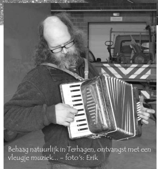
Behaag natuurlijk in Terhagen, ontvangst met een vleugje muziek...

In Aartselaar is de bedelingsdag van het plantgoed steeds een fijne happening, waarbij niet alleen het verzorgde plantgoed aan de man/vrouw wordt