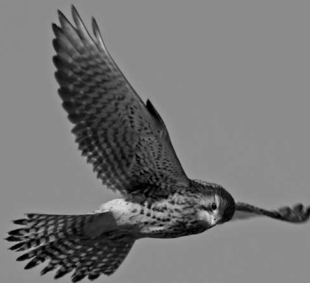
Biddende torenvalk