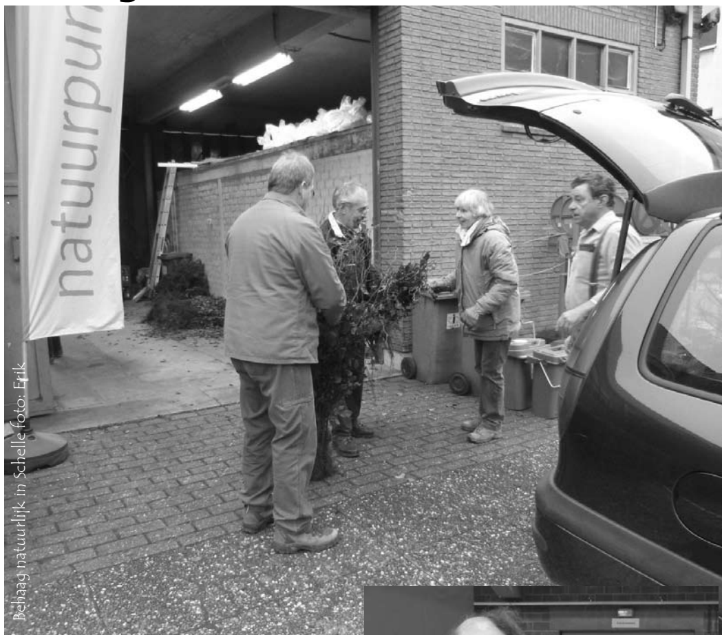
Behaag natuurlijk in Schelle

In Hemiksem waren het vrijwilligers van de milieuraad die voor het samenstellen van de pakketten zorgde. In Boom en Niel werd deze klus geklaard door gemeentepersoneel. Doorgaans komen de kopers met een gewone personenwagen voor het ophalen van het plantgoed, soms aangevuld met een aanhangwagen.