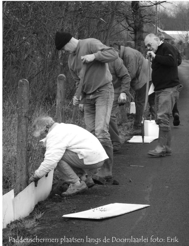
Paddenschermen plaatsen langs de Doornlaarlei

In totaal konden in 2012 157.669 amfibieën worden gered. Tussen 2000 en 2012 werden maar liefst 1.472.275 amfibieën door vrijwilligers veilig de weg overgeholpen.