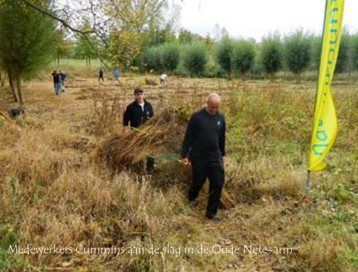
Medewerkers Cummins aan de slag in de Oude Nete-arm