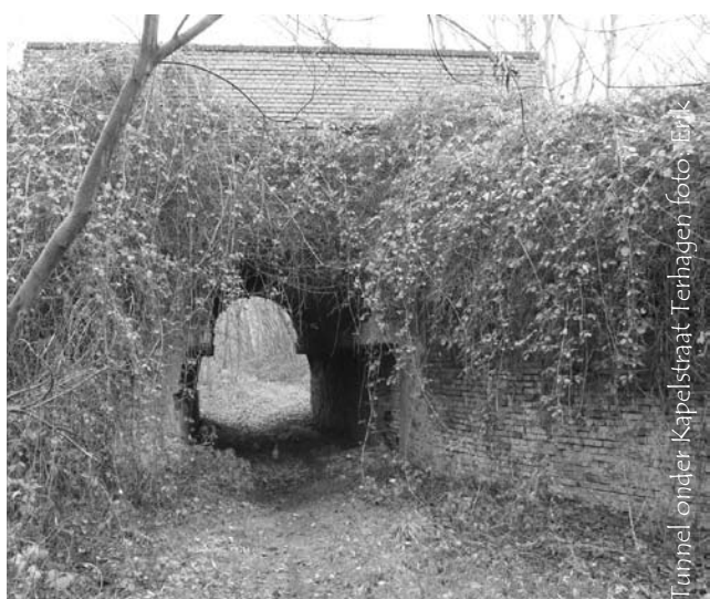
Tunnel onder Kapelstraat Terhagen

Net zoals in België is de bever immers ook in Nederland aan een succesverhaal bezig, met als logisch gevolg dat in Nederland 2012 tot het Jaar van de