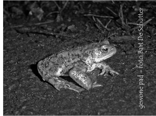
gewone pad