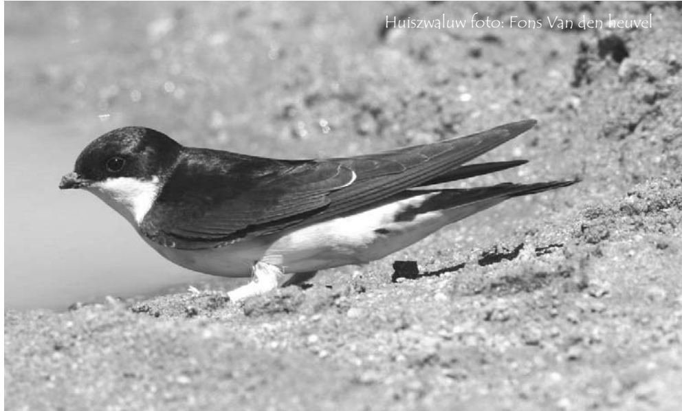
Huiszwaluw