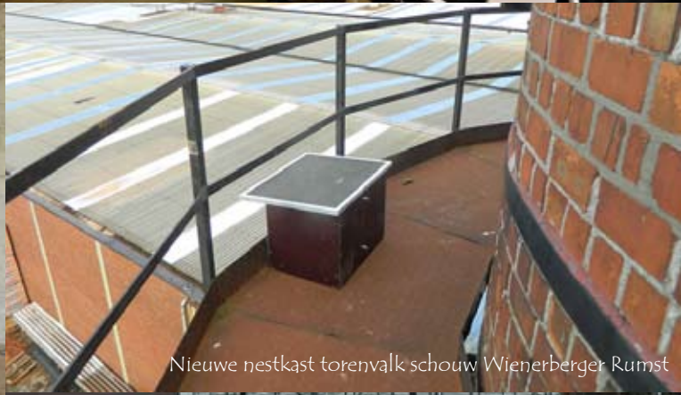
Nieuwe nestkast torenvalk schouw Wienerberger Rumst