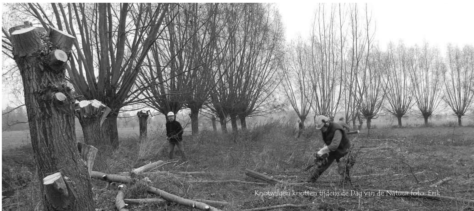
Knotwilgen knotten tijdens de Dag van de Natuur

Door het Regionaal Landschap Rivierenland, werd in samenwerking met de gemeentebesturen zaadoogsten georganiseerd van oorspronkelijk inheemse struiken en bomen. Verschillende boomkwekers die deelnemen aan deze actie hebben dit zaad tot mooi plantgoed opgekweekt. In de actie van dit jaar waren haagbeuk, rode kornoelje, zomereik, meidoorn, Gelderse roos, kardinaalsmuts, hondsroos, sporkenhout, lijsterbes, zwarte els en sleedoorn met het kwaliteitslabel "Plant van hier".