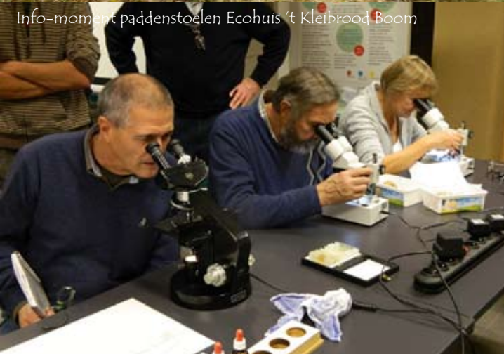
Info-moment paddenstoelen Ecohuis 't Kleibrood Boom