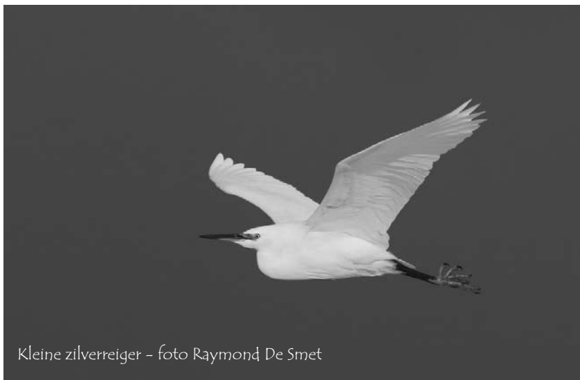
Kleine zilverreiger – foto Raymond De Smet

De cursus wordt afgesloten met een daguitstap naar vogelrijke gebieden op de Antwerpse linkeroever en een gezamenlijk avondmaal in 't Steencaycken in Boom.