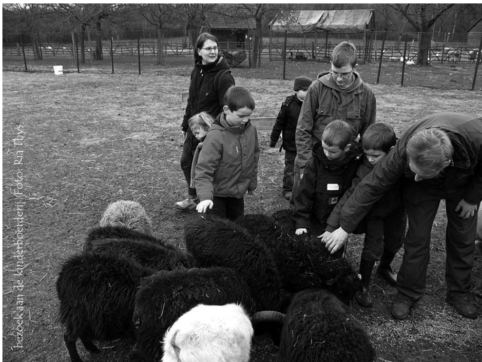
bezoek aan de kinderboerderij.

Zin om mee te gaan? Kinderen vanaf 4 jaar met hun grootouders of ouders mogen mee.