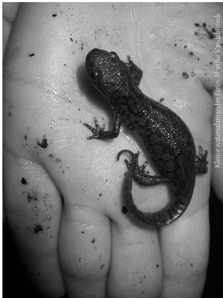
Kleine watersalamander

Cursusverantwoordelijke: Ria Thys, 03/289 73 66 - ria.thys@telenet.be