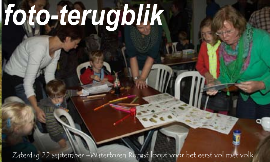
Zaterdag 22 september - Watertoren Rumst loopt voor het eerst vol met volk