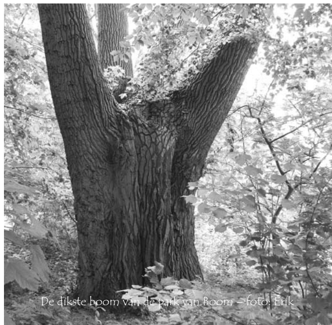
De dikste boom van de park van Boom

03/887.51.69 of roovers_wachters@hotmail.com