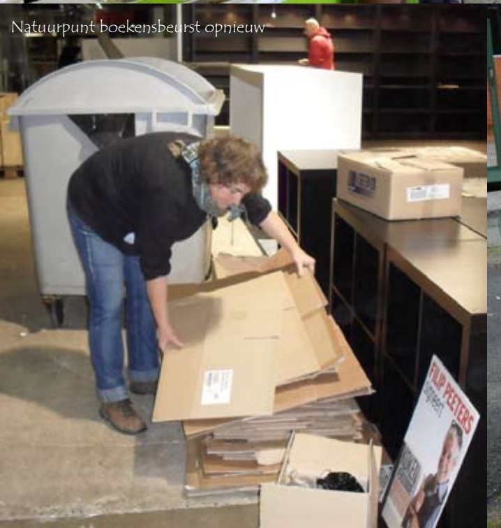
Natuurpunt boekensbeurs opnieuw