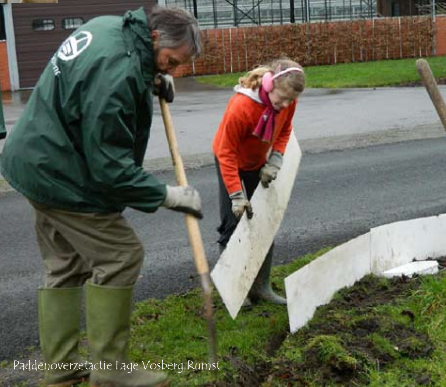
Paddenoverzetactie Lage Vosberg Rumst