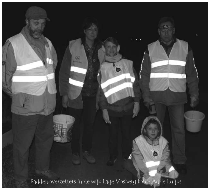
Paddenoverzetters in de wijk Lage Vosberg

Wat ik niet echt voor mogelijk had gehouden, is toch gebeurd: met de regenval van gisteravond, is een fikse achterhoede gisteren alsnog aan de heentrek begonnen. Van op een aantal plaatsen kwamen meldingen binnen van hoge aantallen (tot 1500 padden per locatie). Aangezien op de meeste plekken de schermen al enkele dagen werden verwijderd, heeft dit tot redelijk wat verkeersslachtoffers geleid.