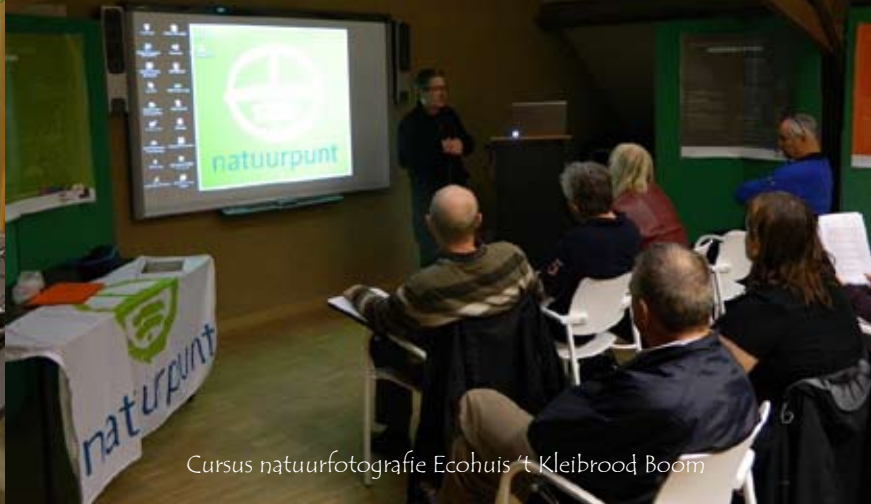
Cursus natuurfotografie Ecohuis 't Kleibrood Boom