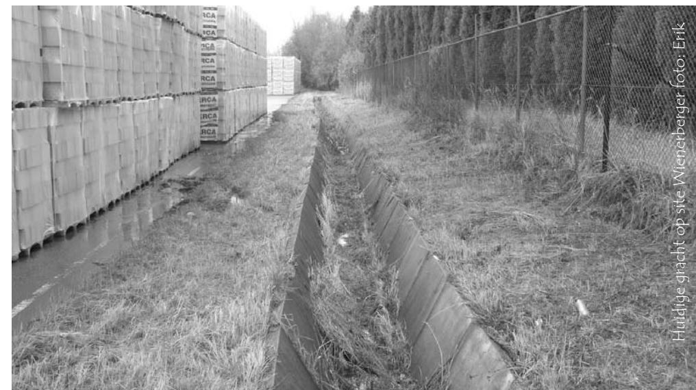
Huidige gracht op site Wienerberger

Bevers zijn vooral 's nachts en in de schemering actief. Overdag brengen bevers de tijd voornamelijk slapend door in legers, in holen of in burchten. Ze leven solitair of in een kleine familie. Een familie bestaat gemiddeld uit 4 tot 5 dieren, maar kan ook uit 8 tot