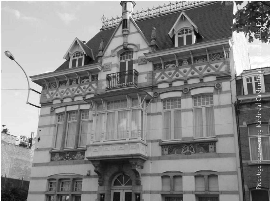
Prachtige herenwoning Kardinaal Cardijnstraat Terhagen, foto: Erik

Inschrijven: Stort 14 euro: inbegrepen onkosten gids Scheldelanders en middagmaal (koninginnenhapje, stoofvlees of goulash, allen met fritten) of 17,50 euro (sla met garnalen) op rekening 001-3598649-25 van Natuurpunt Rupelstreek, met vermelding: Dagje Terhagen, je voorkeurgerecht - het aantal personen, je telefoonnummer en eventueel email.