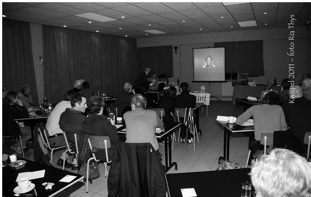
Kwispel 2011

of Ria Thys, 03/289 73 66 - ria.thys@telenet.be