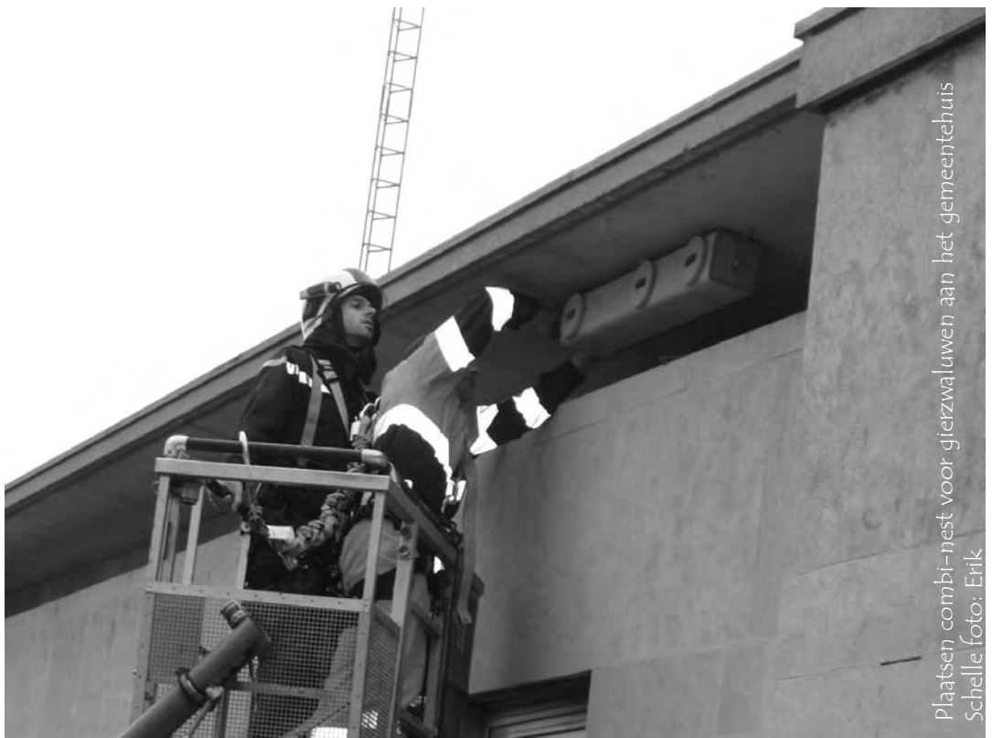
Plaatsen combi-nest voor gierzwaluwen aan het gemeentehuis Schelle foto: Erik