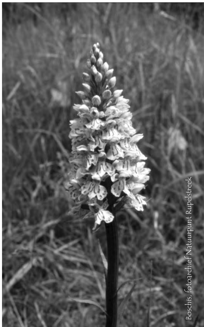
Boschis, fotoarchief Natuurpunt Rupelstreek

Het juiste bedrag met vermelding van "Cursus orchideeën" en naam en tel. nr. en/of mail dient gestort te worden op rekening 979-9767548-41 van Natuurpunt Aartselaar.