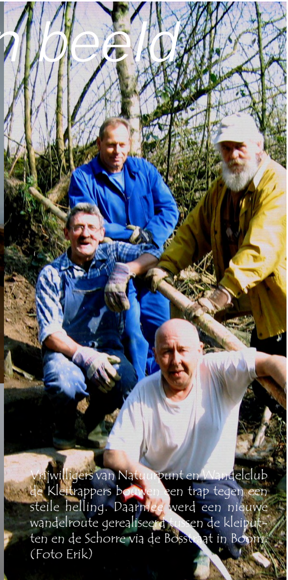
Vrijwilligers van Natuurpunt en Wandelclub de Kleitrapppers bouwen een trap tegen een steile helling. Daarmee werd een nieuwe wandelroute gerealiseerd tussen de kleiputten en de Schorre via de Bosstraat in Boom.