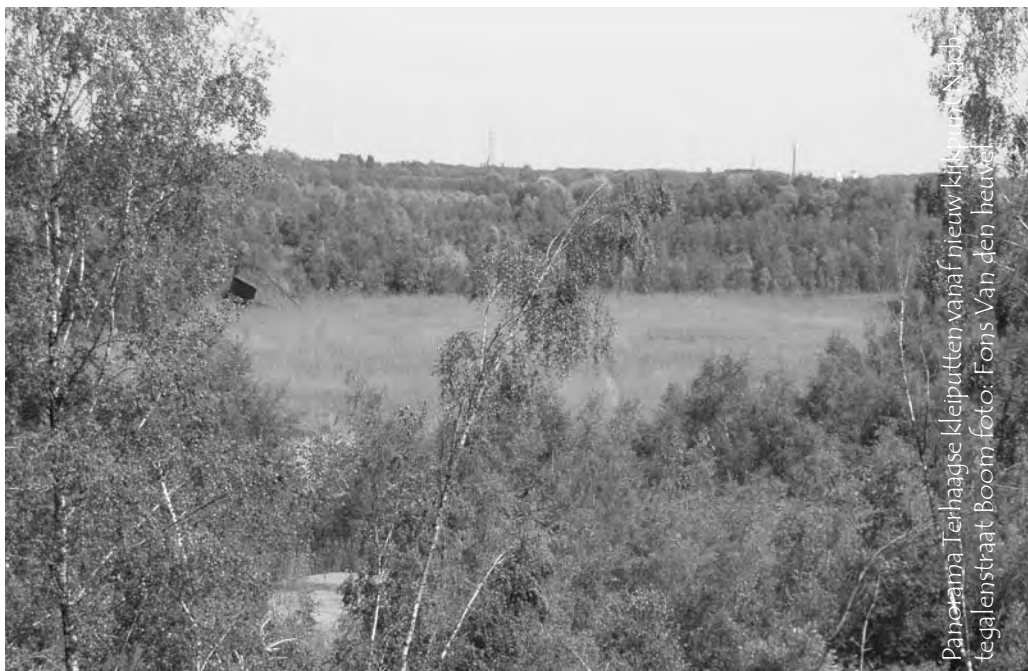
Panorama Terhagse kleiputten vanaf nieuw kluipunt Nisch tegalenstraat Boom