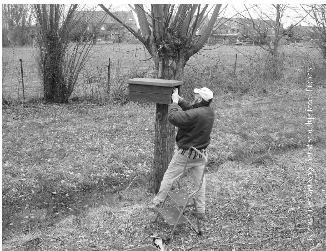
Nieuwe nestkast voor het steenuiltje