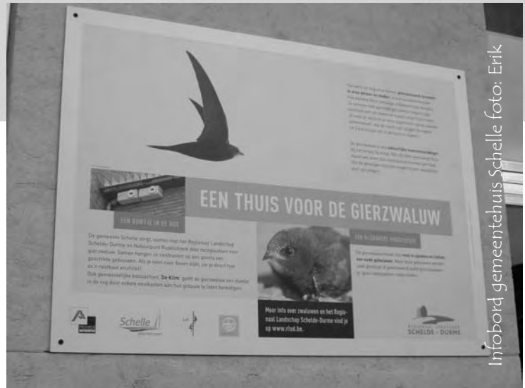
Infobord gemeentehuis Schelle

Om het aanbod aan geschikte broedplaatsen te verhogen, werden op initiatief van Regionaal Landschap Schelde-Durme op maandag 14 maart, telkens 3 combi-nesten voor gierzwaluwen onder