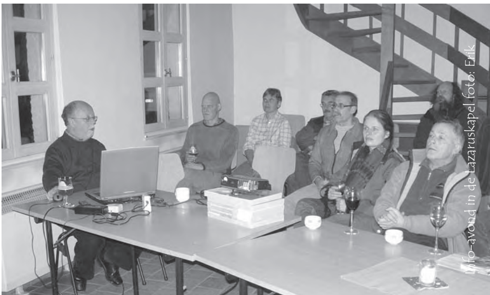
Info-avond in de Lazaruskapel