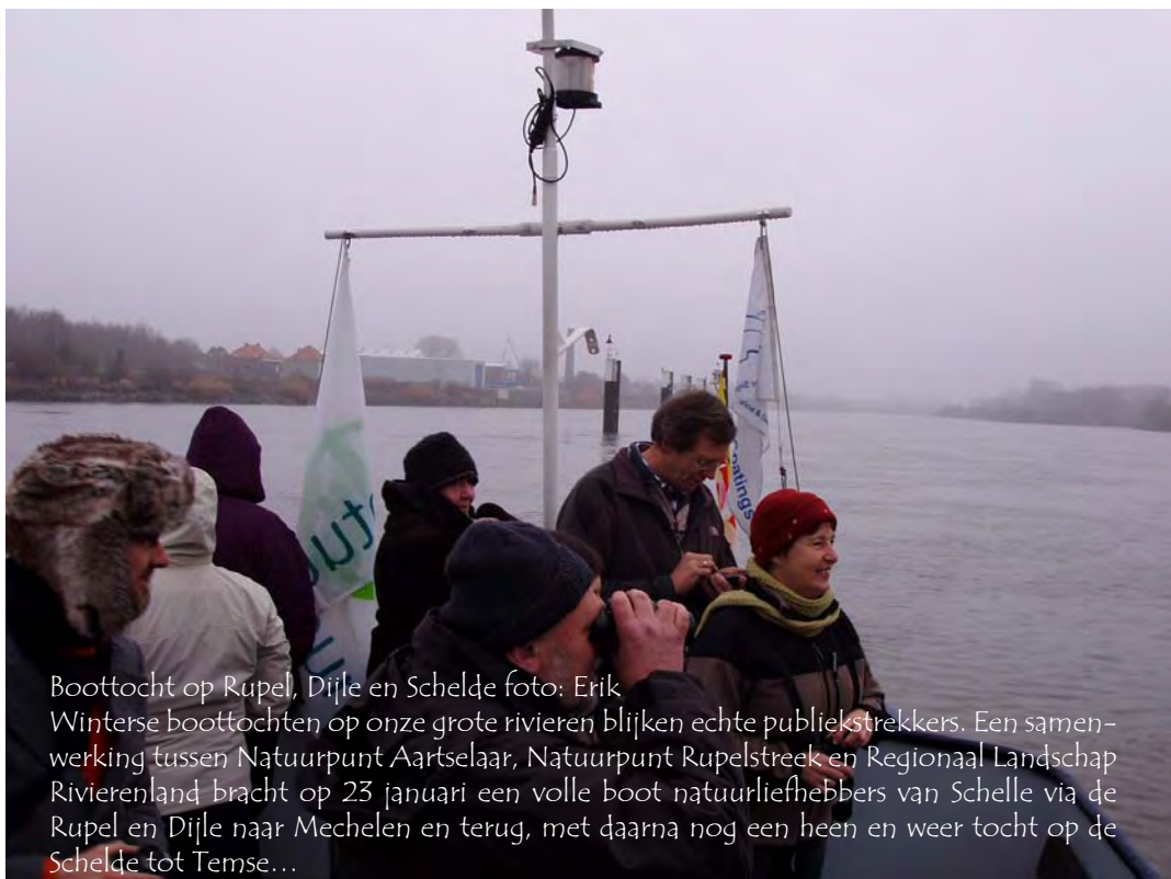
Boottocht op Rupel, Dijle en Schelde foto: Erik Winterse boottochten op onze grote rivieren blijken echte publiekstrekkingen. Een samenwerking tussen Natuurpunt Aartselaar, Natuurpunt Rupelstreek en Regionaal Landschap Rivierenland bracht op 23 januari een volle boot natuurliefhebbers van Schelle via de Rupel en Dijle naar Mechelen en terug, met daarna nog een heen en weer tocht op de Schelde tot Temse...