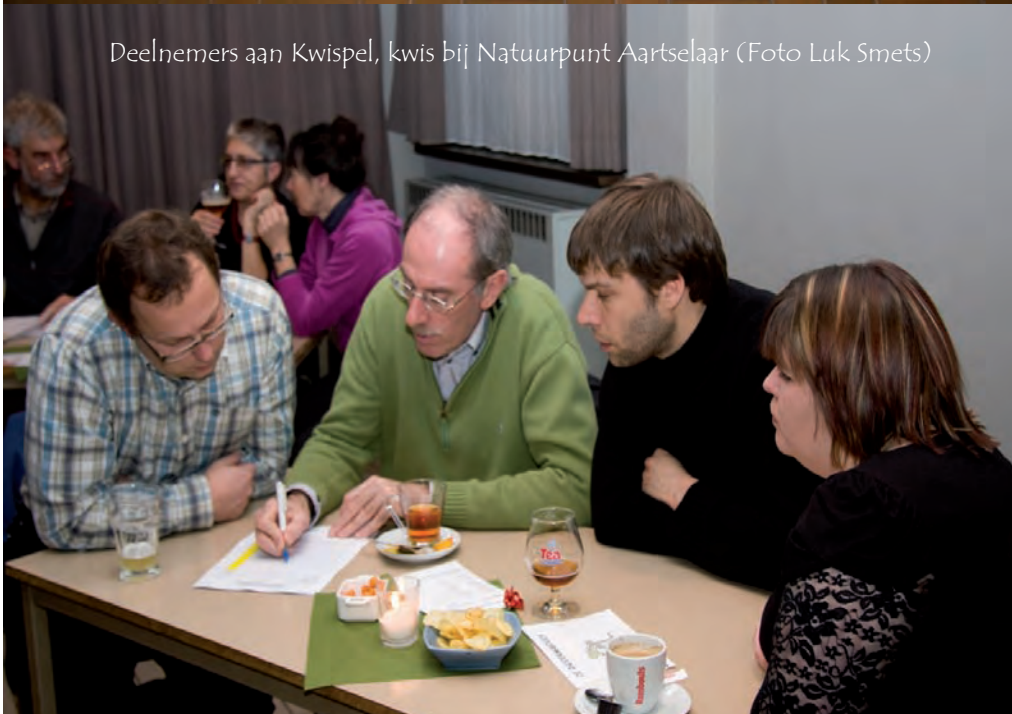
Deelnemers aan Kwispel, kwis bij Natuurpunt Aartselaar