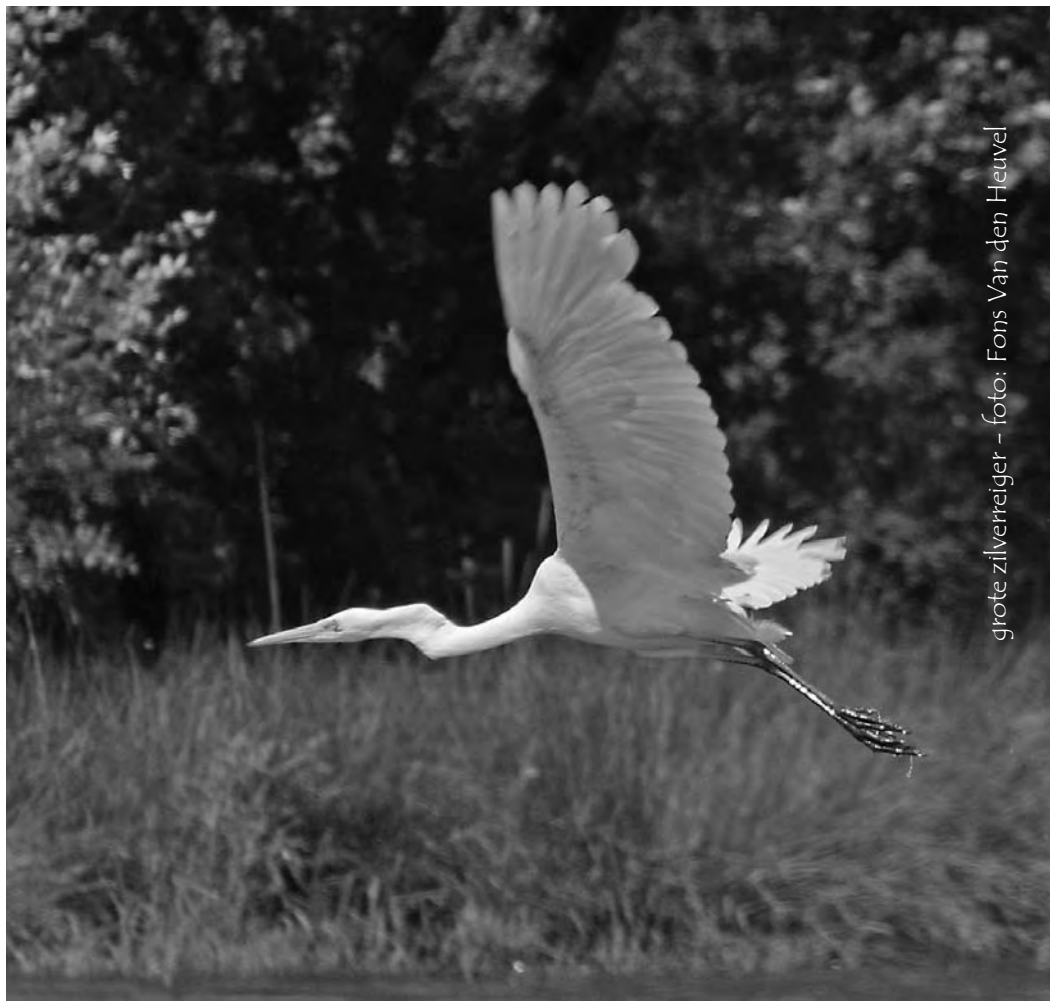
grote zilverreiger

Opvallend zijn de vele soorten vogels die bij ons eerder als 'zuidelijk' bekend staan, o.a. koereiger, purperreiger en grote zilverreiger, slangenarend en dwergarend, witwangstern, steltkluut en rode patrijs. De publieke vogelkijkhutten zijn dan ook voornamelijk gericht op vogelobservatie, liefst met een telescoop. Voor vogelfotografie zijn ze eigenlijk minder geschikt, maar soms is een geslaagde opname vanuit zo'n hut toch wel mogelijk.