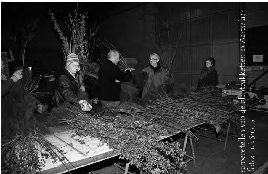
samenstellen van de plantpakketten in Aartselaar

De volgende vergadering voor de Werkgroep Behaag natuurlijk staat gepland voor dinsdag 31 mei in het