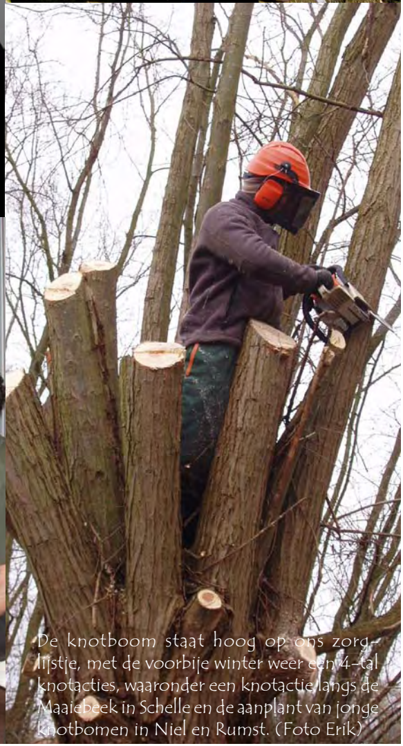
De knotboom staat hoog op ons zorglijstje, met de voorbije winter weer een 4-tal knotacties, waaronder een knotactie langs de Maalebeek in Schelle en de aanplant van jonge knotbomen in Niel en Rumst.