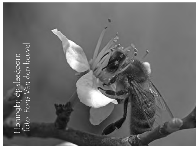
Honingbij op sleetdooim