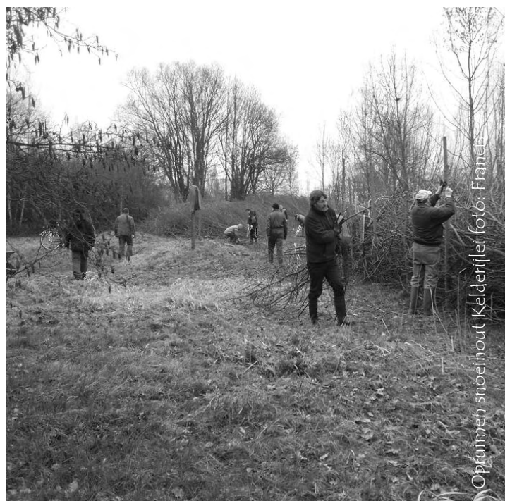
Opruimen snoeihout Kelderijlei

Zo zie je maar, dat we de accenten van Natuurpunt en Velt in het natuurgebiedje van de Kelderijlei in Schelle netjes in balans weten te houden !