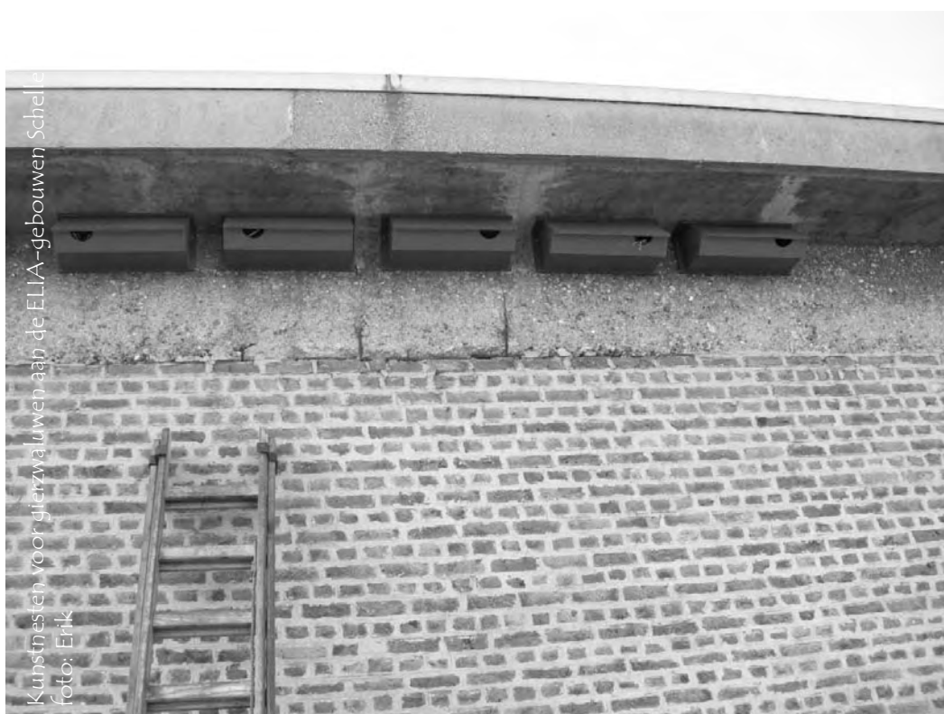
Kunstnesten voor gierzwaluwen aan de ELIA-gebouwen Schelle