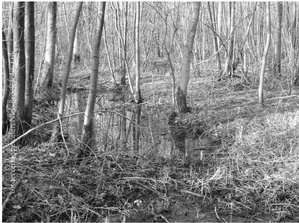
Uitgeveerde percelen Nlts-Broek

Een notarisakte uit 1733 geeft nog meer details. Hierin blijkt dat er tussen 1729 en 1733 op de uitgeturfde stukken land méér dan 80.000 elzen werden aangeplant, waarvan de stammen op 3 jaar tijd “redelijk dik” waren geworden. Elzenhout werd in de Rupelstreek vooral gebruikt in de paapovens van de steenbakkerijen om het baksel (stenen, pannen, tegels) blauw-zwart te smoren. Dit min of meer harsachtige elzenhout brandt met fijn zwart roet wat een extra zwarte teint geeft aan het gesmoorde goed. Daarnaast werd er ook vast gesteld dat het “uytgetorven” land na zware arbeid en kosten kon omgezet worden in goed wassend bos. Hierdoor brachten deze percelen méér interest op dan te voren en bovendien groeiden de aangeplante bomen zodanig dat “ van de honderd roeden