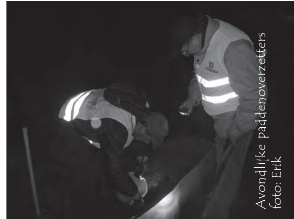
Avondlijke paddenoverzetters