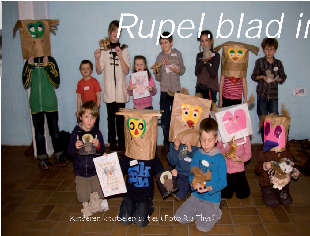
Kinderen knutselen uiltjes