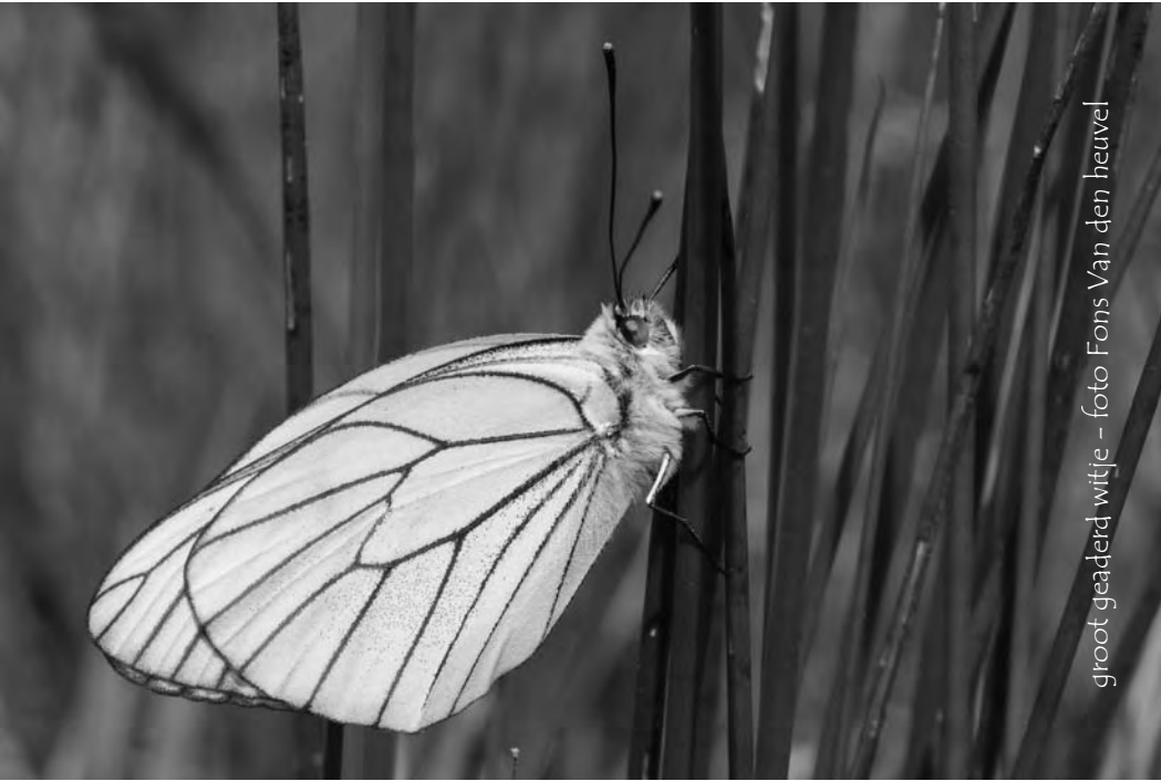
groot geaderd witje

komen. Naast orchideeën zijn er natuurlijk tal van andere bloemen (ook enkele zeldzame soorten), en dat betekent tegelijk ook veel vlinders, 115 soorten dagvlinders namelijk. Met de talloze kevers, libellen en juffers er nog bij, mogen naast de macrolens dus ook de betreffende veldgidsjes zeker niet vergeten worden bij een bezoek aan dit stukje 'man-shaped' natuur in Frankrijk.