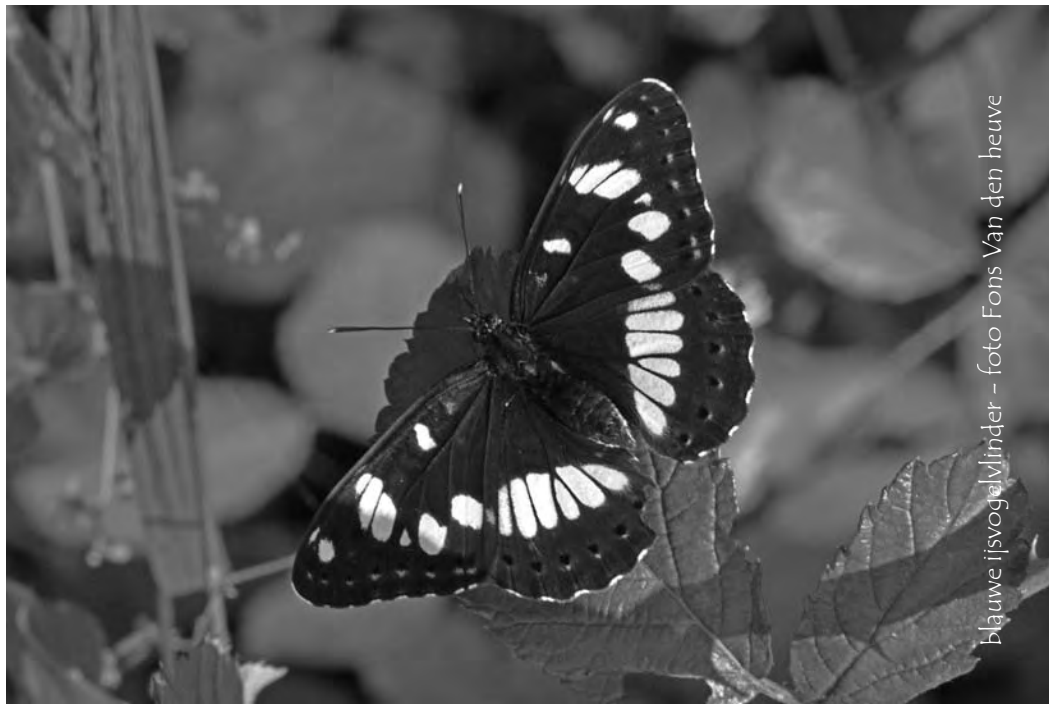
blauwe ijsvogelvlinder

In mei en juni is La Brenne ook een paradijs voor liefhebbers van orchideeën. En naargelang die twee maanden vorderen, komen en verdwijnen er steeds andere van de 48 soorten (en nog enkele hybriden) die er voor-