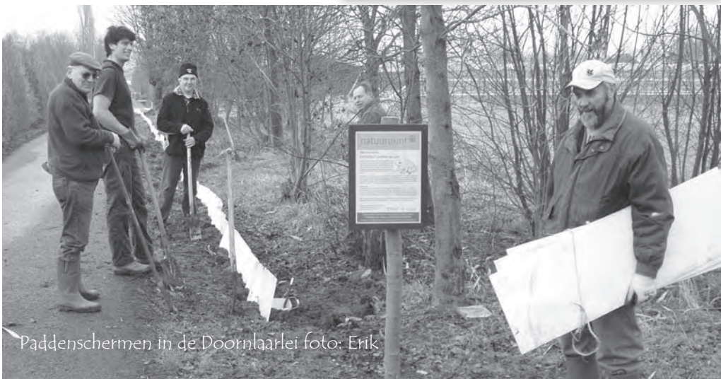
Paddenschermen in de Doornlaarlei

Enkele weken later, op zondagochtend 27 februari waren er al 297 padden,