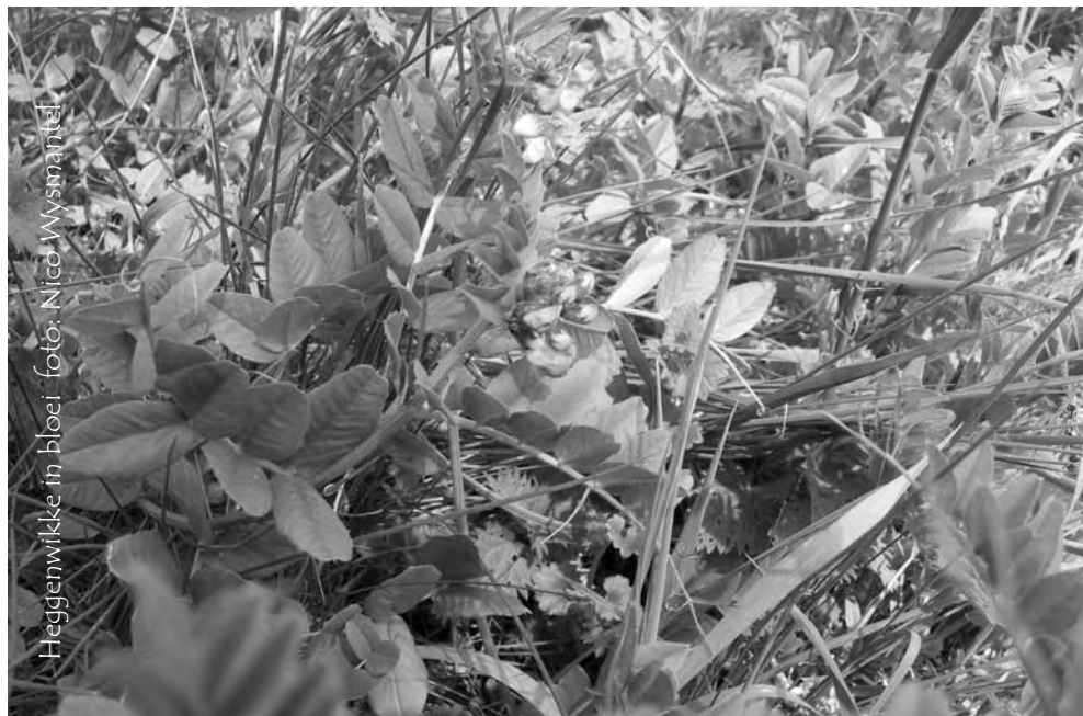
Heggenwikke in bloei.

Een wat vreemde eend in de bijt is Damastbloem Hesperis matronalis . Deze komt algemeen (tot lokaal zelfs zéér algemeen) voor op en rond het wandelpad dat door het broek slin-