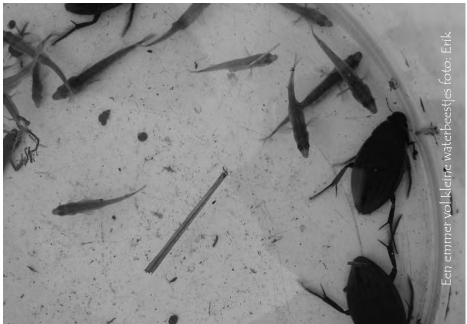
Een emmer vol kleine waterbeestjes

Meld vooraf je deelname aan Ilse: 03/887.51.69 of roovers_wachters@hotmail.com