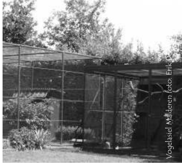
Vogelasiel Malderen

Vooraf inschrijven bij: Erik tel: 03/887.13.72 of erik.dk@skynet.be