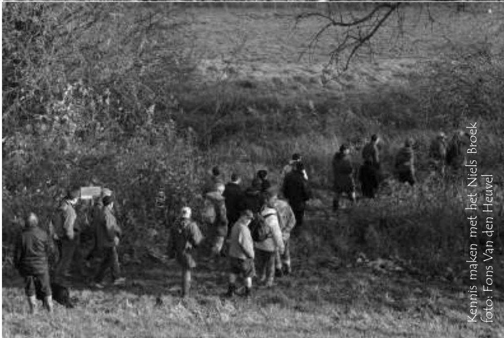
Kennis maken met het Niels Broek