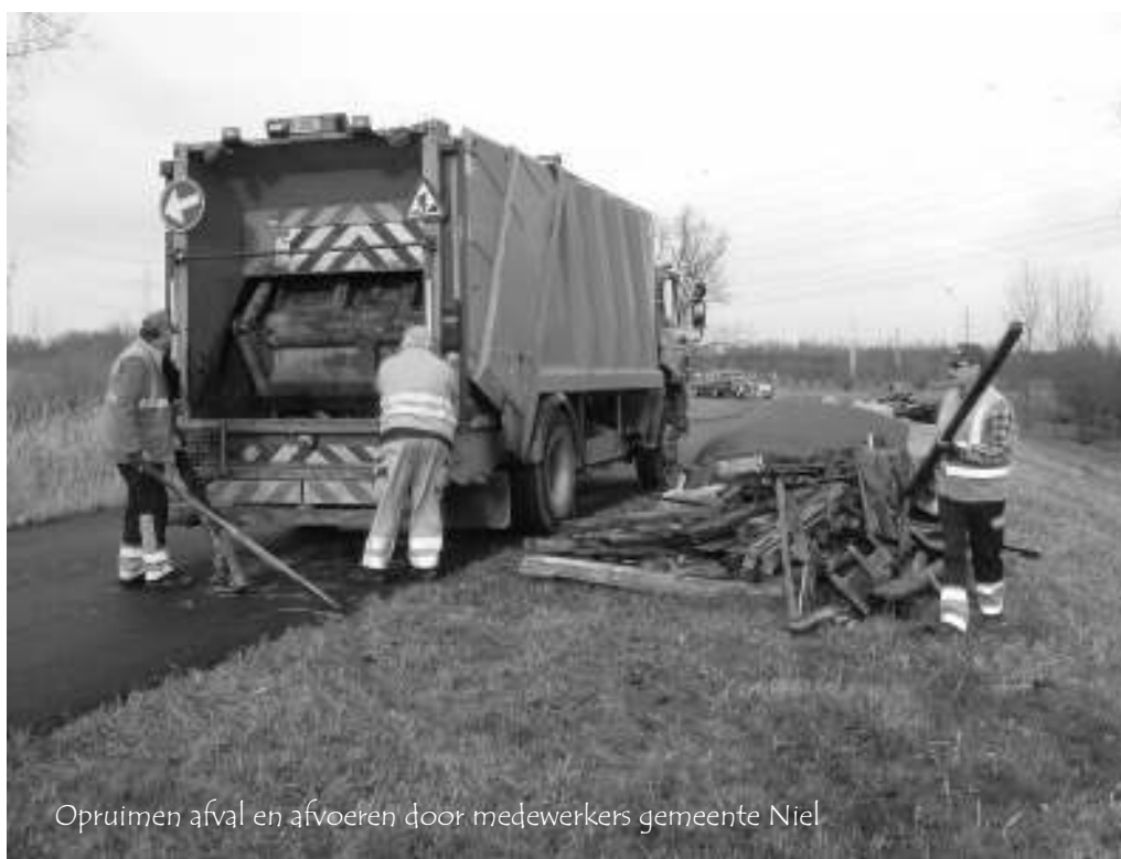
Opruimen afval en afvoeren door medewerkers gemeente Niel

Tijdens de lente plannen we het plaatsen van een aantal infoborden, waarbij de wandelaar info krijgt over natuur in het Niels Broek en tevens over de aanpalende Rupelschorren. Ook de Rupel krijgt ruime aandacht op één van de infoborden en ook het vogelrijke Noordelijk eiland aan de overkant van de Rupel wordt erop gepromoot als het superbe vogelkijkgebied in onze regio. De bezoeker aan het Niels Broek zal ook uitgenodigd worden om ook het andere Nielse natuurgebied Walenhoek te verkennen. Met een bezoekje aan het Natuurpuntbezoekerscentrum de Paardenstal als een toemaatje.