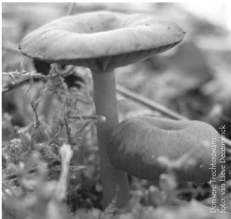
Donkere Trechterzwam