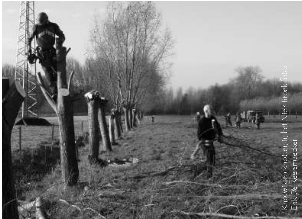
Knotwilgen knotten in het Niels Broek

Een ander belangrijk streefdoel is communicatie. Enerzijds naar de gemeente Niel, die we erg graag als bondgenoot willen betrekken bij onze plannen in het Niels Broek. Countdown 2010 of het jaar van de biodiversiteit lenen zich daar uitstekend toe. Een andere bondgenoot kan het regionaal landschap Rivierenland zijn. Onze belangrijkste bondgenoten zijn echter de burens van het Niels Broek. En burens zien we bijzonder ruim. In eerste instantie willen we inwoners uit Niel en ook uit Schelle informeren over onze plannen in het Niels Broek. Eind oktober kregen 500 meest naaste burens van het Niels Broek een eerste Natuurpuntflyer in hun brievenbus. Met enige info over onze plannen en een uitnodiging om kennis te maken met het Niels Broek. 24 deelnemers aan onze eerste kennismakingswandeling op 7 november waarbij heel wat bu-