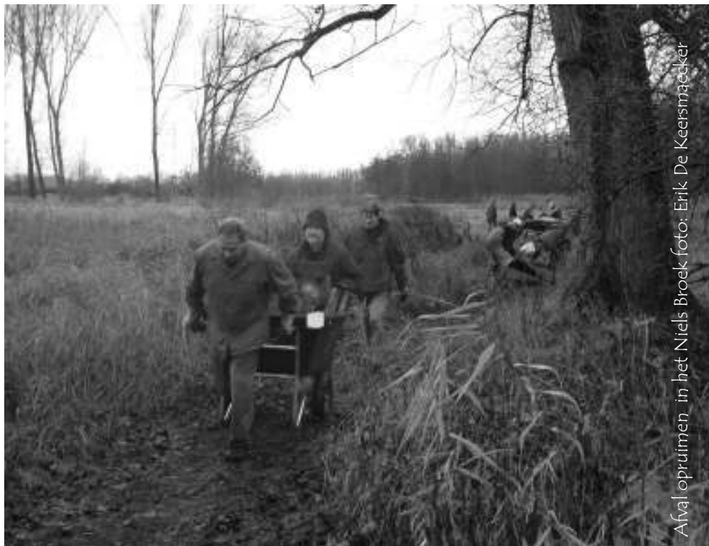
Afvall opruimen in het Niels Broek

ren, bewezen dat we goed bezig zijn. Op vrijdag 5 maart plannen we een eerste Niels moment, waarbij we alle dichte en verre burens van het Niels Broek uitnodigen. Afspraak om 20u in het kleine zaaltje van café den Tighel, Dorpsstraat 42 te Niel.