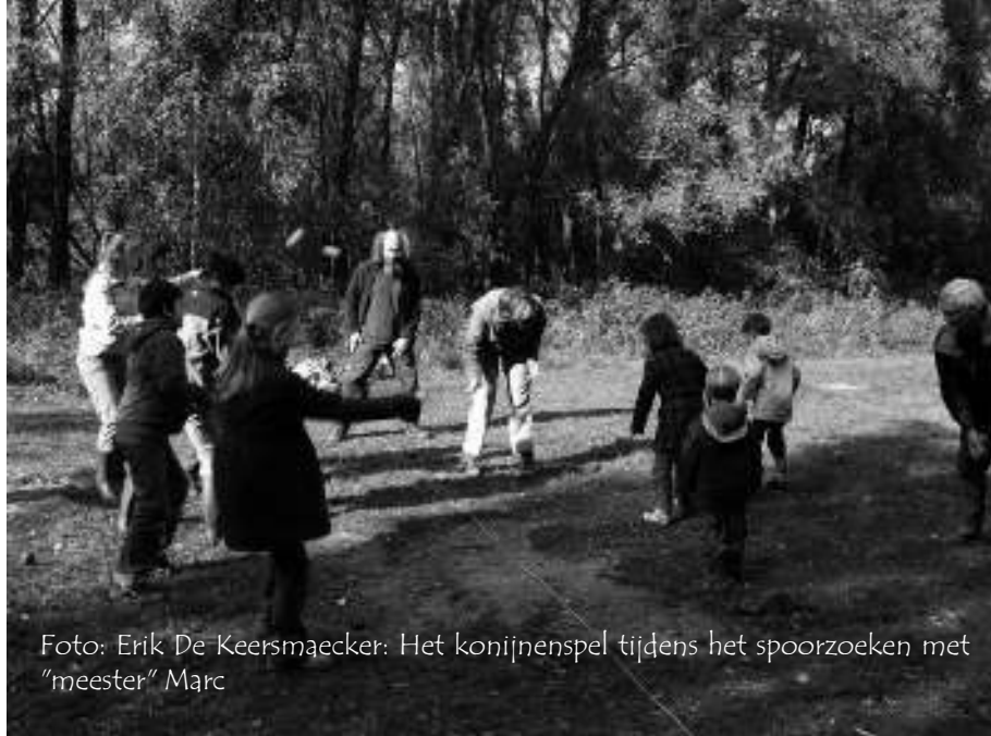
Het konijnspeel tijdens het spoorzoeken met "meester" Marc