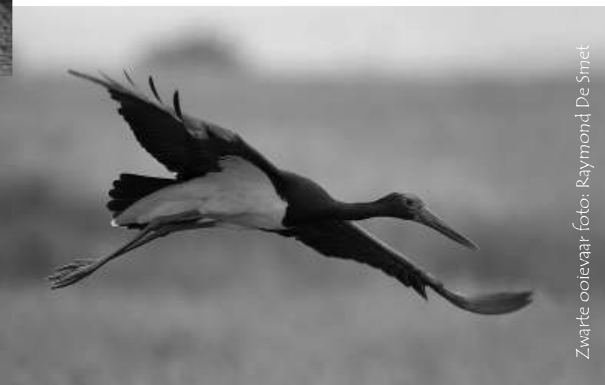
Zwarte ooievaar

Opgelet: het auditorium bevindt zich in het nieuwe congrescentrum van de Schorre. Het gebouw is ook bereikbaar via de parking aan de Kapelstraat.