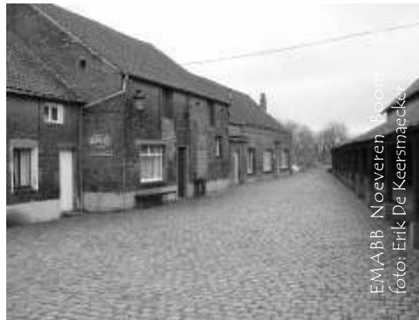
EMABB Noeveren Boom

Info: Erik De Keersmaecker 03/887.13.72 of erik.dk@skynet.be