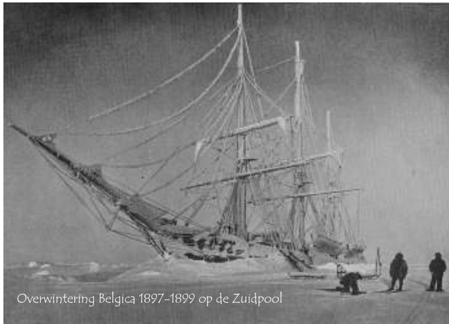
Overwintering Belgica 1897-1899 op de Zuidpool

De bouw van de Belgica is een realisatie van De Steenschuit vzw in samenwerking met de VDAB.