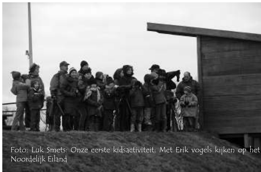
Foto: Luk Smets: Onze eerste kidsactiviteit: Met Erik vogels kijken op het Noordelijk Eiland

Meestal is de doelgroep kinderen van basisschoolleeftijd, maar we boden ook al enkele kleuteractiviteiten aan. En ook de jongeren van de eerste graad van het middelbaar onderwijs worden sporadisch aangesproken. De praktijk leert wel dat zij iets minder afkomen op dit aanbod. Misschien schrikt de benaming Kids hen wel af .... begrijpelijk !