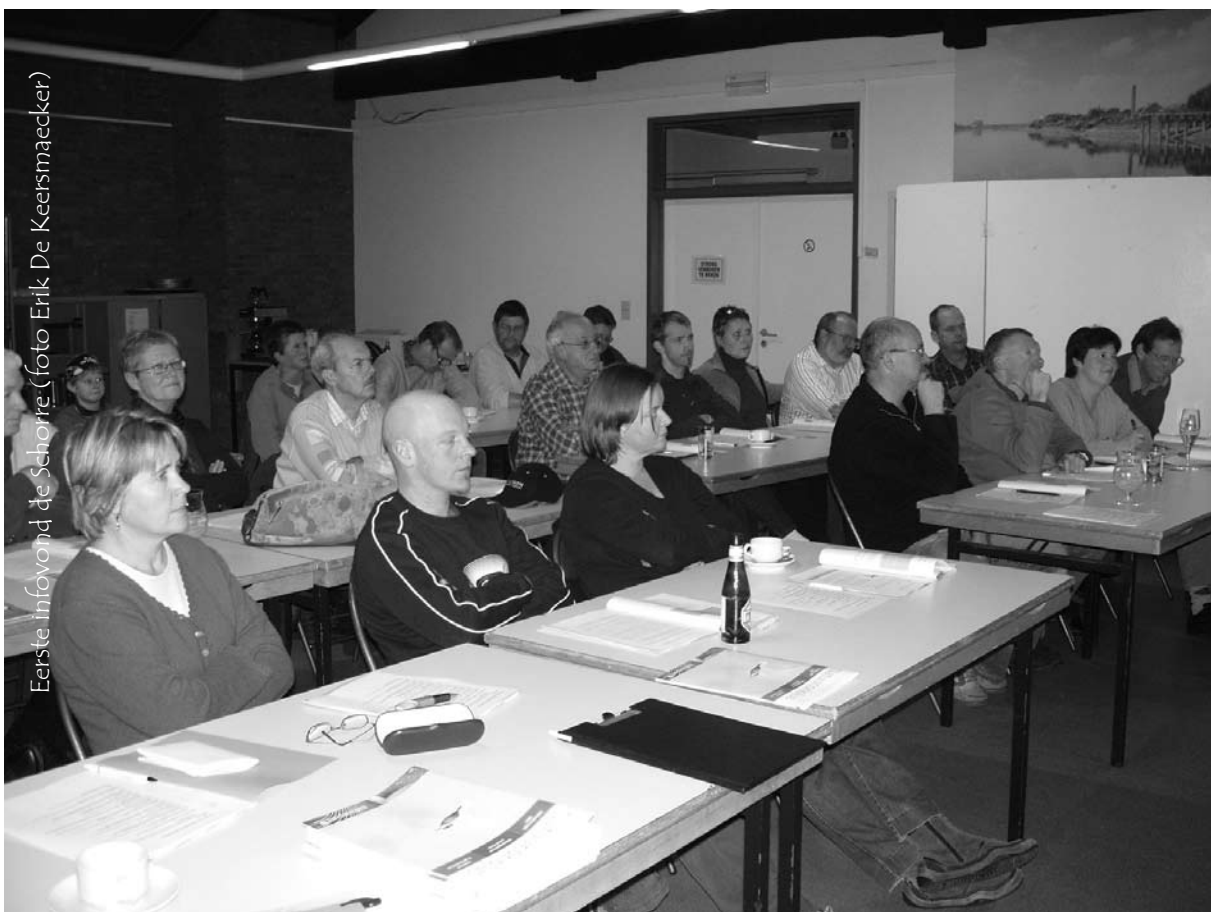
Eerste infoavond de Schorre

die kleine rietgans te horen, daar had Koen over gesproken tijdens de eerste infoavond. Karen klom zelfs op een picknicktafel om deze mooie ganzen met hun ronde kop en korte snavel goed te kunnen bekijken. Vol enthousiasme probeerden we onze pas verworven kennis in praktijk te brengen. Naast ganzen deden we toffe waarnemingen van ransuil, slechtvalk, wulp, goudplevier, torenvalk, smelleken