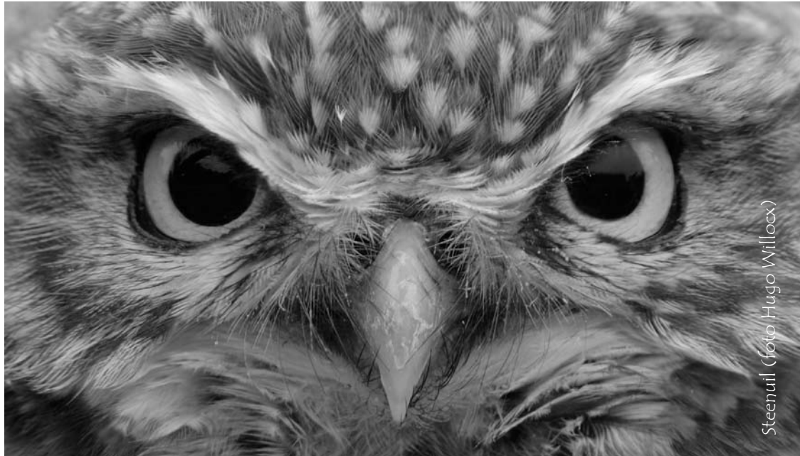
Steenuil