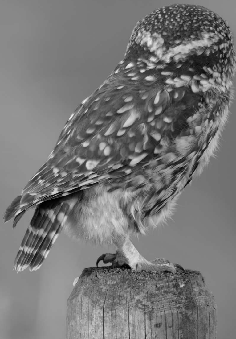
achterkant kop Steenuil