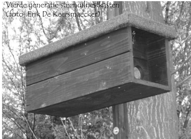
Vierde generatie steenuil nestkasten