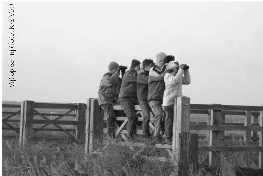
Vijf op een rij