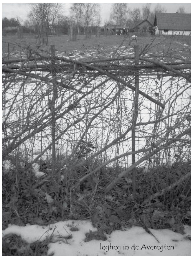
legheg in de Averegten

Info en inschrijvingen: Ria Thys, 03 / 289 73 66 ria.thys@telenet.be