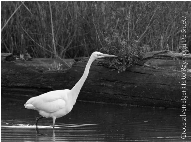
Grote zilverreiger

16 april op het Noordelijk Eiland en hier werd ook telkens één overtrekkende vogel gezien op 26 maart en 25 april. Een groep van 13 Ooievaars trok op 2 maart over de Tolhuisstraat te Schelle, over AWW 5 te Rumst trokken in totaal 26 exemplaren tussen 5 april en 24 mei, 4 exemplaren foerageerden op 24 mei langs de Doornlaarlei te Rumst en werden iets later ook