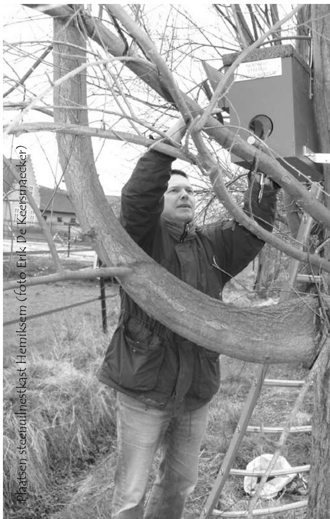
Plaatsen steenuil nestkast Hemiksem

En als het aan deze nieuwe generatie nestkasten ligt, gaan de steenuiltjes in onze regio misschien toch nog een mooie toekomst tegemoet. Ook al omdat steeds meer gemeenten ons nestkastenproject gaan steunen. Zo kregen we reeds eerder de bevestiging van de gemeenten Boom, Hemiksem en Rumst dat ze het plaatsen van nestkasten op hun grondgebied financieel gaan steunen en ook in Schelle werken onze Natuurpuntmedewerkers in de gemeentelijke MINA-raad aan een voorstel om het plaatsen van nestkasten te betoelagen.