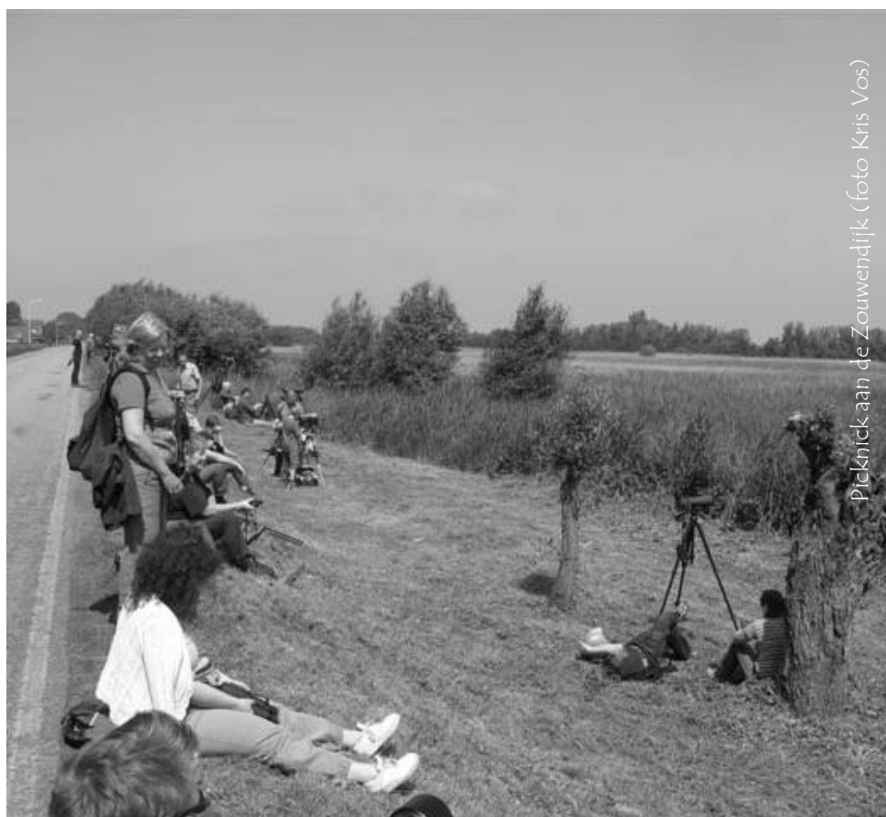
Picknick aan de Zouwendijk

Nadat de groep zich opnieuw in beweging had gezet, kwamen we na een fikse wandeling aan bij de rietlanden langs de Zouwendijk. Net op tijd kwam ook de nieuwe bus eraan met onze picknick aan boord. En metéén zaten we voor de picknick op de pas gemaaide dijk, letterlijk op de eerste rij met voor ons een ware spektakelshow van aan- en afvliegende purperreigers, hoe ze landen en opstijgen,