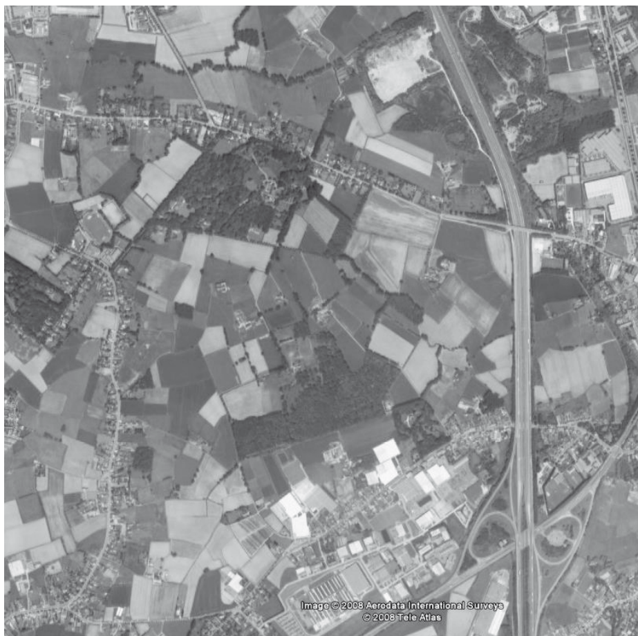
huidige ruimtegebruik

Momenteel is er van het bosuitbreidingsgebied 96 ha in landbouwgebruik. De overheid (ANB) is bereid deze gronden aan te